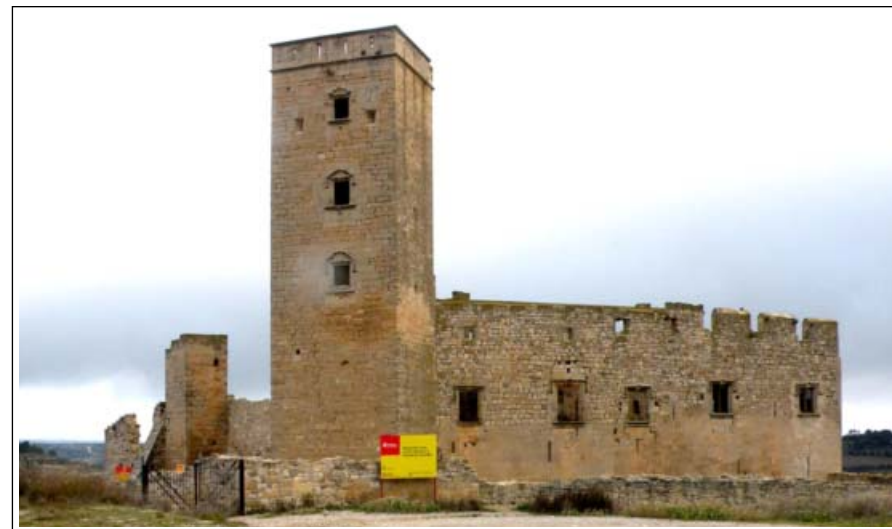
CASTELL DE CIUTADILLA.

El poble de Ciutadilla està situat a la riba esquerra del riu Corb, a 515 m d'altitud, en una zona aturonada de la serra, que domina les valls del riu Corb i de la riera de Boixerons. El poble es formà a redós del castell i va