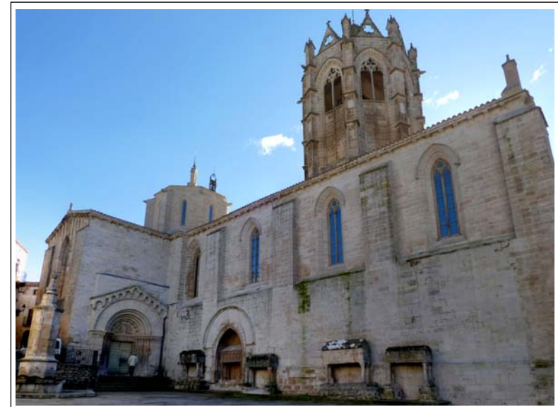
SANTA MARIA DE VALLBONA DE LES MONGES.

L'origen del monestir, documentat l'any 1154, es deu a agrupacions mixtes d'anacoretas liderades per Ramon de Vallbona, que seguien una regla inspirada en la benedictina. Poc més tard els homes marxaren a unes terres cedides pel comte Ramon Berenguer IV. El 1172 vingueren quatre monges del monestir cistercenc de Tulebras (Navarra), que era el primer en terres