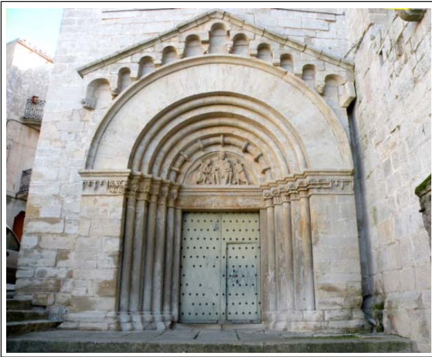
MONESTIR DE VALLBONA DE LES MONGES.

Reberen grans donacions dels reis i de la noblesa i les possessions foren augmentant ràpidament. Al segle XIII es constituí la baronia de Vallbona, que en tenia la jurisdicció el monestir. Durant els primers tres segles, l'abadia va tenir una gran vitalitat: hi entraren filles de la principal noblesa catalana; dessecaren la vall que era pantanosa; varen promoure la