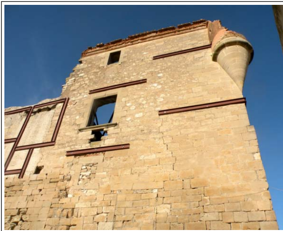
RUINES DEL CASTELL DE MALDÀ.