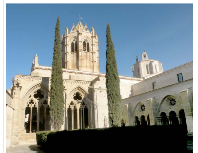
VALLBONA DE LES MONGES. El campanar des del claustre.

El conjunt monàstic segueix els sistemes arquitectònics clàssics cistercencs dels segles XII i XIII, és a dir l'estil de transició del romànic al gòtic, llevat de les construccions posteriors que ja són plenament gòtiques. L'església és de planta de creu llatina, d'una sola nau bastant llarga, capçada per un transsepte, un absis central i dues absidioles, tots tres carrats. Les cobertes són totes amb volta apuntada. En el centre del creuer s'alça, sostingut per trompes, un bonic cimbori octogonal amb finestres ogivals, cobert amb volta de creueria i al seu damunt hi ha la campana de les hores. Al mig de la