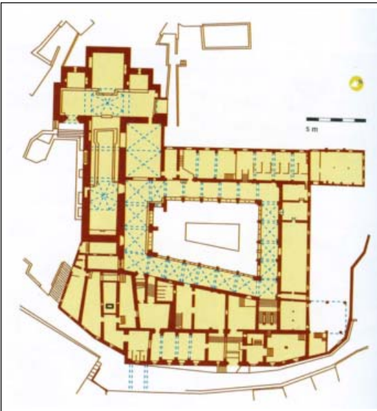
VALLBONA DE LES MONGES. Planta (Guies del Romànic).

construcció de granges i pobles i també crearen diverses filials. El 1380 l'abadessa comprà al rei Pere III, la plena jurisdicció (civil i criminal) de totes les seves possessions. En aquesta època la comunitat, la formaven unes 150 monges.