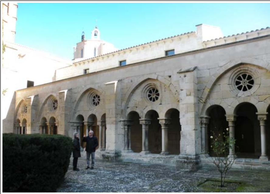
SANTA MARIA DE VALLBONA DE LES MONGES. Claustre.

nau, també sostingut per trompes, bastiren, més tard, al segle XIV, un bellíssim cimbori campanar octogonal gòtic, amb finestrals ogivals de traceria i una coberta piramidal. Acull la resta de les campanes.