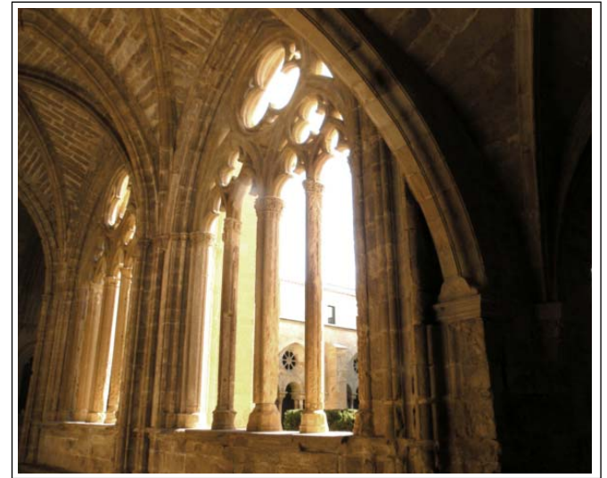
VALLBONA DE LES MONGES. Claustre del monestir.

1835, el monestir se salvà de la desamortització i la vida monàstica va continuar. La Guerra Civil obligà les monges a abandonar el monestir, que va sofrir importants destruccions. L'any 1986, es varen iniciar unes grans obres de restauració que, més endavant, permeten reprendre la vida monàstica. Actualment hi ha una petita comunitat composta per vuit monges.