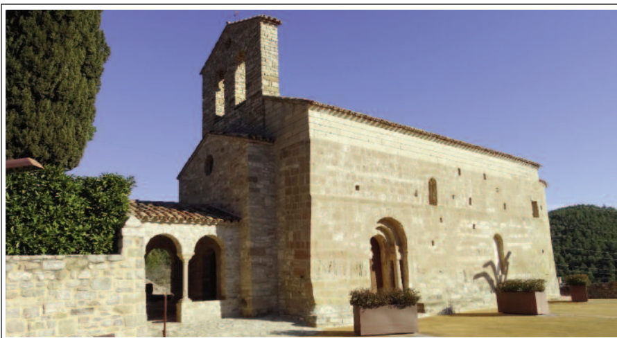
SANTA MARIA DE VECIANA,

Se sap, a través de documents, que exercia com a parròquia l'any 1025-1050, època de la repoblació d'aquestes terres i de la construcció de l'església actual.