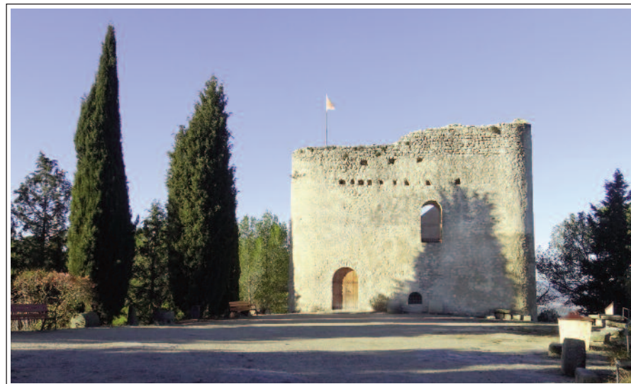
GRAN TORRE DEL CASTELL DE LA TOSSA DE MONTBUI.

La Tossa de Montbui, del terme municipal de Santa Margarida de Montbui, és una muntanya de 620 metres que s'alça als plans del sud-oest d'Igualada, essent un mirador privilegiat de tota la contrada. Mirant cap a Igualada es poden observar alguns badlands, esculls, "esterra-