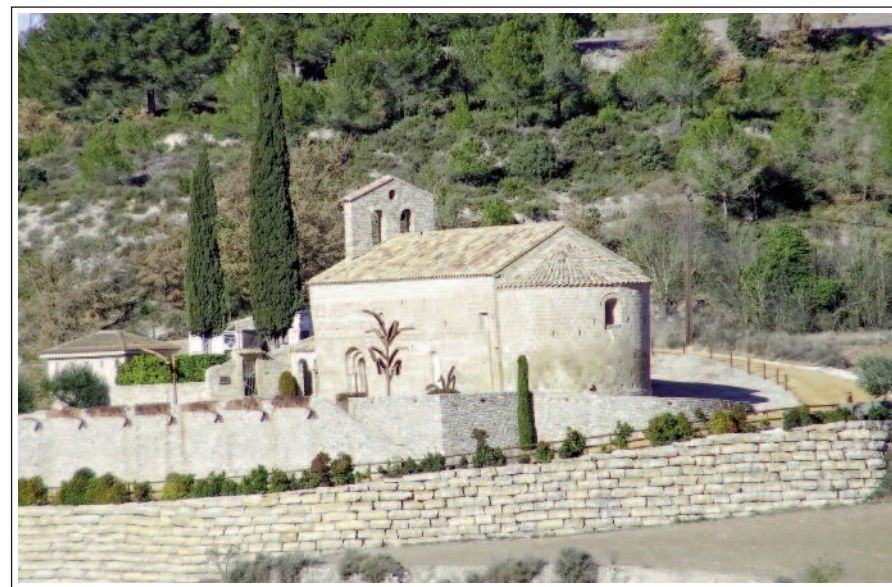
SANTA MARIA DE VECIANA.

L'entorn on hi ha l'església és ben urbanitzat i comprèn també el cementiri. El temple és d'una sola nau, capçat per un absis semicircular, sense cap decoració. De les tres finestres que té, destaquem la de la façana de migdia, que té tres arcs de mig punt, concèntrics. El portal de migdia té tres arcs de mig punt en degradació. L'arcuació central, de secció quadrangular, amb impostes, descansa sobre uns capitells i columnes modernes. Aquesta arquivolta i les impostes són decorades amb relleus de motius geomètrics i vegetals. També són moderns: la volta de la nau, l'espadanya, el portal de la façana de ponent i l'atri adjunt.