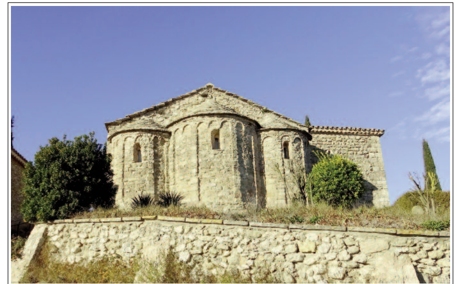
SANTA MARIA DE MONTBUI. Absis.

L'estructura d'aquest edifici manifesta dues etapes constructives ben diferenciades. La primera correspon a la part central de la basílica de tres naus i la segona a les parts dels extrems: absis i final de ponent. L'aparell de l'obra primera és rústec, de pedra trencada en filades irregulars (segle X). La segona és de petits carreus escairats (segle XI).