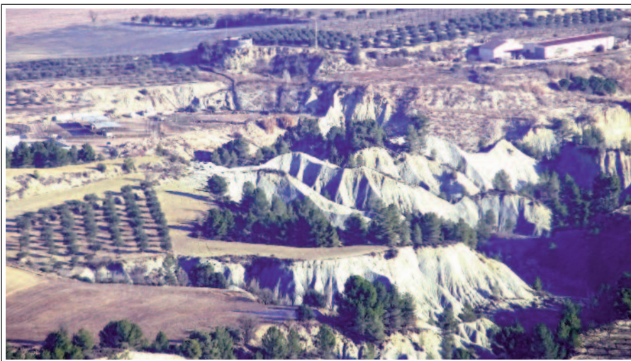
ESTERRAGALLS o ESCULLS CORAL·LINS, vistos des del mirador de la Tossa de Montbui

Després del pas d'Al-Mansur (987), el bisbe Fruetà, va reconstruir el castell, i construí una gran torre; però consta que el 990 el repoblament fou abandonat per una gran secada. L'any 1024, el bisbe de Vic, Oliba, infeudà el castell al levita Guillem de Mediona, que va acabar la gran torre i va construir els tres absis de l'església, segurament cap al 1023.