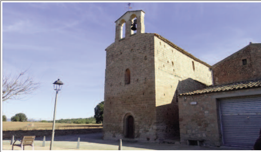
SANT PERE DESVIM

És esmentada documentalment l'any 1069, quan va ser donada a la Santa Creu de Barcelona. El 1246 va passar a dependre de Santa Anna, també de Barcelona i l'any 1542 la va comprar el monestir de Montserrat. En els seus inicis havia estat parròquia, però a finals del segle XIX passà a ser sufragània de Santa Maria dels Prats de Rei.