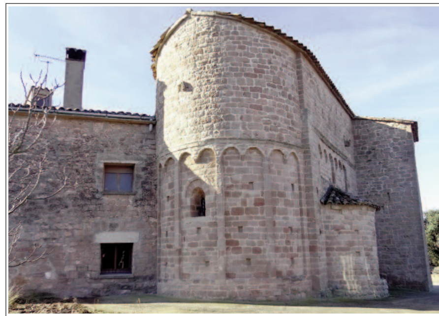
SANT PERE DESVIM. Absis sobrealçat.

Al poble hi ha un conjunt de carrerons, relativament ordenats, i amb moltes cases grans, amb alguns arcs de pedres ben tallades i algunes d'erosionades. Digna d'esment és la casa de la Vila i algunes altres amb finestrals gòtics. L'església parroquial és dedicada a santa Maria i situada en un extrem de la vila, a tocar del lloc on passava la muralla. A l'atri hi ha col·locades cinc làpides romanes trobades allà mateix i al costat de la rectoria hi ha un cementiri romà tardà. Al raval del nord-est hi ha una capelleta dedicada a sant Joan, al lloc on hi havia hagut un hospital de peregrins. I, encara, en una placeta presidida per una creu de terme, hi ha un santuari marià, dedicat a la Mare de Déu del Portal, just al lloc on hi havia el Portal Major.