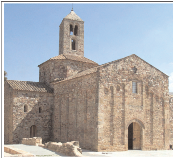
ESGLÉSIA ROMÀNICA DE SANTA MARIA D'ÈGARA.

De Sta. Maria s'han conegut pràcticament totes les fases cronològiques representades pels diferents edificis que successivament van anar ocupant el lloc, l'últim dels quals, és el que podem contemplar avui d'estil romànic llombard. Aquest és el de dimensions més reduïdes si considerem, com han posat al descobert les excavacions, que els anteriors havien ocupat l'espai de l'edifici actual, la plaça amb el mosaic i tot l'espai de la rectoria.