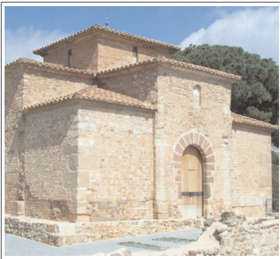
SANT MIQUEL. Se li havia atribuït la funció de baptisteri. Els darrers estudis i excavacions han provat que es tracta d'un recinte funerari.

Aquesta pintura que ara considerem ornamental va ser realitzada, en el seu moment, només amb una intenció pràctica. La pretensió era regular l'a-