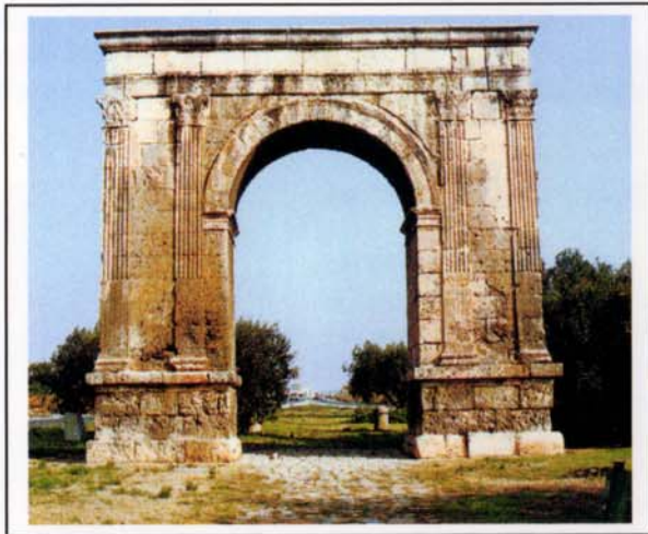
ARC DE BERÀ. Fragment.

Arc de triomf romà, aixecat sobre la via Augusta. Fou erigit a la memòria i voluntat testamentària de Luci Licini Sura, general cònsol romà en els temps que van del segle I al II, i un dels homes més rellevants del seu temps. Durant l'imperi la via Augusta era la carretera que enllaçava Roma amb Cadis. En bona part seguia una ruta ja vella, que és coneguda a través de l'itinerari d'Antolí, els vasos de Vicarello i algun mil·liari. És la ruta que ens dona raó de l'existència de la nostra Arona.