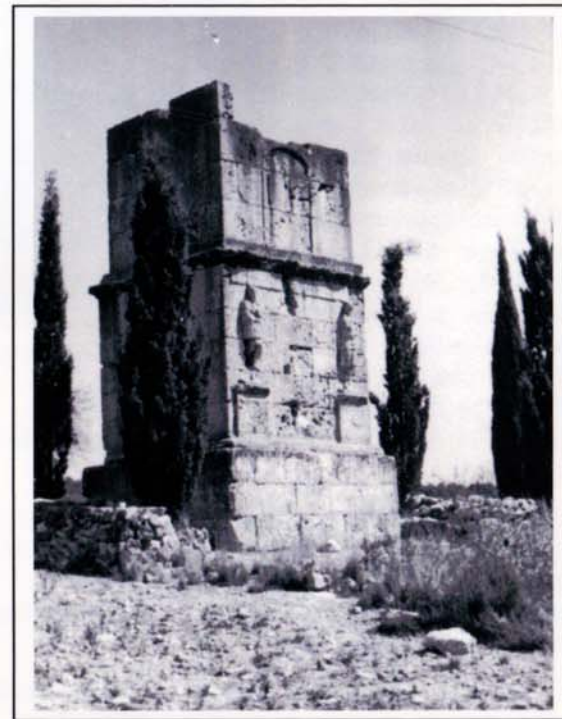
TORRE DELS ESCIPIONS.

Entre els romans era costum enterrar els difunts al costat dels camins importants. Al costat de la via Augusta hi ha aquest monument funeràri. La tradició li dóna el nom de la Torre dels Escipions, en nom dels dos germans restauradors de Tarragona pels volts de l'any 210 abans de Crist. El parament de l'edifici és amb carreus molt ben tallats i ajustats, cosa que fa suposar la seva construcció al segle I després de Crist i que per tant no té res a veure amb els germans guerrers. S'ignora la persona o família a qui fou dedi-