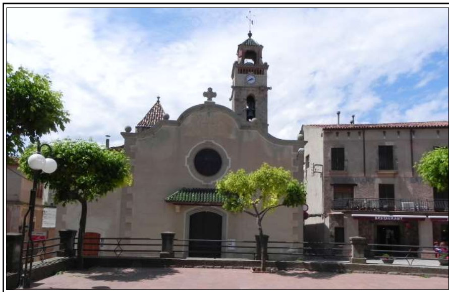
SANT LLORENÇ SAVALL. Façana de l'església parròquial.

L'altar major va ser decorat l'any 1959, (Castells 1961), amb un mural fet per l'artista sabadellenc, Fidel Trias Pagès (1918-1971). Aquest artista ja havia pintat altres murals potser el primer va ser el que va pintar a Sant Feliu del Racó, a la capella del Santíssim Sagrament, entre els anys 1953-55, en van seguir d'altres, el de la capella de la Santa Creu de Bellaterra, (1958), el