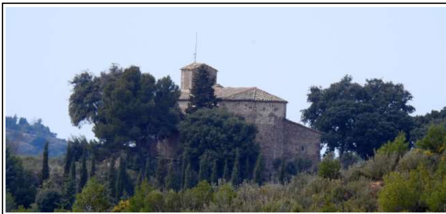
SANT FELIUET DE VALLCÀRQUERA. Vista general des de Sant Feliu Vell.

Ja el 966 ens surt una referència quan es redacten els límits d'unes terres que es venen a Lacera, al lloc del Genescar, que limiten al nord, de circi in terra de Sancti Felix màrtir, ... (1) d'on es pot despendre la probable existència d'un edifici religiós anterior a l'actual i que del qual no sembla quedar-ne res.