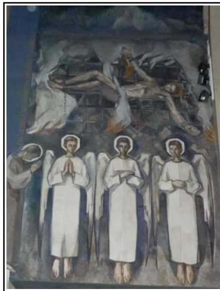
SANT LLORENÇ SAVALL. Murals a l'absis, el la banda esquerra, amb Sant Llorenç a la graella i el de la dreta amb Sant Llorenç sermonejant, al fons d'aquest ...la mola.

Aproximem per aquest edifici una data inicial del segle XI tot i que probablement aprofitava restes anteriors. Entre final segle XI i XII li van afegir les dues capelles semicirculars de llevant com absidioles, amb la qual cosa tindriem un edifici trevolat però, més tard, entre els segles XIV-XV, s'hi afegirien les altres dues. Les capelles rectangulars van ser construïdes entre els segles XVI i XVII, moment que també es van sobrealçar tots els murs, inclosos el de l'absis i possiblement es va doblar interiorment aquest. Entre els segles XII i XIII es va reconstruir part de l'absis central.