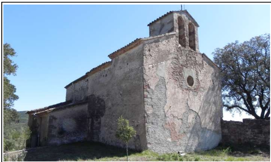
SANT FELIUET DE VALLCÀRQUERA. Vista des de mestral (NO).

En una altra venda de terres que es fa el desembre de l'any 1059, del mateix lloc del Genescar, on el límit de llevant és, a orientis ... in ipsa uia qui uadit ad domum Sancti Felicis de Ualle Charchara... (2) ja concreta totalment l'existència de l'església i un mes després, el gener del 1060, en el testament d'Udalguer llega diners, alous i béns mobles a diverses esglésies entre les quals hi ha Sant Feliu de Vallcàrquera (de Lacera), Et dimitto ecclesie Sancti Felicis de Lacera Cum aureos mancosos ad ipsa opera et ad dedicacionem (3).