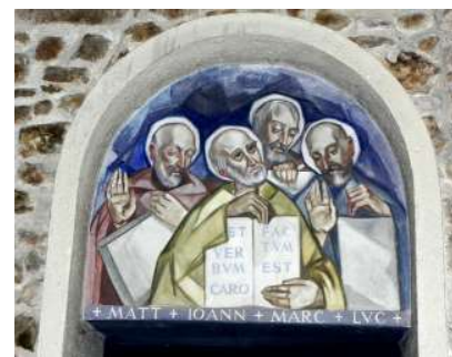
SANT LLORENÇ SAVALL. Escena amb quatre apòstols

És un ampli rectangular, de típicament per tres la central és força que les laterals. La regular sinó que té rament trapezoïrectangle hi ha bàsics, tant a ni a nivell estructural un temple barroc. amb força fidelitat