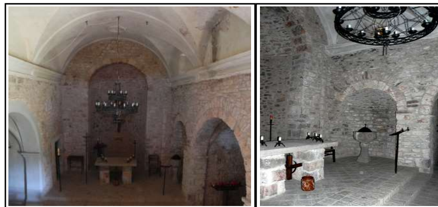
SANT FELIUET DE VALLCÀRQUERA. Interior nau mirant cap a l'absis.

És un edifici d'una sola nau rectangular lleugerament trapezoïdal, capçada per un absis semicircular. La nau té obertes als murs laterals quatre capelles disposades asimètricament. La orientació d'aquest edifici és de ponent a llevant, amb l'obertura de l'absis per aquest costat i un estrenyiment