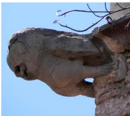
SANT LLORENÇ SAVALL. Gàrgola de la part gòtica del campanar.

El repertori podria ser extret d'un retaule gòtic o barroc, però que aquí s'estén per tots els murs de l'absis, tot se centra a l'entorn de la imatge en volum de Sant Llorenç, flanquejada per les escenes del murs laterals on s'hi representa la vida i martiri del sant, en el de l'esquerra, la predicació i miracles i en el de la dreta, el martiri a la graella, les dues escenes es mostren amb una protecció simbòlica d'un estol d'àngels a la part inferior. A la franja que envolta el Sant, que podria ser l'equivalent a una predella en els retaules, s'hi representen els sants de la devoció local i, a dalt de tot una mà amb una corona de llover. Al mig de la volta sobre un blau potent s'hi representa una creu grega daurada envoltada pels quatre evangelistes en la seva figuració zoomorfa.