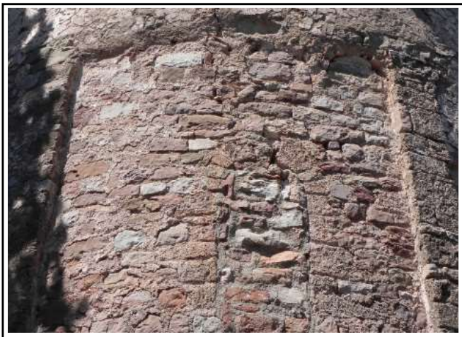
SANT FELIET DE VALLCÀRQUERA. Absis, a dalt hi veiem les empremtes de les arcuacions i al centre una finestra paredada.

La capella semicircular de migjorn té l'arc de l'arcada que forma un doble arc en degradació com una arquivolta. L'arcada interior té les dovelles força ben treballades però les de l'exterior només presenten el treball just perquè puguin acomplir correctament la seva funció,