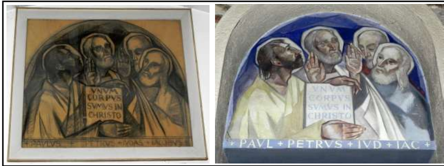
SANT LLORENÇ SAVALL. Cartró preparatori i pintura final d'una segona escena amb apostols

venien determinats per aquest estil. Una distribució de tres naus amb la central encapçalada per un absis rectangular, el qual és flanquejat per dues sagristies, que completen l'amplada del rectangle bàsic.