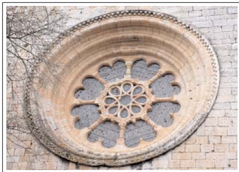
ROSASSA DE LACAPELLA MAJOR DE L'ESGLÉSIA.