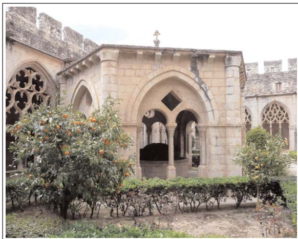
TEMPLLET DEL LAVABO. Al fons la galeria occidental del claustre.

La primera etapa de construcció del monestir, es perllongà durant 100 anys. L'any 1174 es comença l'església abacial i després la sala capitular, el templet, les ales nord i est del primitiu claustre romànic i el dormitori. Després d'un període en què les obres, a causa de la crisi econòmica, van romandre aturades, reberen un nou impuls quan s'aconseguí el patrocini dels reis Pere II el Gran (1276-1285) i Jaume II el Just (1291-1337), s'acabaren el dormitori i el temple abacial, el cenobi es convertí en panteó reial i les habitacions abacials en palau reial. A instàncies de Jaume II, s'enderrocà el claustre romànic per ser substituït pel gòtic actual i es construï el cimbori sobre el creuer de l'església. Pere III el Cerimoniós (1336-1387), fortificà el recinte monacal, però per raó de la seva predilecció pel monestir de Poblet, el de Santes Creus deixà de ser palau i panteó reial i les dependències palatines varen tornar a ser abacials.