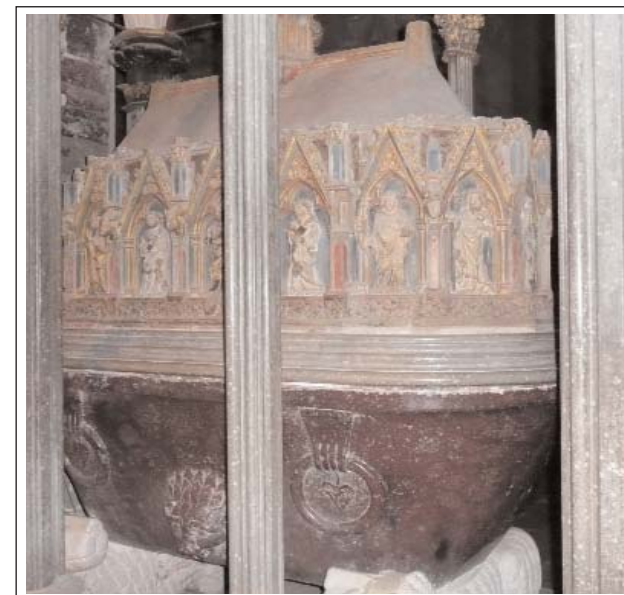
SEPULCRE DEL REI PERE II EL GRAN.

A l'altre costat hi ha el panteó del rei Jaume II el Just –fill de Pere II- i de la seva esposa Blanca d'Anjou, el temple és similar al del seu pare però el sarcòfag és molt diferent, ja que al damunt hi ha les estàtues jacentes de la reial parella.