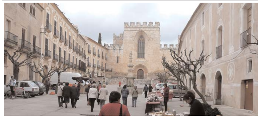
MONESTIR DE SANTES CREUS. Passeig d'entrada al recinte. Al fons l'entrada occidental de l'església.

La primitiva fundació data de l'any 1150, en què els Montcada donaren al cenobi cistercenc de la Gran Selva (Llenguadoc, prop de Tolosa), l'alou de Valldaura (Cerdanyola del Vallès) on es construí un primer petit monestir. Aquest lloc no reunia les condicions idònies - especialment per la manca de recursos hídrics- i la comunitat va sol·licitar al comte Ramon Berenguer IV la concessió d'un lloc a la recent conquerida Catalunya Nova. El comte accedí i els donà l'Espluga