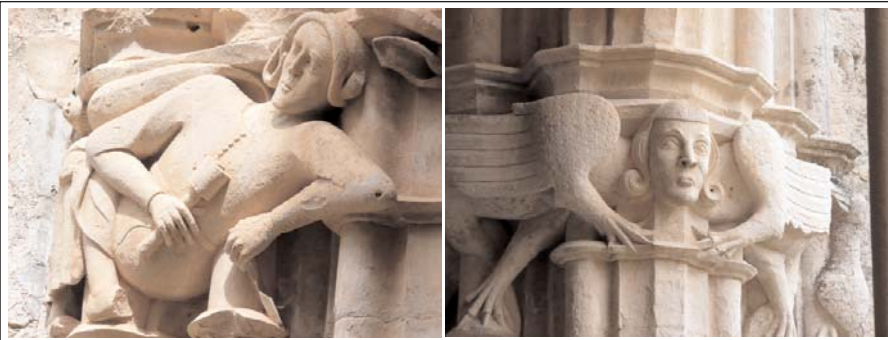
CAPITELLS DEL CLAUSTRE. Details.

Està situat al costat sud de l'església, és d'estil gòtic i va substituir-ne un de romànic. Té quatre galeries cobertes amb volta de creueria i arcades calades sostingudes amb primes columnetes. La decoració dels capitells, obra de l'escultor d'origen anglès Reinard des Fonoll, representa escenes bíbliques, monstres, personatges populars i fantàstics, motius vegetals, etc. A les seves parets hi ha, arrengrerats, sepulcres de la noblesa catalana, els