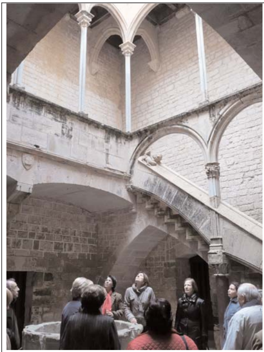
PALAU REIAL o ABACIAL. Segona meitat del segle XIV.

Al seu voltant hi trobem la sala dels Monjos, la presó de monjos i el cos de guàrdia. A la galeria de migdia, hi ha la cuina, el refector del segle XVII i l'antic Palau Reial. A la de llevant, les estances dels monjos jubilats i la capella de la Trinitat i, finalment, a la galeria de ponent, la infermeria.