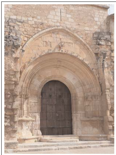
PORTAL D'ACCÉS AL CLAUSTRE.

emmarcada per un arc ogival i la façana està coronada per merlets, afegits al segle XIV. A l'absis central, s'obre una gran rosassa romànica que consisteix en dos cercles concèntrics units per vuit columnetes radials amb capitells amb decoració vegetal i al centre una corona octolobulada envolta un entrellaç de vuit anells –conserva els vitralls originaris-. El creuer del transsepte està coronat per un cimbori gòtic del segle XIV.