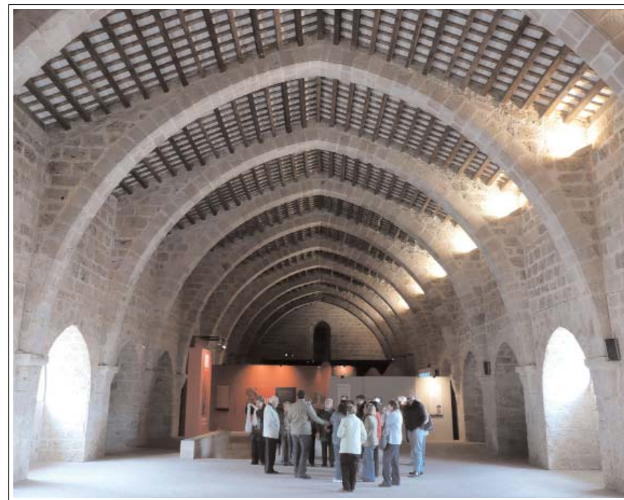
DORMITORI DELS MONJOS.

Sobre la sala capitular hi ha el dormitori, és una gran nau - 46 metres de llargada per 11 d'amplada- il·luminada per finestres d'arc ogival i sostre de dues vessants que descansa sobre onze arcs diafragmàtics.