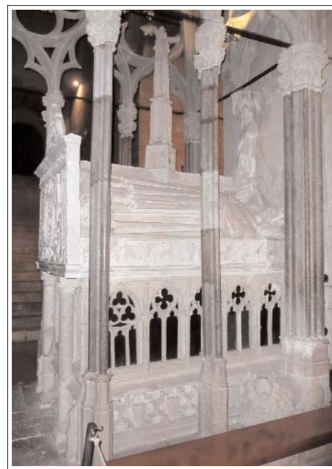
PANTEÓ DE JAUME II DE BLANCA D'ANJOU.

han estat traslladades al Centre de Restauració de la Generalitat de Catalunya, a Sant Cugat, per al seu estudi.