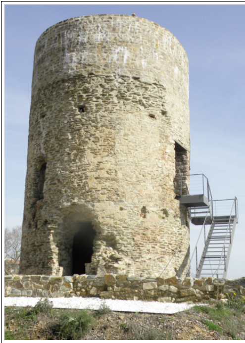
TORRE DE BENVIUERE. Sant Boi de Llobregat.

està documentada, l'existència de la Capella de Sant Miquel al seu costat.