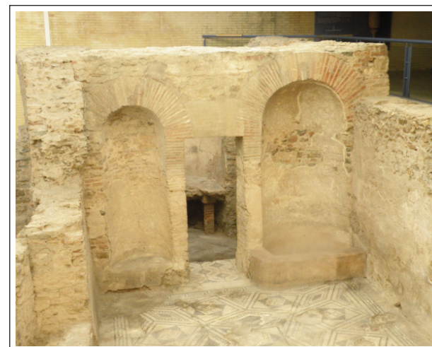
TERMES ROMANES. Sant Boi de Llobregat. Frigidarium o sala d'aigua

Les de Sant Boi de Llobregat foren bastides a finals del segle II dC. Són les més ben conservades de Catalunya. Disposaven de les estances clàssiques: apoditerium (vestidor), frigidarium i piscina (sala d'aigua freda), tepidarium (sala d'aigua tèbia), sudatorium (sala de vapor) i caldarium (sala d'aigua calenta). Les sales calentes tenien murs de 1.20m de gruix i coberta de volta de canó. En canvi, les fredes només eren de 0.60m i la coberta es recolzava damunt d'encavallades de fusta. Tots els murs foren bastits amb argamassa i pedres ( opus caementicium ).