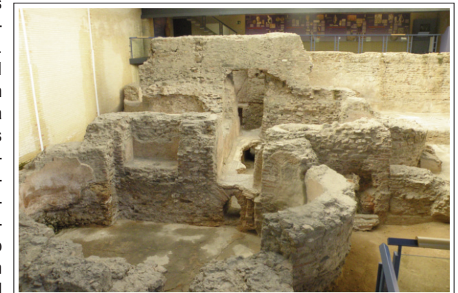
TERMES ROMANES. Sant Boi de Llobregat..

A baix del turó, al lloc on posteriorment hi hagueren les termes, entre l'any 30 i 20 aC, es bastí un forn de terrisseria per a la fabricació d'àmfores i ceràmica. Entre el 14 i el 37 dC, se'n varen construir, en un altre indret proper, dos de nous i, el primitiu fou abandonat. A finals del segle II dC, arribà el màxim esplendor de la vil·la romana i es bastiren les termes. Durant l'època visigòtica continuà la seva utilització. Amb la invasió musulmana foren abandonades. Al cim del turó, es