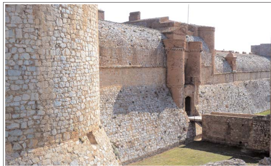
FORTALESA DE SALSSES. Façana sud amb el portal.

La Fortalesa. Hem dit que el castell de Salses i la població foren destruïts pels francesos el 1496. A partir de l'any següent el rei Ferran II de Catalunya i Aragó (el Catòlic d'Espanya) va manar construir una fortalesa a fi d'estar millor preparat de cara a un nou atac francès. L'any 1503, quan encara no s'havia acabat, es va tornar a produir un nou atac dels francesos que es va poder repel·lir. La represa de la construcció es va fer corregint els llocs febles que s'havia observat que tenia la construcció en obres. L'any següent s'acabà l'edifici, regnant ja, Carles V. Durant 150 anys més va resistir atacs i setges, fins que el 1642 va ser definitivament conquerit pels francesos. A partir del Tractat dels Pirineus, el 1659, en desplaçar-se la frontera la fortalesa va perdre la funció estratègica que tenia. El 1682 la transformaren en presó d'estat. Durant el segle XIX va ser utilitzada com a polvorí. A principis del segle XX esdevingué propietat de Belles Arts, sota la tutela de la qual s'organitzen les visites comentades. És, sense cap mena de dubte, un exemple excepcional de l'arquitectura militar de l'època, que segons es diu, s'ha conservat gràcies al cost desmesurat que hauria significat la seva destrucció.