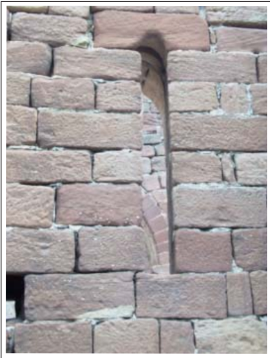
SANT GENÍS DE ROCAFORT. Finestra d'una sola esqueixada del mur de mijorn.

capçada pel costat de llevant per un absis rectangular que és, físicament, la continuació de la nau, amb l'única separació d'un arc toral de perfil apuntat amb les corresponents pilastres i un esglaonat que ens eleva el paviment de l'absis. Tanmateix però, amb les dues fornícules, ve a donar-nos un espai força més ample que el de la nau, tot i que pel costat de fora no es diferencia gens.