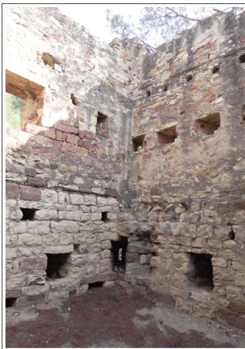
TORRE DEL CLOS. Interior de la torre on podem observar les característiques estructures dels murs, diferents a cada planta.

SOCORREGUT DOMÉNECH, Josep, 2014: "Conjunt de Sant Genís de Rocafort. Memòria de la intervenció arqueològica preventiva realitzada al castell-priorat. Campaña 2014". Ajuntament de Martorell, Diputació de Barcelona.