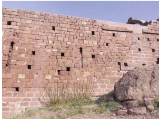
SANT GENÍS DE ROCAFORT. 1) Interior de la nau amb l'arcada que la separa de l'absis. 2) Interior de la nau. Mur de tramuntana reforçat amb els arcs formers. 3) Façana de migjorn. S'hi pot veure els senyals de la reconstrucció en l'aparell.

tat de la serra d'Ataix, amb la intenció de convertir-lo en panteó familiar. El seu fill Guillem Ramon I hi féu un important llegat en el testament de l'any 1110, per anar de pelegrinatge al Sant Sepulcre, encara que en tornà sa i estalvi i hi visqué fins el 1126. Des del 1282 figura depenent de Sant Miquel de Cruïlles.