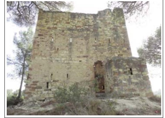
1) CASTELL DE ROSANES. Quadrícula excavada, sembla que metòdicament, on han sortit diverses estructures de murs del castell. 2) CASTELL DE ROSANES. Clots situats al perímetre, fora muralla, a la zona de llevant. 3) TORRE DEL CLOS. Façana de la torre amb el cos de la garita al costat de la porta d'entrada.