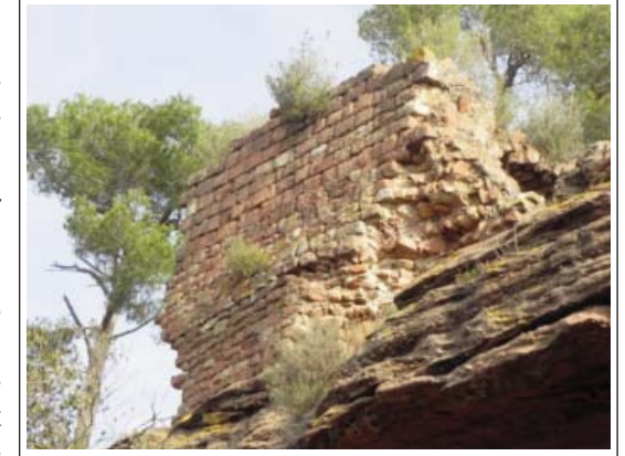
CASTELL DE ROSANES. 1) Sala o cisterna que encara conserva la coberta de volta. 2) Aparell del mur de la sala o cisterna on encara es pot apreciar la destresa en l'execució.