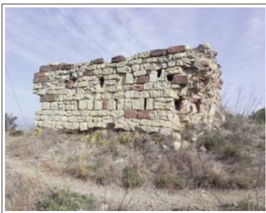
TORRE GRIMINELLA. Mur del què resta d'aquesta torre. S'hi veu una filada de sageteres que també es troben en els altres tres murs.