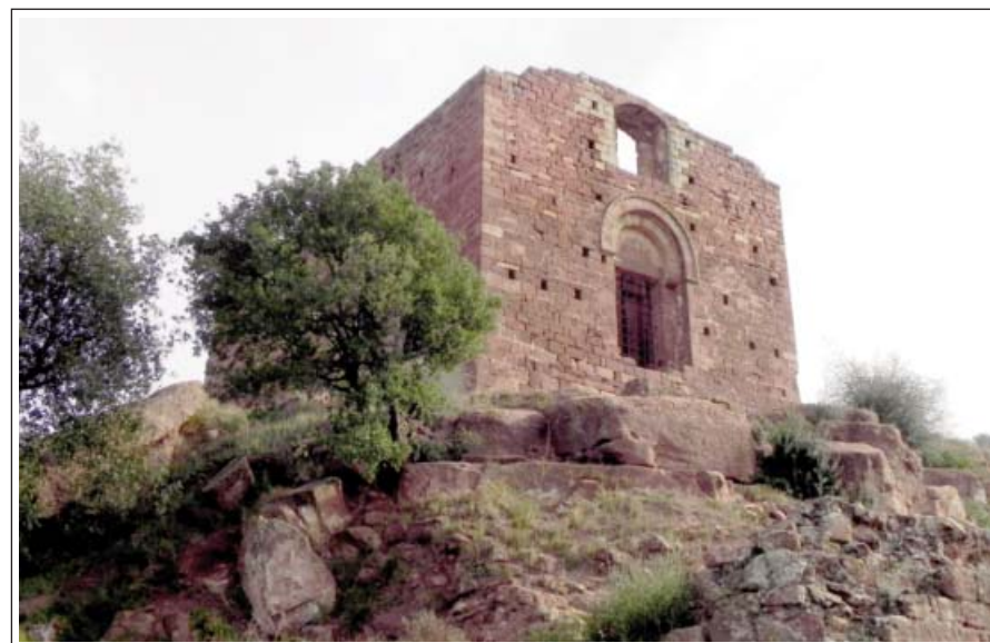
SANT GENÍS DE ROCAFORT. Façana de ponent.

Bonfill, senyor del castell Castellvell de Rosanes, i la seva esposa Sicarda van fundar l'any 1042 un monestir al cim d'una roca aïllada, al cos-