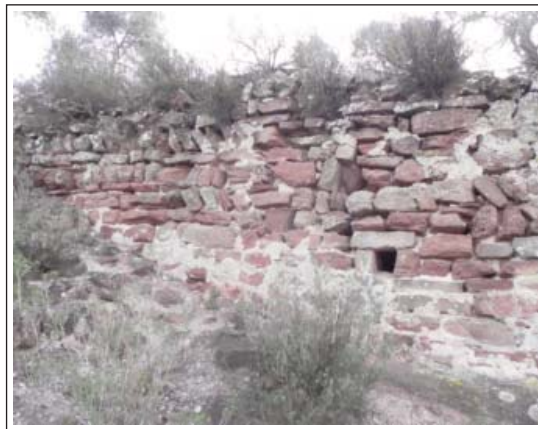
CASTELL DE ROSANES. Muralla de tramuntana on podem observar filades amb pedres inclinades.

Fora muralles, mig espadat, amb accés des de dalt