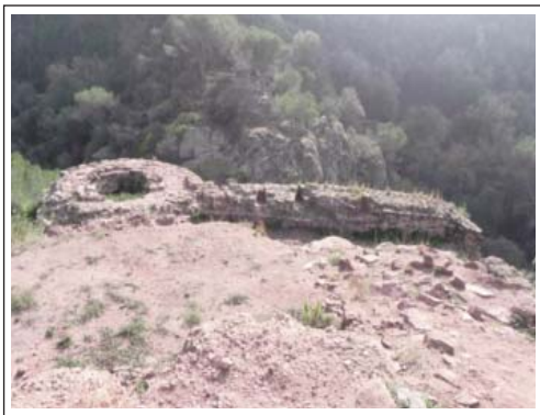
SANT GENÍS DE ROCAFORT. Base de la muralla i d'una torre del sistema defensiu que encerclava l'església i les edificacions del priorat.

De tota manera, queda la incògnita de com era la de l'àmbit del cor, tot i que Alfred Mauri comenta (vegeu bibliografia) que hi havia dos arcs formers de la mateixa alçada que els torals i que entre els quatre sostenien un cimbori. També és possible que el que hi hagués fos un transepte elevat que no sobresortís de l'amplada de l'edifici però que, interiorment, fos suficient per donar la imatge de nau transversal. Amb tot però, no hi ha prou dades que permetin