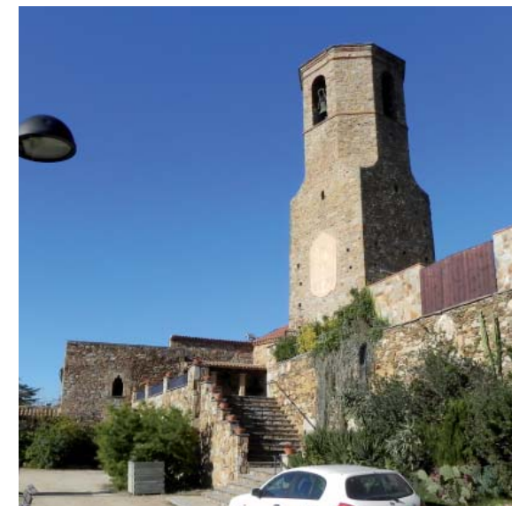
SANT PERE DE REIXAC. Vista general.