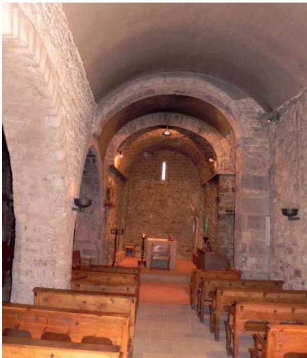
SANT PERE DE REIXAC. Interior nau de migjorn amb l'absis preromànic al fons.

són determinades per la mateixa estructura. La part més antiga és localitzada en la capçalera i la nau de migdia, que per les característiques de l'aparell i també per la tipologia de la planta podria ser datat com una construcció de final del segle X. La nau de tramuntana devia correspondre a una ampliació del segle XI o potser de principi del segle XII. L'absis d'aquesta nau és una construcció de mitjà segle XI d'estil llombard. Amb tot, aquest absis va ser modificat quan va ser sobrealt, moment en què segurament es va eliminar el possible fris d'arcuacions que devia coronar-lo i hi van deixar una senzilla cornisa que fa un biaix invertit.