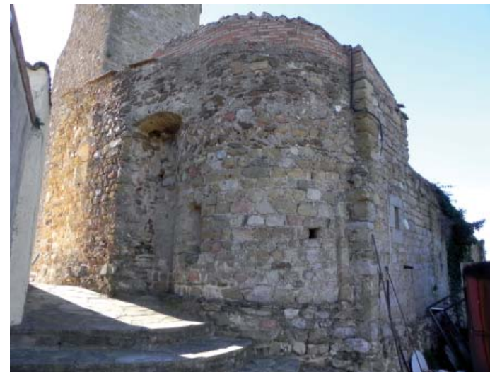
SANT PERE DE REIXAC. Absis romànic.

La nau de migjorn és il·luminada per dues finestres de doble biaix i arc de mig punt situades en el mur de migjorn de les quals una és tapada per la construcció del campanar. Els absis tenen també dues finestres cada un; el de mig-