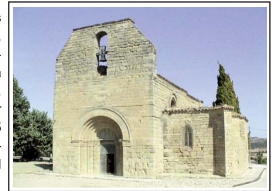
SANTA MARIA DE BELL-LLOC. Església i detall del portal.

En origen l'església de Santa Maria de Bell.lloc era una construcció d'una sola nau, amb un absis semicircular. Durant el segle XIV l'absis fou substituït per l'actual capella gòtica i en reformes posteriors s'obriren dues