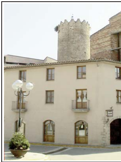
TORRE MESTRA DEL CASTELL, envoltada d'edificacions.

Places porxadades. De la vila medieval destaquen dues places porxadades, la de l'església, i la plaça Major, documentada el 1348 com a plaça de les Eres.