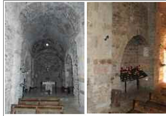
SANTA EULÀLIA DE MADRONA o LA SALUT DEL PAPIOL. A l'esquerra, l'interior. A la dreta detall de l'arc former on podem veure el doblatge del mur.

torres als dos extrems de l'edificació, una a l'extrem del turó, sobre el riu, per controlar les comunicacions i l'altra a l'altre extrem, més accessible, per defensar l'accés. Els murs que van d'una torre a l'altra tenen defensa fàcil ja que són situats sobre parets rocoses inexpugnables.