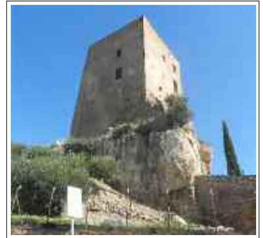
CASTELL DEL PAPIOL. Espectacular vista des de migjorn.

Dels murs que es poden atribuir a l'obra d'abans del terratrèmol, en queden diversos exemples a la planta baixa, dels quals podem destacar els que delimiten una sala, de planta irregular, un corredor i una petita cambra que sembla que va ser utilitzada com a dipòsit de cereals, (l'accés actual és obra d'una restauració recent). A la sala hi ha mostres d' opus spicatum , que ens la podria fer datar, amb reserves, al segle X. De tota manera les voltes, escarseres i irregulars que cobreixen aquests àmbits són de construcció molt posterior, només la de mig punt que cobreix el dipòsit de cereal es podria considerar d'aquell moment. Aquestes estructures són de característiques molt semblants a les de la torre rodona de la banda nord i aquesta és anterior a l'any 1115. La torre de migdia va ser substituïda per la torre quadrada actual que hom la data del segle XIII, i la del nord va ser recoberta exteriorment per una potent i massissa torre rectangular, per reforçar la defensa de l'accés, però, en va deixar la part que encara es mantenia dreta incrustada a la nova. L'aparell d'aquella torre rodona és de pedres sense tallar, només desbastades amb l'escoda o maceta per donar-les-hi una forma