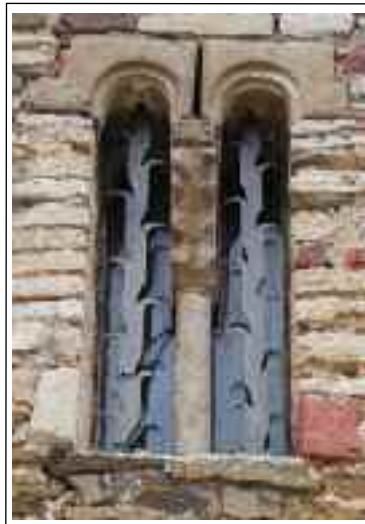
SANTA EULÀLIA DE MADRONA o LA SALUT DEL PAPIOL. Finestra de la façana de ponent.

La finestra geminada se situa al mur de ponent; és constituïda per dos arquets tallats, cada un en un bloc independent. Els arquets són ornats amb un reclau que forma una prima arquivolta. Els blocs tenen, a la part baixa dels laterals oposats, uns encaixos que semblen indicar una reutilització de les peces. Aquests blocs són aguantats en el centre per un capitell trapezoïdal mensuliforme amb les cares frontals i posterior treballades amb un cursos temes vegetals.