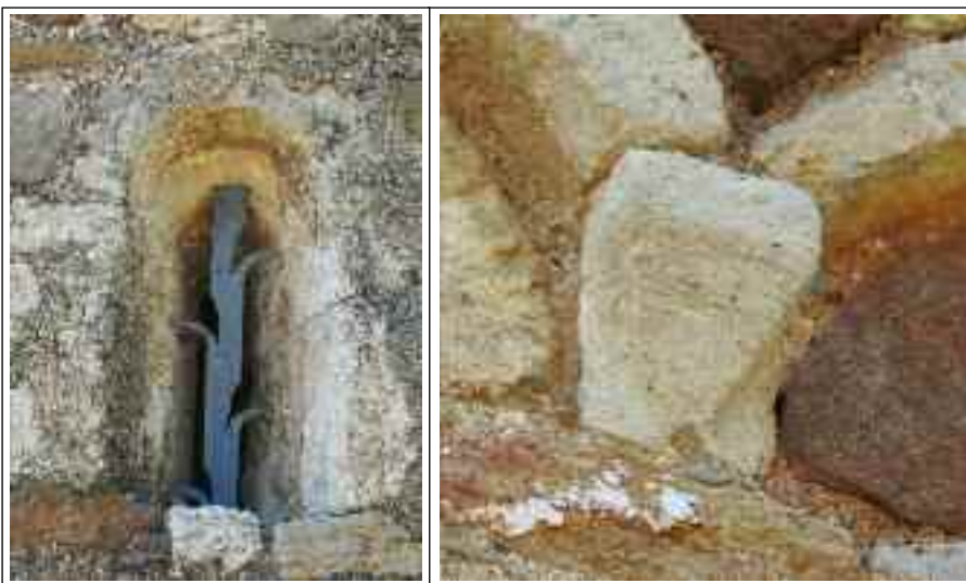
SANTA EULÀLIA DE MADRONA o LA SALUT DEL PAPIOL. A l'esquerra detall de la finestra de l'absis central. A la dreta, detall de la mènsula triangular de les arcuacions.

per una volta de pedra i calç. Aquesta obra obligà a doblar els murs existents perquè poguessin aguantar les noves càrregues. Aquest doblat es va fer pel costat de dins. Probablement mentre feien aquests treballs, hi va haver el canvi d'estil que va fer que es construís l'absis central en estil llombard. També es pot pensar en una aturada de les obres abans de construir l'absis o una ensulsiada d'aquest element. Hom data la nau preromànica en els segles IX-X. L'ampliació s'hauria de situar en dos moments del segle XI, probablement el doblat i el tram de nau nova s'hauria fet a principis d'aquest segle i l'absis a la meitat, ja dins el moviment llombard. Els arcs torals s'hi afegiren durant el segle XII. Durant l'any 1972 s'enderrocà el mas que hi era adossat i es reconstruí l'absis de migdia