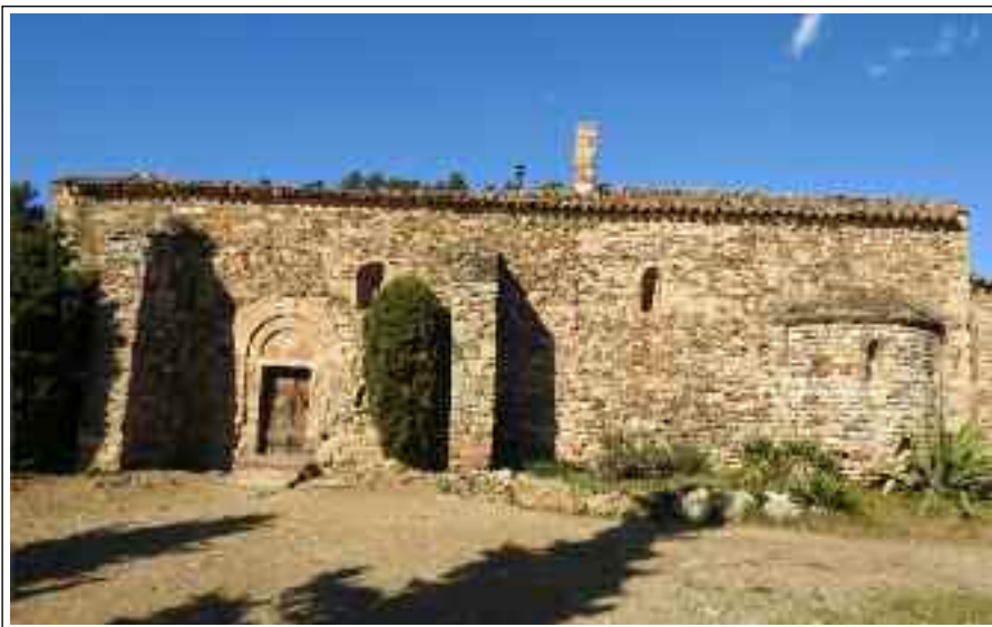
SANTA EULÀLIA DE MADRONA o LA SALUT DEL PAPIOL. Façana de migjorn.