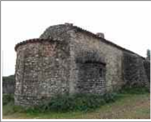
SANTA EULÀLIA DE MADRONA o LA SALUT DEL PAPIOL. Façana de tramuntana.

arcs torals i les corresponents pilastres. L'absis i les absidioles es cobreixen amb voltes de quart d'esfera.