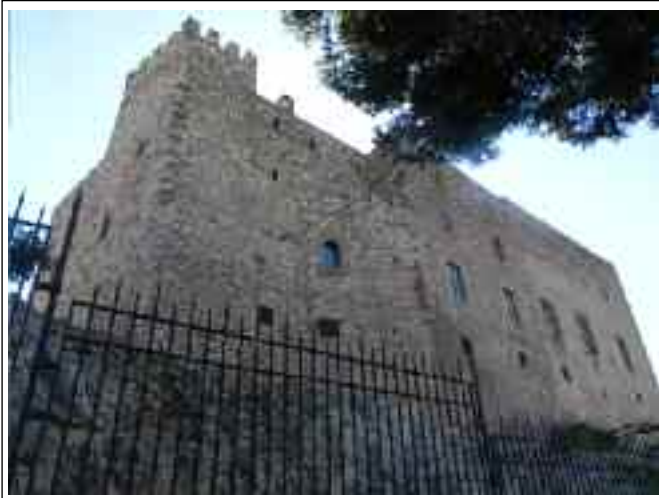
CASTELL DEL PAPIOL. Façana de ponent

A grans trets, la planta baixa actual ens dona una idea força aproximada de l'estructura d'aquell edifici, si més no, un esquema general. Tenim dues