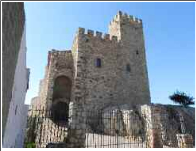
CASTELL DEL PAPIOL. Façana de tramuntana, on hi ha l'accés.

El 1206 el rei Pere del Catòlic donà en feu el castell a Ramon de Papiol. El 1448 el famós terratrèmol que assolà Catalunya va enderrocar les parts altes del castell. Sembla que només es mantingueren dempeus les parts baixes de les dues torres, i di-