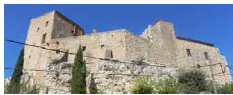
CASTELL DEL PAPIOL vist des de llevant.