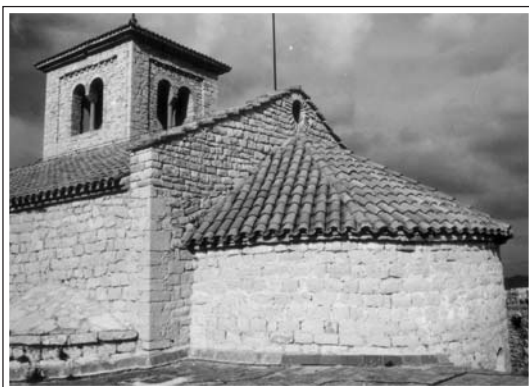
SANTA MARIA DEL PUIG DE LA CREU. Capella, absis central i el de migjorn.