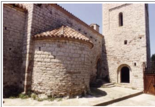
SANTA MARIA DEL PUIG DE LA CREU. Façana de tramuntana de la capella.

L'església del Puig de la Creu és un auster edifici d'una sola nau i tres absis. La nau, de planta rectangular, és capçada pel costat de llevant, per un absis de planta semicircular. A cada costat hi ha dues absidioles, també de planta semicircular. Tot plegat ens determina una planta de tipologia trilobada. Els tres absis sobrepassen en fondària la meitat de l'obertura. La unió de la nau amb l'absis del mig, que tenen diferent amplada, és fa mitjançant un doble reclau en degradació, que forma una arcada intermèdia entre l'amplada de la