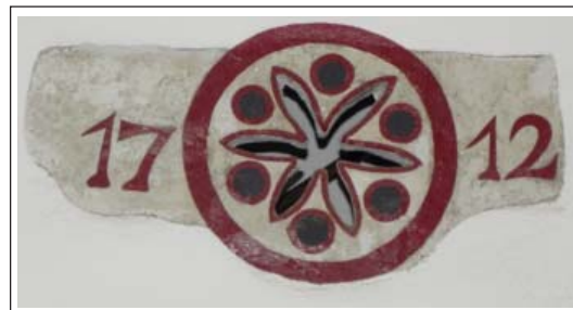
MAS CADA FALC. Detall de l'espiell de l'escala

Diversos elements singulars ens permeten conèixer diferents reformes que havien d'adaptar la