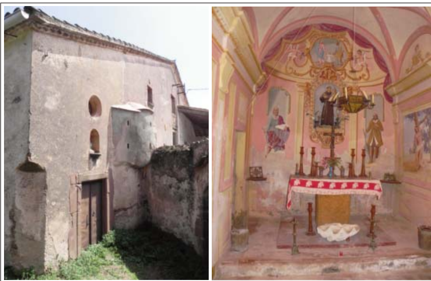
MAS CADA FALC. Capella de Sant Antoni, adossada al costat de tramuntana del mas.