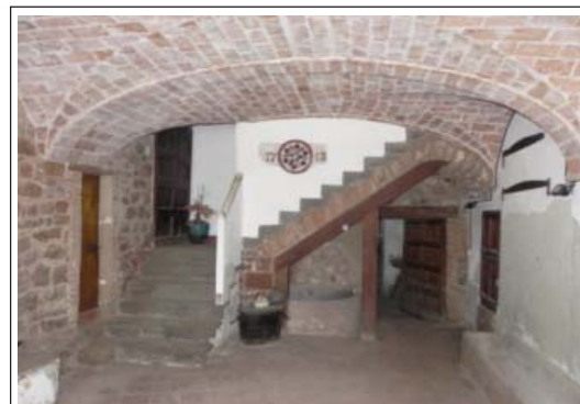
MAS CADA FALC. Sala de l'entrada de la planta baixa.

En el cos de l'esquerre hi havia els estables i en el cos transversal del darrere, el celler. Al fons de la sala hi ha l'escala que ens porta a la planta pis. La sala d'aquesta primer pis va ser independitzada de l'escala per separar les zones d'ús dels propietaris i les dels masovers, els quals ocupen la primera planta del cos del darrere. Els cossos laterals són ocupats pels dormitoris. La casa té dos portals adovellats un, com és normal, al cos central i l'altre al cos de l'esquerre. Aquest segon donava accés directe pel bestiar, sense haver de passar per la casa.