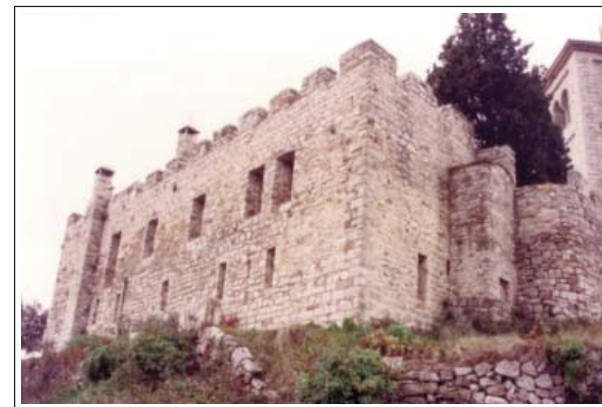
SANTA MARIA DEL PUIG DE LA CREU. Edificacions que tanquen l'eixida pel costat de tramuntana.

Hi ha molt poca documentació d'aquest edifici. La següent notícia és de l'any 1337 per la qual sabem que l'església era servida per un beneficiat que era nomenat per l'abat de Sant Cugat del Vallès.