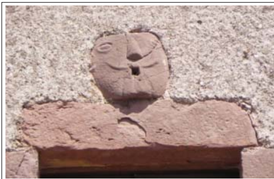
MAS CADAFALEC. Detall de la carassa que es troba posada sobre la llinda de la finestra de la segona planta del cos de tramuntana.

casa als gustos de cada moment. Bàsicament són elements arquitectònics, emmarcaments d'obertures i algun altre element ornamental. A la façana, hi tenim diverses obertures amb les llindes datades. El balcó de la sala de la planta primera té la llinda amb una inscripció indesxifrable, sense simetria ni composició, encara que sembla que es pot llegir la data 1622. Al