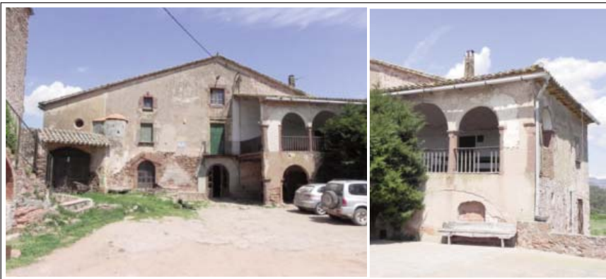
MAS CADA FALC. Façana de migjorn i galeria afegida

l'any 1308 i s'ha mantingut fins els nostres dies. Fins el segle XVIII no va passar a dependre de la parròquia de Castellar. Podem considerar que una bona part de la pujança de la casa es pot atribuir que tenia capacitat per hostatjar i alimentar els ramats que baixaven dels Pirineus per a hivernar a la plana.