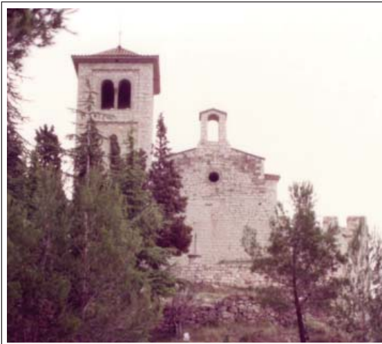
SANTA MARIA DEL PUIG DE LA CREU, des de ponent.