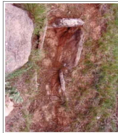
TOMBA DE CADAFALEC. Vestigis.

Tomba de caixa de lloses, d'inhumació individual, excavada en el terreny natural. Està disposada en l'orientació llevant-ponent. El que en queda consisteix en tres de les lloses que delimitaven l'extrem de ponent. Al costat mateix hi ha una llosa que podria ser part de la coberta de la caixa.