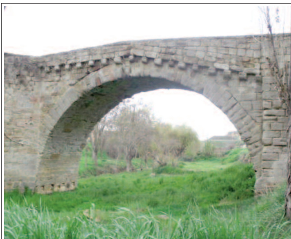
SANAÜJA. Pont medieval.

El municipi de Sanaüja està situat al nord de la Segarra, molt a tocar de les comarques de la Noguera i del Solsonès. La vila està presidida per un turó, on hi ha les ruïnes del castell. Sanaüja fou conquerida l'any 951 i, molt aviat, cap a l'any 1000, s'inicià la construcció del castell. Després es va anar completant durant els segles XI i XII. També rebé ampliacions i reformes durant els segles XV, XVI i XVII.