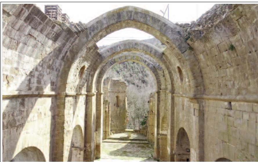
SANTA MARIA DE GUALTER. Nau central.

A l'interior de la nau, es conserva un sarcòfag del segle XII, amb decoració incisa a la cara visible. A l'exterior del temple, davant de la façana nord, es conserva part de la necròpoli, amb un sarcòfag molt desgastat del segle XIII, esteles funeràries discoïdals, làpides i altres sepultures excavades a la roca.