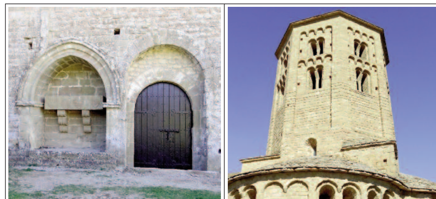
SANT PERE DE PONTS. Arcosoli amb sepulcre i portal. SANT PERE DE PONTS. Cimbori reconstruït.

El conjunt canonical de Sant Pere era format per l'església, actualment reconstruïda i restaurada, i per les dependències, que continuen enrunades. L'església és un edifici, de finals del segle XI i inicis del XII,