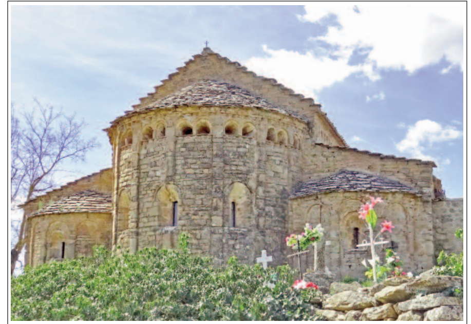
SANTA MARIA DE PALAU DE RIALB.