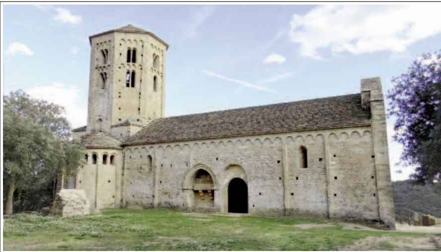
SANT PERE DE PONTS. Façana nord.