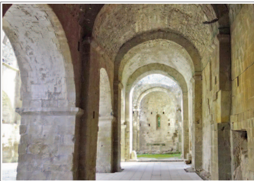
SANTA MARIA DE GUALTER. Nau sud.

transsepte, pràcticament de la mateixa amplada que les naus, un absis i dues absidioles tots semicirculars. El creuer havia tingut un cimbori. El temple disposava de tres portes: la principal a la façana de ponent, la del sud era la que comunicava amb el claustre i a la del nord era la que s'accedia al cementiri i que posteriorment va ser paredada.