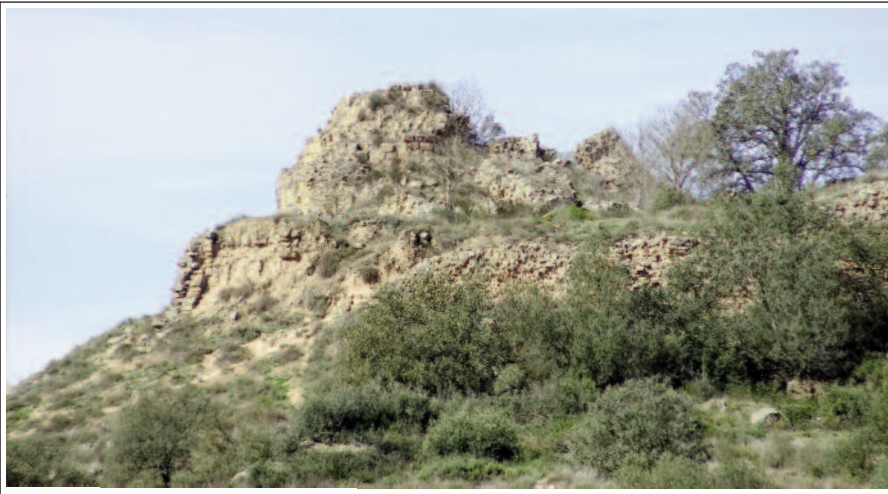
CASTELL DE PONTS. Ruïnes.