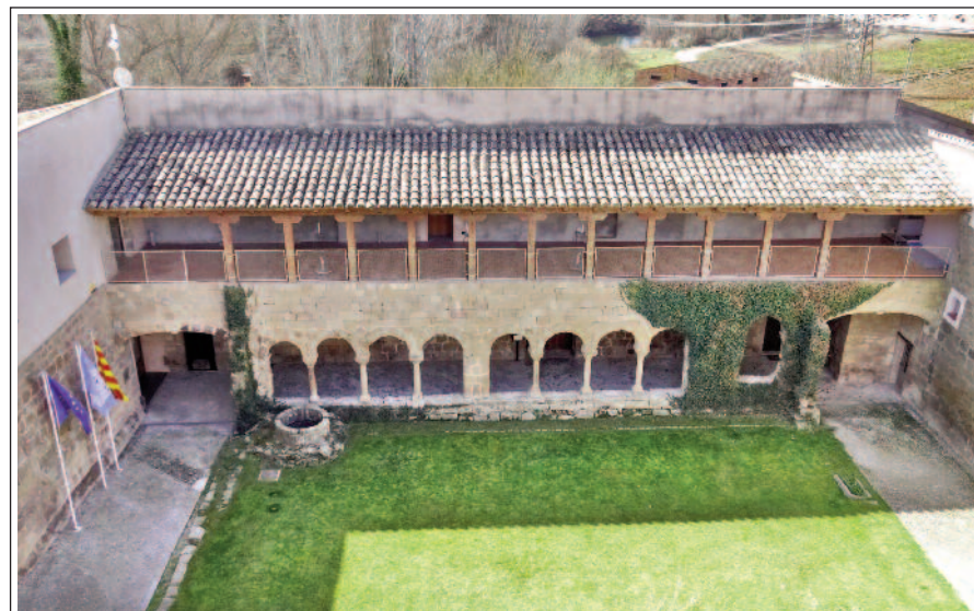
SANTA MARIA DE GUALTER. Claustre. actualment seu de l'Ajuntament de la Baronia de Rialb.

Tenim, doncs, el monestir en estat ruïnós, i a partir de l'any 1979, a poc a poc, s'hi van anar fent obres de consolidació i restauració, que encara duren. L'església és de planta basilical, de grans dimensions. És del segle XI i XII, però s'allunya del model llombard. Consta de tres naus cobertes amb voltes de canó, reforçades per quatre arcs torals i separades per arcs formers que es recolzen en pilastres cruciformes. Està capçada per un