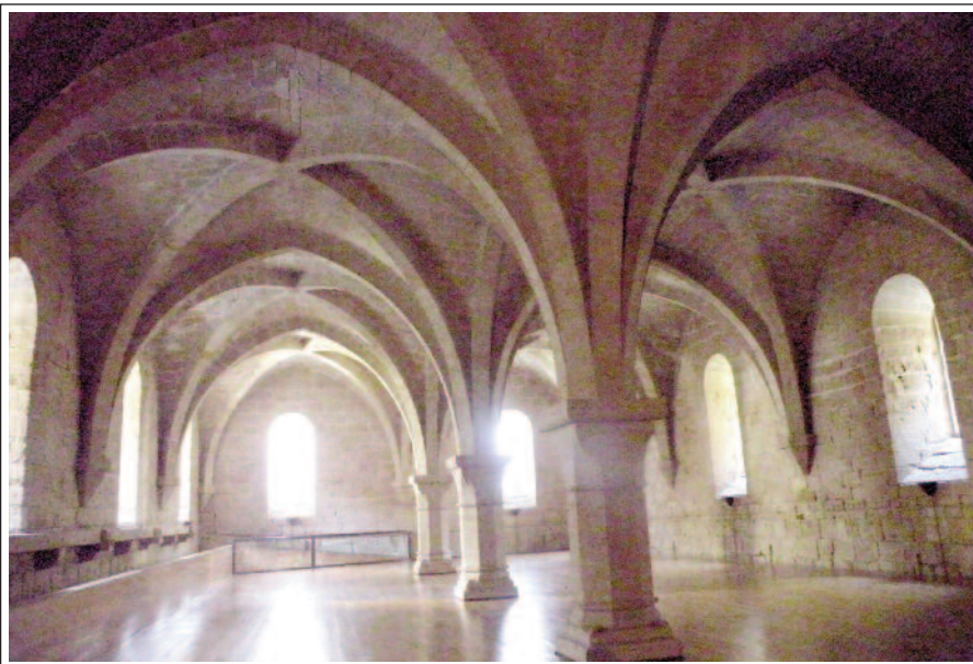
SANTA MARIA DE POBLET. Sala Capitular.

gran de Catalunya. Bastants segles més tard va patir diverses vicissituds: primer, en la Guerra del Francès que fou saquejat pels francesos. A continuació, durant el Trienni Liberal (1820-1823), fou saquejat i molt danyat pels anticlericals. A la primera guerra carlina (1834), continuaren les destrosses. Finalment, en la desamortització del 1835, hi va haver exclaustració, venda de les seves propietats, abandonament i saqueig. L'any 1921 el conjunt monàstic fou declarat Monument Nacional, i el 1930 es constituí un patronat