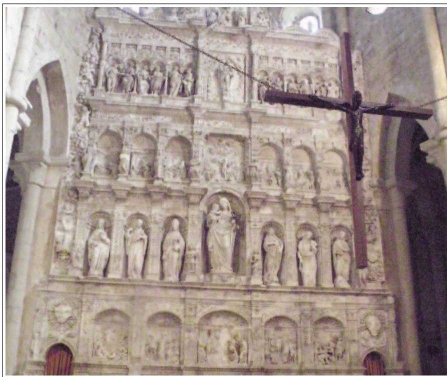
SANTA MARIA DE POBLET. Retaule gòtic de l'altar major.

El monestir fou un important nucli de poder temporal i la seva màxima esplendor s'assolí al segle XIV, moment en què era el segon senyoriu més