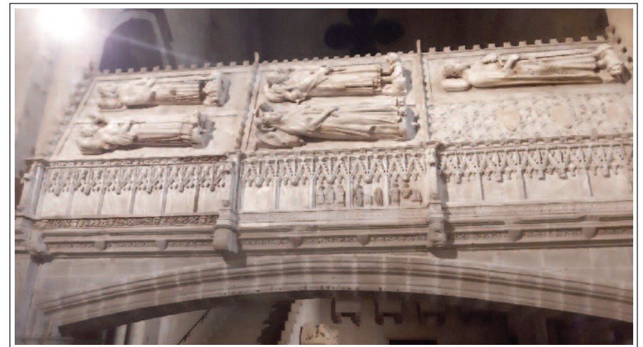
SANTA MARIA DE POBLET. Panteó Reial, cara nord.