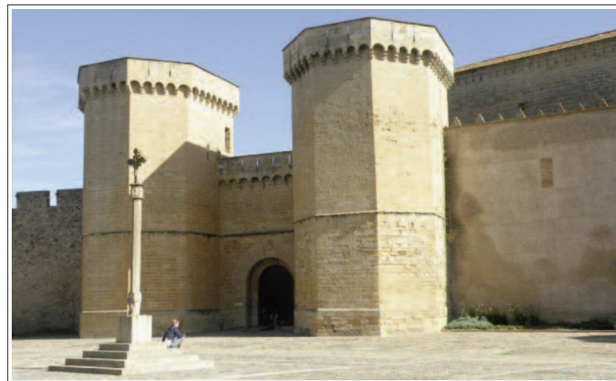
SANTA MARIA DE POBLET. Porta reial.

El monestir de Poblet és al peu de les muntanyes de Prades. Va ser fundat pel comte Ramon Berenguer IV l'any 1150, el qual va donar les terres a l'abadia cistercenca de Fontfreda (Llenguadoc) perquè hi construïssin un monestir cistercenc. El 1153 varen venir dotze monjos de Fontfreda, per