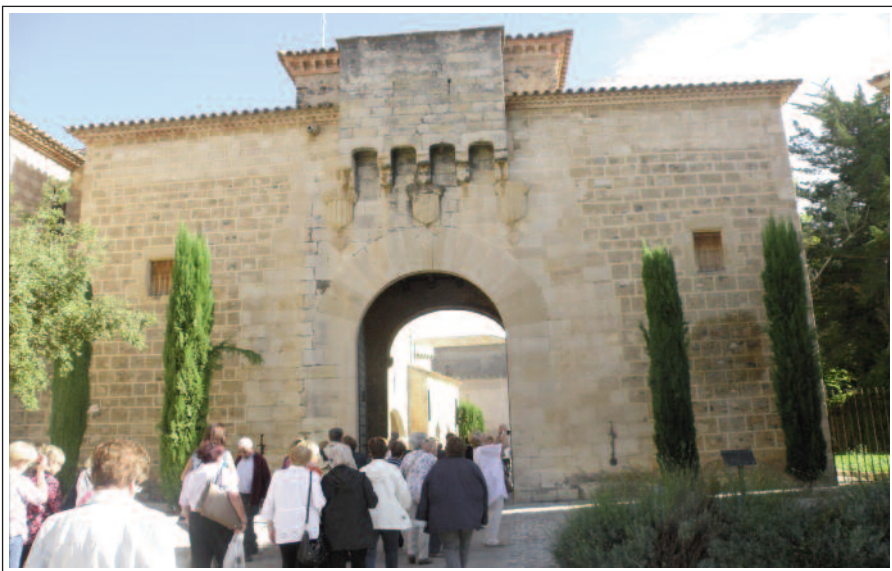
SANTA MARIA DE POBLET. Porta Daurada.

L'església. És de planta basilical de tres naus, separades per arcs formers apuntats sostinguts per pilars cruciformes. La nau central està coberta amb volta de canó apuntada, reforçada amb arcs torals i les laterals són amb volta de creueria. Estan capçades per un transsepte, amb una absidio-la a cada costat i un absis central envoltat per una girola, coberta amb vol-