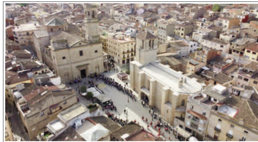
IL'ESPLUGA DE FRANCOLÍ. A l'esquerra, amb el campanar més alt hi ha l'església nova. A la dreta nau de l'església vella.

Existeix una carta de població de l'any 1079, en què els comtes Ramon Berenguer II i Berenguer Ramon II fan donació, en franc alou a Ponç Hug de Cervera, d'un terreny erm anomenat Espluga de Franculi , perquè el defensi i el colonitzi. També consta l'autorització per construir-hi una fortalesa, que es comença ràpidament a bastir al Capuig i la de fer un mercat. A la mort de Ponç Hug, vers el 1130, el succeïren els seus dos fills, Ponç i