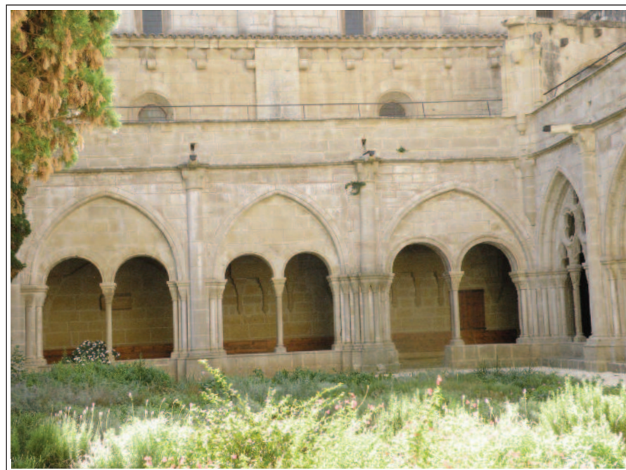
SANTA MARIA DE POBLET. Interior del claustre

tes de creueria on s'obren cinc absidioles radials semicirculars. A l'altar major es troba un gran retaule d'alabastre, el primer d'estil renaixentista de Catalunya que va ser fet per Damià Forment els anys 1527-1529. Està dedicat a Santa Maria i conté escenes de la seva vida i de la passió de Crist. A més, s'hi representen sants i santes i l'apostolat, tot plegat coronat per un calvari. Patí molts danys durant les vicissituds ja descrites. Va ser restaurat entre els anys 1948 i 1953. Als peus de les naus es troba la portalada romànica d'accés que té un timpà policromat amb el crismó i al centre, l'Agnus Dei. Està precedida per una galilea que conté la capella del Sant Sepulcre, del segle XVI, i alguns enterraments.