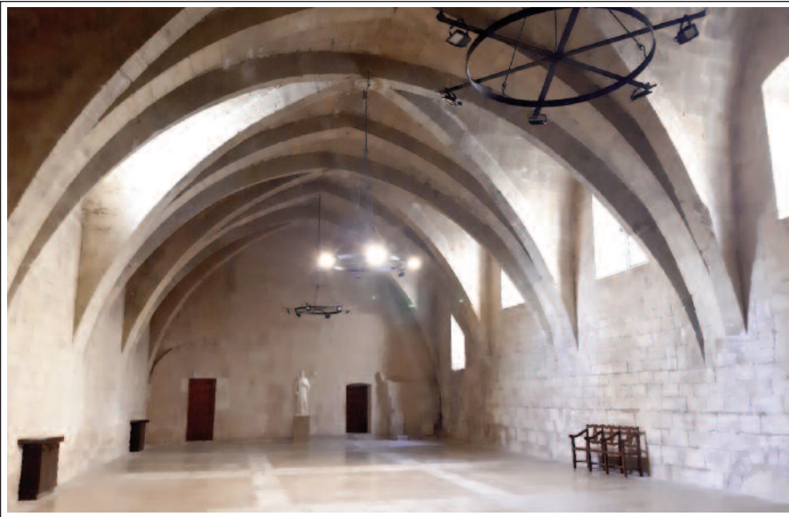
SANTA MARIA DE POBLET. Antiga sala dels cups.