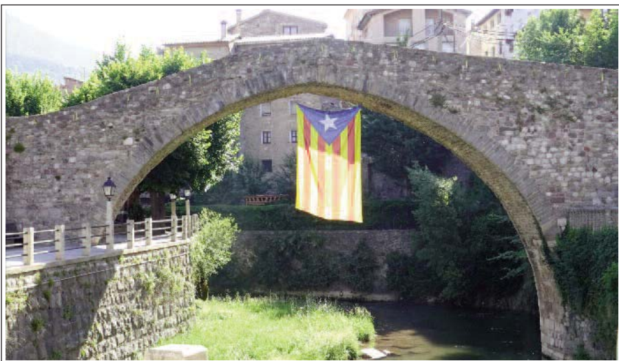
PONT VELL. La Pobla de Lillet.