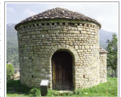
SANT MIQUEL DE LILLET. Al fons, a l'esquerra, Santa Maria

És una de les esglésies rodones més petites de Catalunya i l'única del Berguedà. Té 6,5 m de diàmetre exterior i 4,7 d'interior. Al sector de llevant té adossat un absis semicircular. Actualment és coberta per una cúpula semiesfèrica i el portal és senzill amb un arc de mig punt adovellat. A sobre té una creu en relleu. L'altra decoració que presenta és una mena de fris construït amb pedres que s'alternen amb espais buits. Curiosament no disposa de cap finestra.