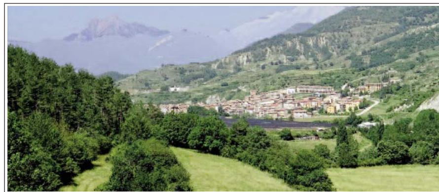
LA POBLA DE LILLET DES DE SANTA MARIA DE LILLET. Al fons el Pedraforca.

El conjunt monumental de Santa Maria de Lillet és a uns dos quilòmetres de la Pobla de Lillet. El formen l'església i, al sud, les ruïnes del monestir, consolidades i visitables. Gairebé adossada hi ha, actualment, una casa de pagès. Les primeres notícies que tenim de l'església són de l'any 833. A finals del segle XI es va fundar una canònica agustiniana de la qual tenim notícies des del 1086 i sabem que es va mantenir fins l'any 1592, data en què va ser secularitzada. L'església va continuar en ús fins a principis del segle XX. El conjunt va ser restaurat, en part, l'any 1995.