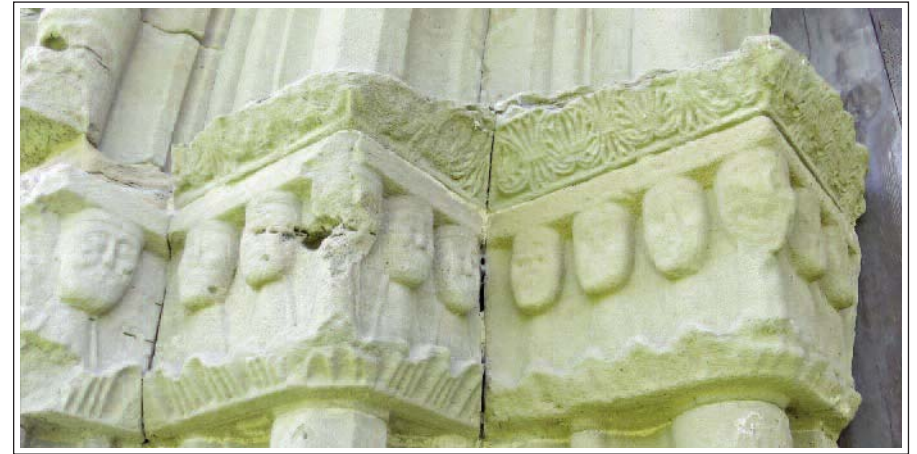
SANTA MARIA DE LILLET. Capitells del portal gòtic, amb 12 personatges esculpits.

que podrien representar els dotze apòstols o els 24 ancians. El portal actual continua essent el primitiu, modificat en època barroca. I és que de l'època gòtica ençà, l'església tingué tres canvis importants més, que hi deixaren l'empremta clàssica i la barroca.