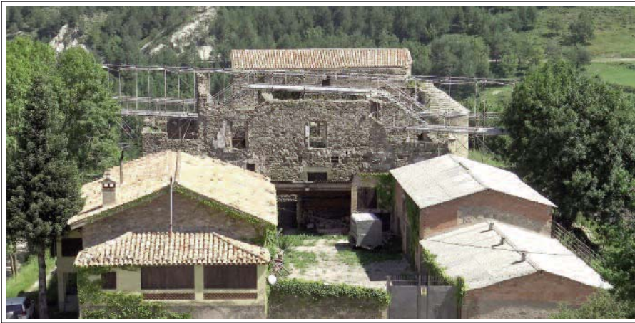
SANTA MARIA DE LILLET. En primer terme una casa de pagès. La teulada del fons correspon a l'església

On avui hi ha l'església de Santa Maria n'hi havia hagut una altra, construïda durant el segle IX, de la qual es conserven les restes d'una absidio-la. Durant els segles XI-XII va ser substituïda per una de romànica, amb planta de creu llatina, creuer i cimbori que varen caure amb els terratrèmols de 1428. Dels tres absis se'n conserven dos. El petit claustre de planta quadrada té dos pisos. El superior és molt malmès i no té terra ni teulada. Els arcs no tenen capitells. El portal, al mur oest, va ser substituït per un de gòtic al final de l'ample transsepte nord. Els capitells, esculpits en pedra sorrenca són molt esmolats pel pas dels anys i mostren un conjunt de 12 personatges per banda de la porta. Se'n desconeix la simbologia, però es diu