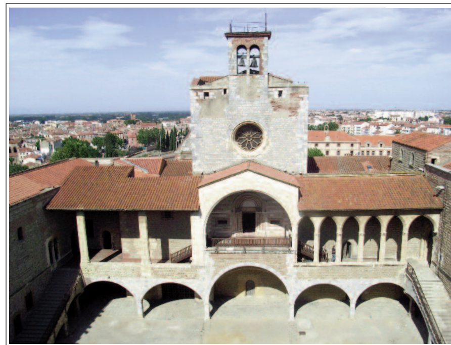
PERPINYÀ. PALAU DELS REIS DE MALLORCA.

El Castellet té planta baixa, tres pisos i terrat, comunicats per una escala de cargol. A la planta baixa hi ha la recepció, l'antiga sala de tortures i una vitrina en homenatge al bisbe Carsalade, aquell que deixà escrit: "La terra i la raça estan inseparablement unides l'una a l'altra: una influeix l'altra i de llur unió en neix la llengua, després d'una gestació de vegades secular. Provar de destruir qualsevol dels termes d'aquesta trinitat: la terra, la raça,