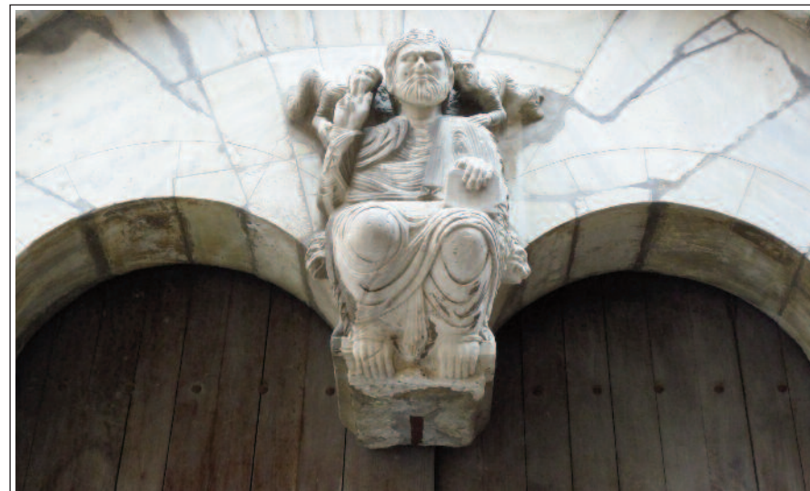
PERPINYÀ. SANT JOAN EL VELL. Portal.

La catedral de Perpinyà és l'església de Sant Joan Baptista. Es va començar a construir l'any 1324, amb un projecte que preveia que fos de tres naus però l'any 1433 es varià el projecte i es construí, finalment, amb una única nau, molt ampla. És d'estil gòtic. S'hi pot admirar una pica baptismal preromànica feta amb marbre de Carrara; la façana de l'orgue, gòtica, amb dues portes pintades al 1504; l'altar major amb un interessant retaule renaixentista; els retaules gòtics de Sant Pere i de Nostra Senyora de la Magrana; el retaule barroc de Sant Francesc de Paula; l'altar, també barroc, de Santa Eulàlia i Santa Júlia; el de Sant Galderic, patró dels pagesos; el de la Immaculada Concepció; la tomba del bisbe Lluís Habert de Montmort i una pica d'aigua beneïda del 1506. En una capella fora del cos de la catedral, hi ha la interessant talla gòtica coneguda com el Crist Devot de Perpinyà, que no sempre es pot visitar.