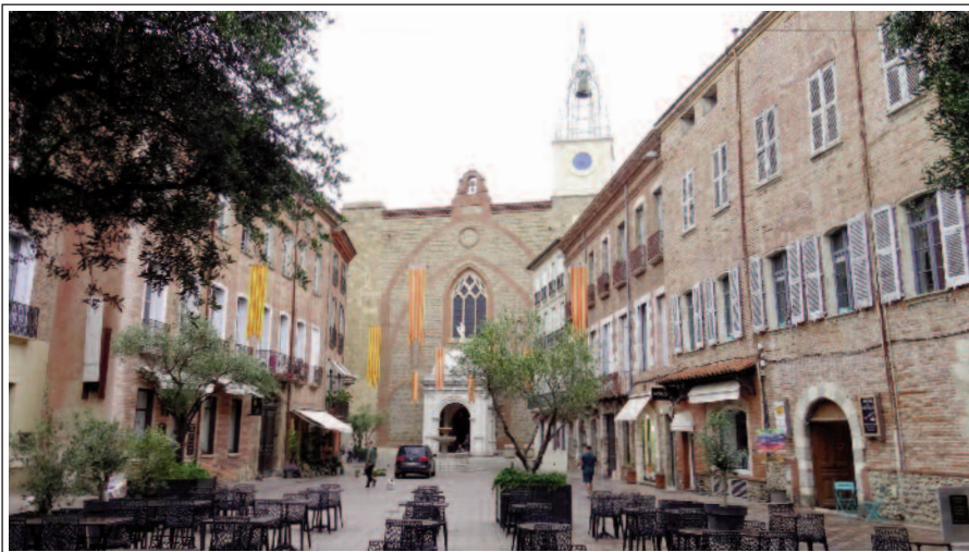
PERPINYÀ. La catedral al fons.

Situada al poble de Cabestany conserva bona part de la capçalera, reconstruïda al segle XII. A l'interior, dalt d'una encavallada, a pocs