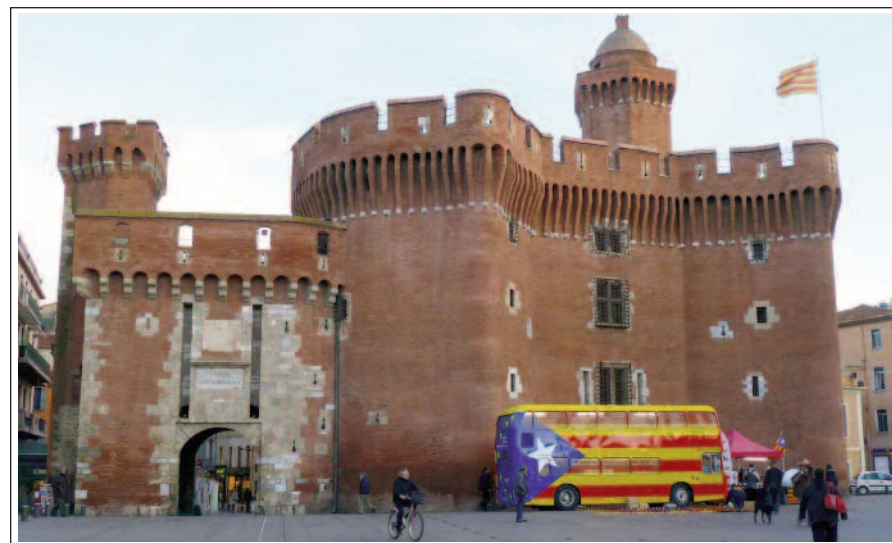
PERPINYÀ. EL CASTELLET.

"La vila de Perpinyà té un origen romà indiscutible i deu el seu nom a alguna vil·la o llogarret rural dels voltants de Ruscino, probablement propietat d'algun client o llibert de Perpenna, lloctinent de Sertorius". El primer esment de la villa Perpinianum apareix en un document de l'any 927.