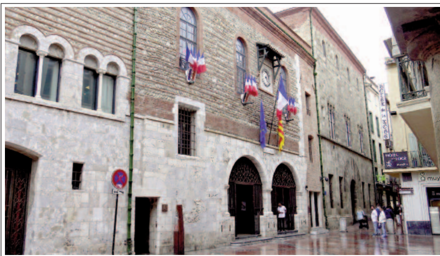
PERPINYÀ. CASA DE LA VILA. Façana. A la dreta de la imatge el Palau de la Diputació