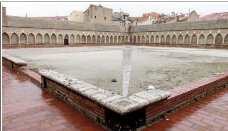
PERPINYÀ.. CAMPO SANTO

A tocar de la catedral hi ha l'antic cementiri, projectat a la mateixa època que el temple. És conegut per Campo Santo i anomenat d'aquesta manera per influència italiana (Pisa). Es tracta d'un claustre cementiri format per quatre galeries amb llargues successions de pòrtics gòtics de marbre blanc. En un extrem hi ha la capella funerària (1483-1489), en pur estil gòtic d'influència mallorquina. Va ser restaurada als anys noranta del segle passat. Els vitralls són moderns.