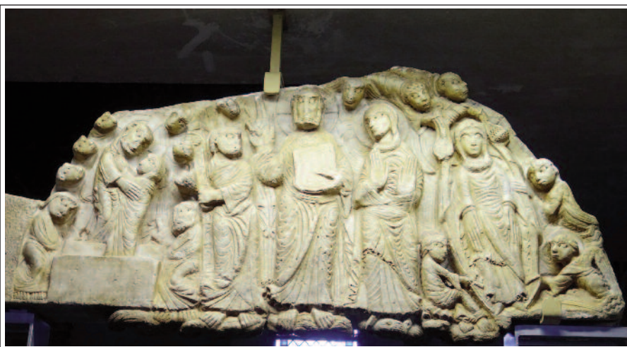
CABESTANY. Timpà. És exposat a l'interior de l'església.

metres del portal, hi ha exposat el cèlebre timpà de Cabestany, esculpit en marbre, que no se sap massa bé si procedeix d'aquesta església. Amb tot, ha donat nom a un gran artista, el Mestre de Cabestany. Se'l cataloga d'escultor ambulat o d'artista viatger perquè hi ha obra seva a diferents llocs: Sant Hilari (bisbat de Carcassona), Rius de Menerbés, Sant Pàpol i La Grassa a l'Aude i també al Voló (Rosselló), a Sant Pere de Roda i a Sant Pere de Galligants (Girona), i encara a Errando (Navarra), a dos indrets de la Toscana, prop de Florència i altres. Actualment es creu que no és únicament obra d'una sola persona i per tant es parla més del "cercle del Mestre de Cabestany".