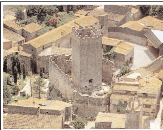
CASTELL DE PERATALLADA. Foto J. Todó-TAVISA, publicada a Catalunya Romànica , vol. VIII, Empordà I , pg. 351 (fragment).

El castell de Peratallada està documentat a l'any 1065, en un document on s'estableixen els límits del castell de Pals. Algunes de les estructures arquitectòniques i altres elements del castell palau actual demostren l'existència d'una edificació anterior. El primer personatge documentat, que dona origen al llinatge feudal és Guillem de Peratallada, l'any 1039. A mitjans del segle XIII morí sense successió Ponç de Peratallada, i la seva germana Guillema es casà amb Gelibert de Cruïlles, creant un domini que s'estenia des del castell de Begur, fins els cims de les Gavarres. També tenien importants possessions a altres indrets, com les comarques de la Selva i Osona.