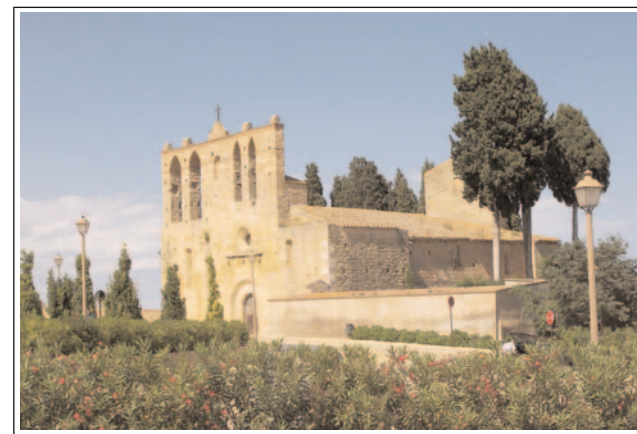
SANT ESTEVE DE PERATALLADA. Foto: Jordi Merino, 2009.

Dels dos absis situats a llevant, el sud és una mica més gran, a l'igual que la nau que li correspon. La diferència de mida de les naus fa pensar en una possible planta basilical de tres naus, amb capçalera triabsidal. La nau de migdia està coberta amb volta apuntada, sostinguda per tres arcs torals de la mateixa forma. No s'ha conservat l'arc triomfal, perquè total la part del presbiteri està força modificada per reformes posteriors. Pel que fa a la nau septen-