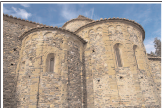
SANT MIQUEL DE CRUÏLLES. Detall de l'absis. Foto: Jordi Merino, 2009.

També ha patit diferents reformes al llarg del temps: una d'elles és la que