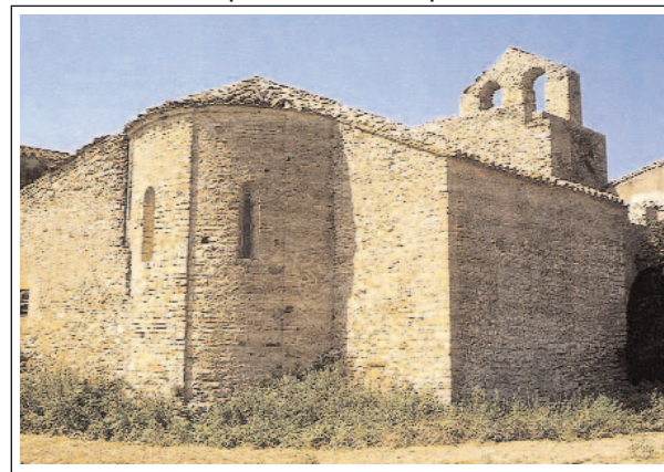
SANT PAU DE FONTCLARA. Foto: F. Baltà, publicada a Catalunya Romànica , vol. VIII, Empordà I , pg. 234.

A la part sud de l'edifici hi queda encara un tall de l'antic parament d'època romàni-