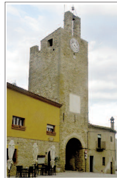
PALAU-SATOR. Torre de les Hores.

El castell és preromànic, del segle X. En època gòtica fou ampliat i la part primitiva va passar a ser la torre mestra. Al seu redós ja s'havia format un petit poble i al segle XIII es va bastir un primer recinte emmurallat. La portalada sud té al damunt una bestorre de defensa que, com que disposa d'un rellotge de sol i d'un de modern, se l'anomena Torre de les Hores.