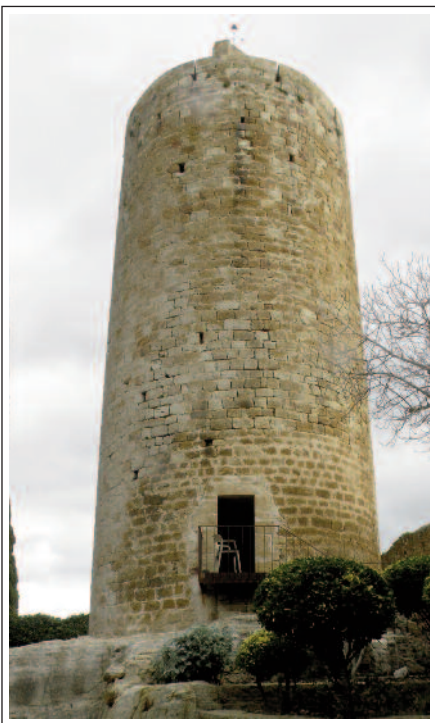
PALS. Torre de les Hores.

Ca la Pruna , on hi ha el Museu Casa de Cultura. És una casa fortificada del segle XV-XVI.