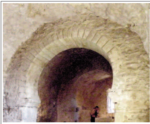
SANT JULIÀ DE BOADA.

L'edifici consta d'una sola nau, dividida en dues parts per un arc toral, capçada per un absis trapezial desviat de l'eix de la nau vers migjorn. La nau està coberta amb volta de canó lleugerament ultrapassada. L'arc triomfal és de ferradura i té els muntants avançats. A l'intradós hi ha uns encaixos rectangulars, segurament per col·locar-hi l'iconòstasi (separació que impedia als fidels veure el celebrant). L'arc toral també és de ferradura però més peraltat, podria ser de tipus visigòtic o bé emiral cordovès. La porta d'accés, modificada amb la restauració, es troba al costat sud i, a la façana de ponent, n'hi ha una altra de tapiada. Allevant s'alcen les restes d'un campanar de cadireta de dos ulls, que és posterior.