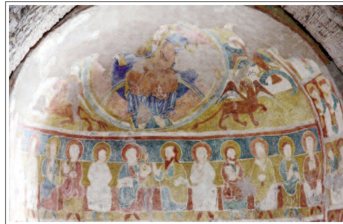
FONTCLARA. Pintures murals.

A l'església es conserven unes interessants pintures murals romàniques, a l'absis i a l'arc triomfal. A l'absis hi és representat, a dalt, la Maiestas Domini envoltada pel tetramorf; a sota els dotze apòstols asseguts en un banc corregut i, entre les finestres, hi ha escenes de la vida de Sant Pau. A l'arc triomfal tenim, al centre, l'Anyell Diví, envoltat pels vint-i-quatre ancians de l'Apocalipsi.