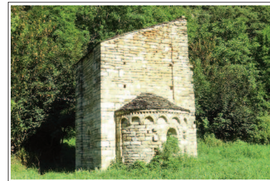
SANT MARTÍ DE LA TORRE DE CABDELLA. (Foto any 2020)

Situada arran mateix de la llera del riu Flamicell, ben a prop de l'encreuament de la carretera que ressegueix la Vall Fosca, amb la d'Astell, Oveix i Aguiró, que coincideix amb una part del camí de la Sal, que venia de Gerri i anava cap a la Ribagorça i la vall d'Aran. Té l'advocació de Sant Martí, com la majoria d'esglésies i capelles que es troben al peu d'un camí important.