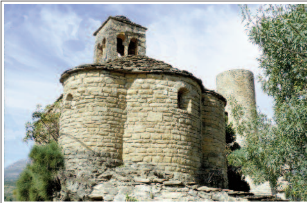
LA BARONIA DE SANT OÏSME. Església i torre de defensa. (Foto any 2012)

De bon començament s'anomenava de Santa Eufèmia i corresponia a la família dels Meià. La primera dada documental que es té data de 1095.