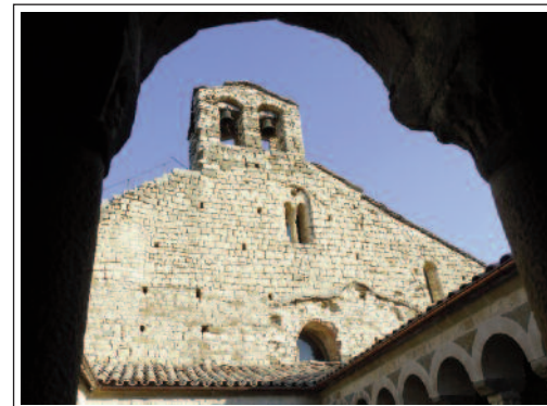
SANTA MARIA DE MUR. (Foto any 2011)

A finals del segle XI, com ja hem esmentat, l'església passà a canònica i es construï el clos canonical que consta d'un claustre i al seu voltant les dependències necessàries per a la comunitat. El claustre és petit i de planta rectan-