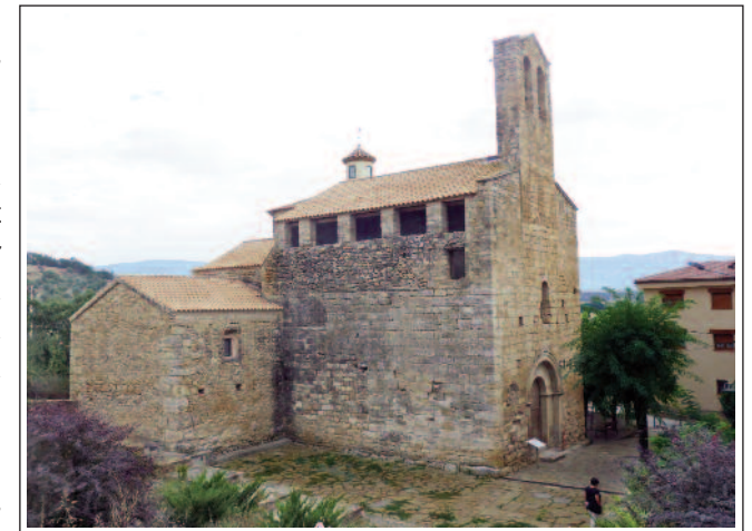
SANT MIQUEL DE CONQUES. (Foto any 2012)

Esplugues, una talla romànica del segle XII, que es va baixar de l'ermita que li dona el nom. Aquesta talla la guardaven els vilatans a casa seva, fins el 2016 que la dipositaren a l'església.