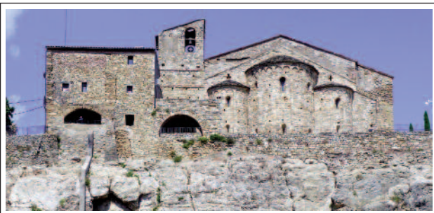
SANTA MARIA DE LLIMIANA. (Foto any 2011)

quitectura romànica llombarda. Consta de planta basilical, tres naus sense transsepte cobertes amb volta de canó i capçades per tres absis semicirculars. La volta està reforçada per quatre arcs torals i la divisió de les naus s'efectua