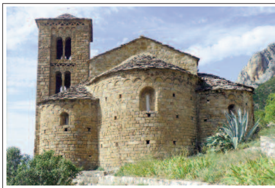
SANT ESTEVE D'ABELLA DE LA CONCA. (Foto any 2012)

la paret nord hi ha dues capelles i la sagristia, la qual cosa fa que quedi amagada. Adossat a la nau oposada, és a dir la sud, hi ha el campanar de torre, de planta rectangular amb tres pisos. El conjunt d'església i campanar són decorats exteriorment amb arcuacions llombardes.