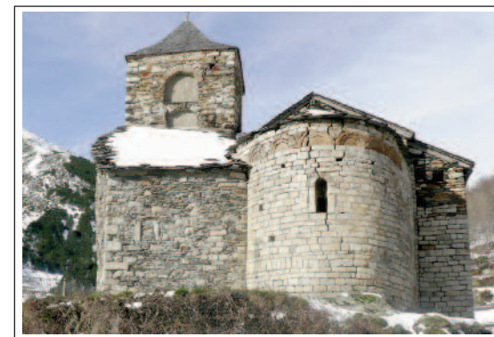
SANT VICENÇ DE CABDELLA. (Foto any 2008)

És un edifici d'una nau, amb una volta de canó i capçada amb absis semicircular orientat a llevant, cobert amb volta de quart d'esfera i decorat amb arcuacions llombardes amb els arcs construïts en pedra tosca i amb una finestra d'arc de mig punt i doble esqueixada. Tant el campanar de torre, com la sagristia i una capella