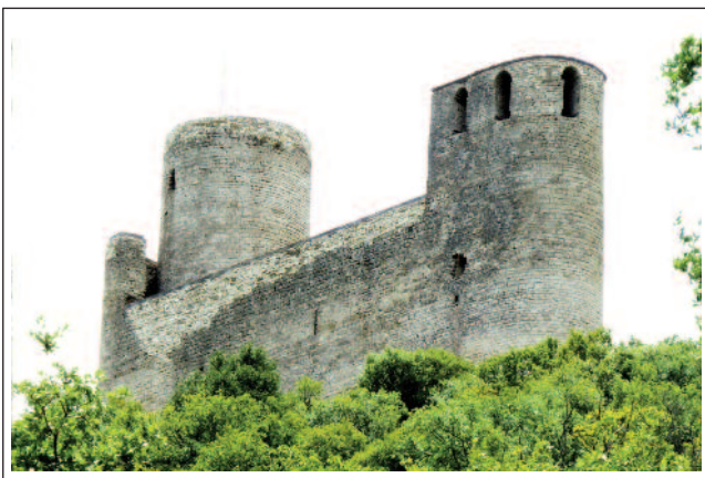
CASTELL DE MUR. (Foto any 2011)

de la torre és lliure i, a la part superior, suportada per un gran arc, hi ha una estança, il·luminada per cinc finestres d'arc de mig punt, a la qual s'accedeix per una porta també de mig punt, situada al nivell del pas de ronda de les muralles.