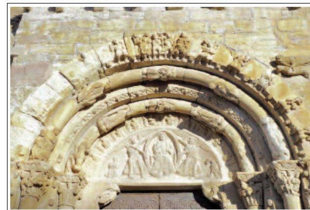
SANTA MARIA DE COVET. Detall del portal. (Foto any 2011)

Nau i transsepte són coberts amb volta de canó. A la nau hi ha dos arcs torals suportats per pilastres semicirculars amb capitells. Un dels trets més rellevants de l'església és la galeria que hi ha al mur de ponent, sobre el portal, darrere de la rosassa i