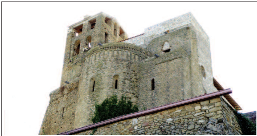
SANT PERE D'ÀGER. (Foto any 2011)

Els absis foren incorporats a la muralla del recinte, però només el central sobresurt a l'exterior on hi ha un fris de arcuacions llombardes. L'interior d'aquest absis està molt decorat, disposa de cinc arcades suportades per columnes amb capitells esculpats. Dues cornises decorades, una per sota