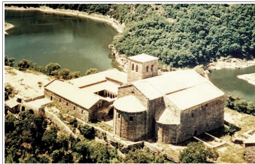
SANT PERE DE CASSERRES. Imatge aèria d'autor desconegut, que il·lustra un rètol del monestir.

Un estret i engorjat meandre del riu Ter, a l'entrada de les Guilleries, ceneix l'estreta serra coronada pel conjunt de Sant Pere de Casserres. Les aigües del riu, retintudes al pantà de Sau, ajuden a aïllar l'indret.