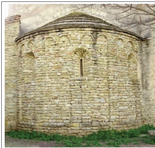
SANTA MARIA DE FOLGUEROLES. Absis descentrat amb la lesena imperfecta.

Ja és citada com a parròquia el 967. L'actual església fou edificada en estil romànic en el segle XI. Se'n conserva l'absis de planta semicircular, decorat amb arcuacions. Segurament per una deficiència en la construcció, la finestra central apareix mal centrada, la qual cosa ocasionà la no construcció d'una lesena. També es veuen arcuacions llombardes en una part del mur sud.