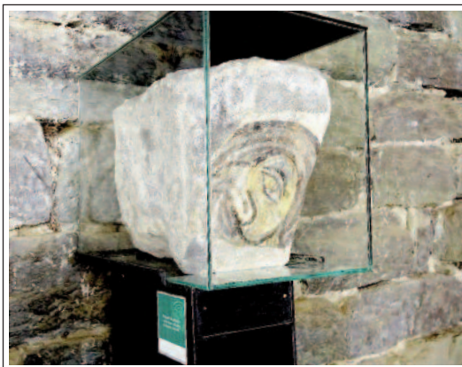
SANT PERE DE CASSERRES. Fragment de pintura mural.

És per allà els anys seixanta que l'arquitecte Camil Pallàs, de la família propietà-