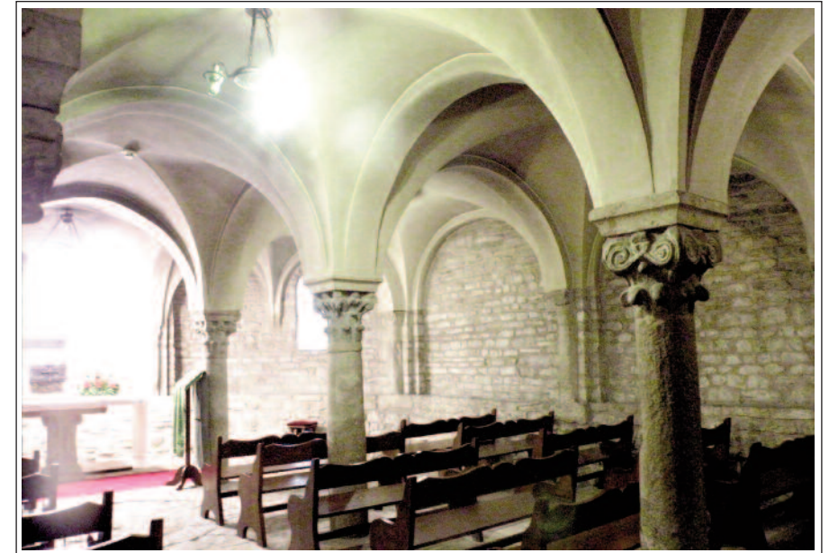
CATEDRAL DE SANT PERE DE VIC. Cripta.