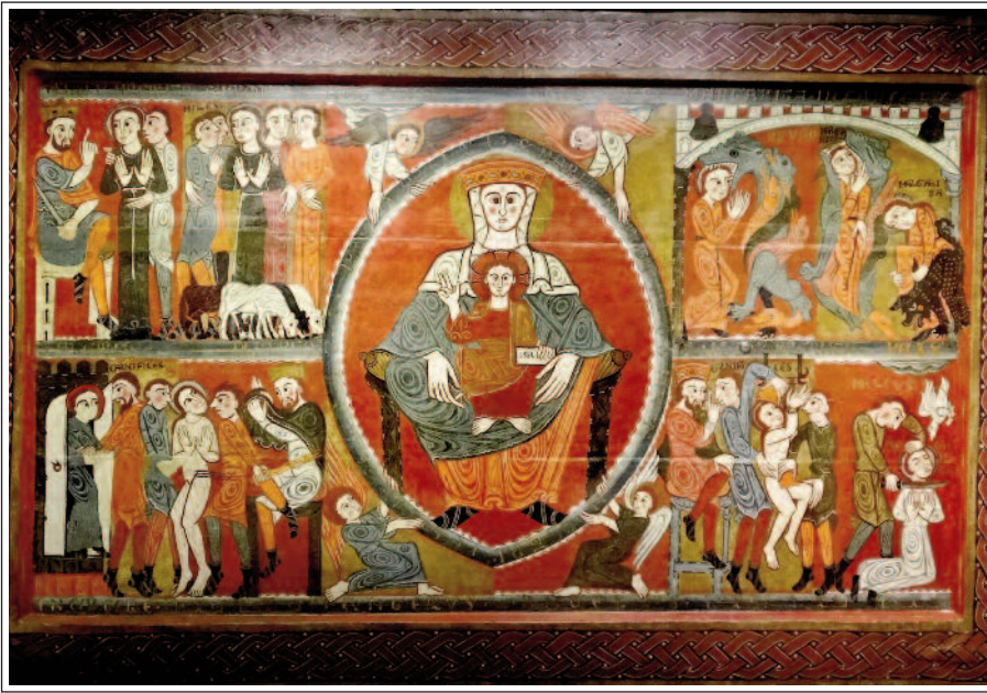
SANTA MARGARIDA DE VILASECA (Sant Martí Sescorts). Frontal d'altar, dipositat al Museu Episcopal de Vic (MEV).

L'església de Sant Pere fou ampliada a mitjan segle X i poc després, a inicis de l'XI, el bisbe Oliba novament la reformà. La nova seu constà d'una nau capçada per un transsepte amb un absis, quatre absidioles i una cripta. Fou consagrada l'any 1038. S'aixecà també el campanar d'estil llombard. Al segle XII es van fer noves transformacions, s'allargà la nau i es bastí una gran portalada monumental. També s'enderrocà l'església de Santa Maria i se substituï per una de circular. Entre el 1318 i el 1400 damunt del claustre romànic, que era molt senzill, es construí un pis superior en estil gòtic. La cripta disposa de tres naus cobertes per voltes d'aresta i sostingudes per columnes amb capitells d'estil califal, aprofitats de la primitiva església preromànica.