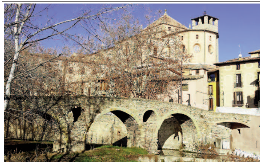
VIC. PONT ROMÀNIC I LA CATEDRAL AL FONTS.

A l'antiga vila d'Ausa, situada a la part alta de l'actual ciutat de Vic, al redós del temple romà, al segle IV s'edificà la primera seu episcopal. Hi ha documentats sis bisbes entre l'any 516 i la invasió musulmana. Entre