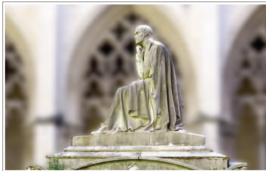
MONUMENT AL VIGATÀ JAUME BALMES. Catedral de Sant Pere de Vic, on és enterrat.

Al segle XVII, la vila havia crescut molt i l'any 1633 s'iniciaren les obres de construcció d'un temple més gran. Es va començar pel costat nord, però les obres foren interrompudes perquè al costat sud hi havia els claustres i els vilatans no volien que s'enderroquessin. Finalment, el 1806 els claustres foren desmuntats, numerats i muntats de nou un cop acabat el costat sud. La catedral actual és d'estil neoclàssic, consta de tres naus separades per grans pilastres, flanquejades per capelles i capçada per un absis poligonal amb girola. A la galeria oriental, per substituir l'església de Santa Maria de la Rodona, es bastí una capella amb cúpula.