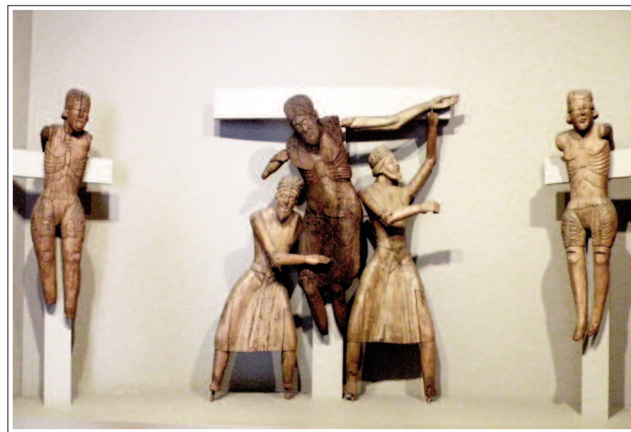
DAVALLAMENT D'ERILL LA VALL. Museu Episcopal de Vic (MEV)..

El Museu Episcopal de Vic consta de diverses col·leccions, però ens centrarem en la de pintura i escultura romànica (segles XII i XIII). Destaquem especialment el conjunt de cinc figures del Davallament d'Erill la Vall. També dotze taules de fusta pintades, tres pintures murals, diverses talles de fusta de la Mare de Déu amb el Nen i un parell de Majestats. Aprofitarem l'ocasió per a visitar l'exposició temporal Bèsties dedicada als animals, tant reals com fantàstics, que apareixen en l'art medieval d'aquest museu.