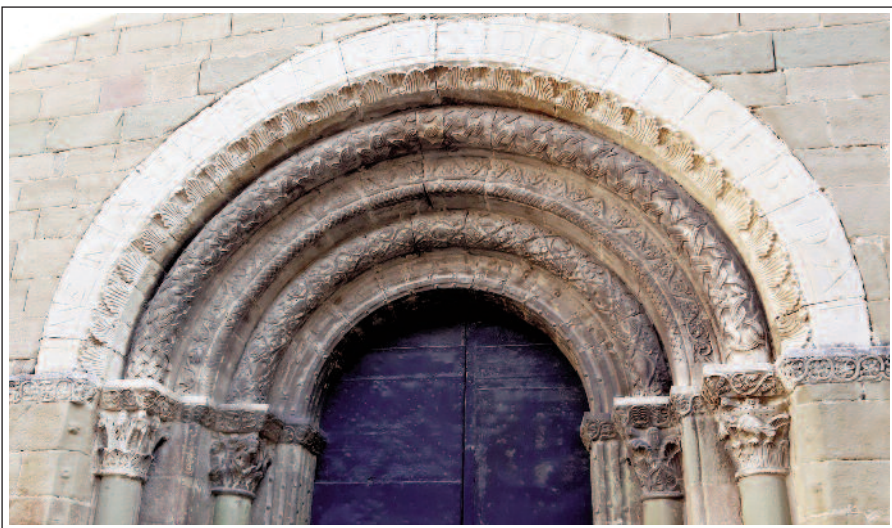
SANTA EUGÈNIA DE BERGA. Portal.

L'edifici consta d'una sola nau coberta amb volta de canó, capçada per un transsepte i tres absis semicirculars. Al creuer s'eleva un cimbori octogonal sobre trompes, coronat per un campanar quadrat que té tres pisos, amb finestres a cada cara i decoració d'estil llombard evolucionat (les arcuacions cegues i les dents de serra són fetes amb pedra sorrenca vermella). Les finestres del primer pis són senzilles, les del segon, bífores i les del tercer, trífores. El cimbori disposa de finestres cegues i decoració com la del campanar. Els murs laterals també tenen la mateixa decoració. A l'aparell es veu perfectament les dues fases constructives: la primera és feta amb carreus petits només desbastats (segle XI) i la segona són ben treballats (segle XII).