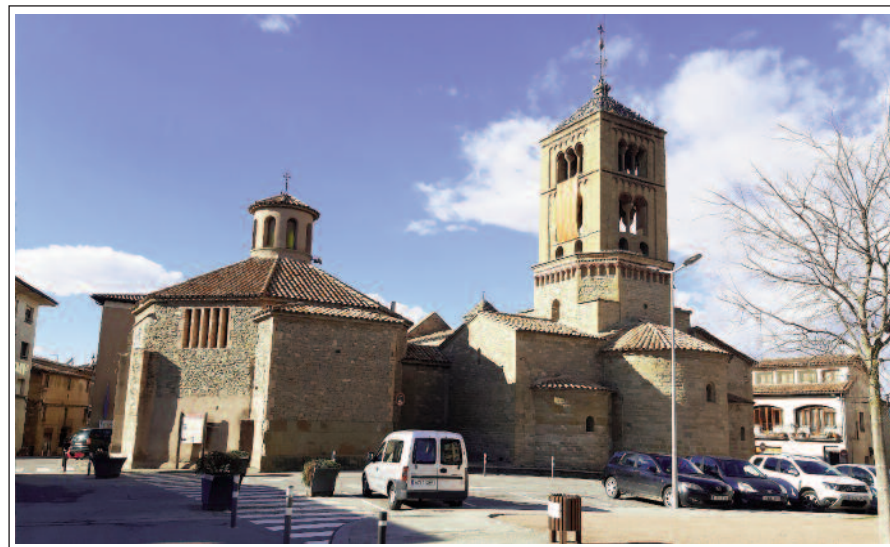
SANTA EUGÈNIA DE BERGA.

Sota l'impuls del bisbe Oliba el temple fou renovat i el 1050 consagrat de nou. Constava de la nau i un transsepte amb tres absis. Els dos primers dedicats a santa Eugènia i santa Cecília i el tercer a santa Maria i sant Jaume. L'any 1144 va ser cedit a la canònica de Vic que va efectuar importants reformes: un bonic portal esculpit, una petita torreta al cantó nord-oest i, al creuer, un cimbori campanar. Durant els segles XVI i XVII s'hi van afegir capelles laterals que foren suprimides durant la restauració dels anys 1955 i 1975. El 1931 fou declarada monument nacional historicoartístic.