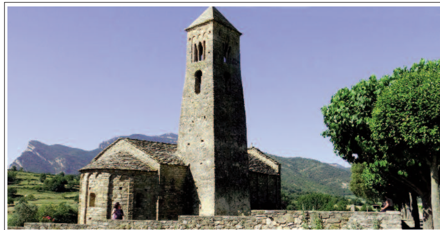
SANT CLIMENT DE COLL DE NARGÓ.

Església d'estil llombard datada a finals del segle XI, de la qual cal destacar el campanar de torre que consta de dues parts: una més antiga, preromànica, de planta rectangular amb un sòcol força alt i atalussat que li dóna l'aspecte característic, amb una obertura gran a cada costat i l'altra part és sobreposada a l'anterior, romànica, amb finestres de tres forats, separades per columnes coronades per capitells en forma de mènules i