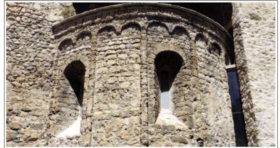
SANTA MARIA D'ORGANYÀ. Absis.

Com moltes de les esglésies del nostre país ha sofert molts canvis al llarg dels seus mil anys d'existència. Avui és una església de tres naus encara que la nau lateral nord és el resultat d'unir les capelles laterals que hi havia. L'absis és del segle XII i decorat amb un fris llombard d'arcuacions cegues i lesenes, sota un fris de dents de serra. La façana de ponent és del segle XIII. S'hi obre un portal format per tres arcs apuntats en gradació, ressaltats per tres arquivoltes que descansen sobre una