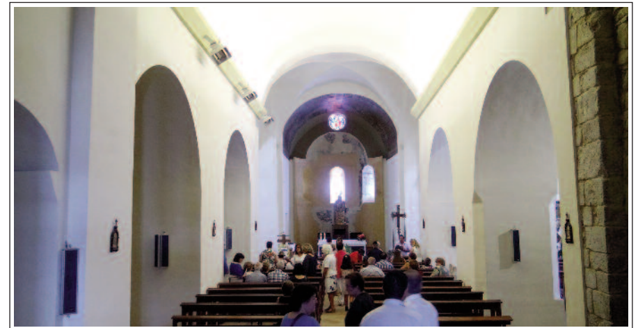
SANTA MARIA D'ORGANYÀ. Interior.

Actualment a l'església hi ha instal·lada una rèplica de la majestat d'Organyà del s. XII, l'original de la qual es conserva al Museu Nacional d'Art de Catalunya.