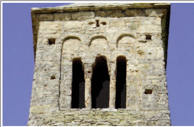
SANT CLIMENT DE COLL DE NARGÓ.

arcs de mig punt, tot plegat emmarcat per un fris de tres arcuacions cegues.