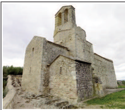
SANT MIQUEL D'OLÈRDOLA. Absis de l'església romànica (esquerra) i preromànica. Al peu tombes olerdolanes.

Els romans aprofiten la situació immillorable del poblat olerdolà i a finals del segle II i començament de l'I aC reutilitzen construccions antigues i el fortifiquen millor. D'aquesta època és la muralla de carreus poligonals, la gran cisterna excavada a la roca, -amb les canals per omplir-la- i, finalment, la torre talaia, al capdamunt del turó. Durant la segona meitat del segle I s'abandona el poblat i roman mil anys deshabitat, excepte en ocasions puntuals que serveix de refugi.