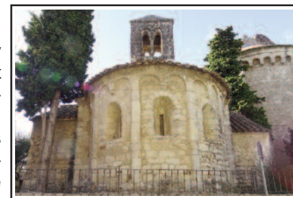
SANT CUGAT DE MOJA. Al costat de l'absis romànic hi ha el de l'església actual.

El lloc de Moja és esmentat ja l'any 981, com a domini senyorial de Sant Cugat del Vallès, un domini que persistia encara durant el segle XI. L'església romànica, del típic estil dels segles XI i XII, que era dedicada antigament a Sant Cugat, és al costat de l'església moderna, dedicada a Sant Jaume. És un bonic exemplar d'una nau amb creuer, absis amb arcuacions i bandes llongobardes i un graciós campanar de torre quadrat, amb finestres geminades en el seu únic pis, i aixecat damunt la nau. Prop de l'església hi ha una torre de base circular, envoltada d'altres construccions modernes. És també originària del període romànic i, igual que l'església, era domini del monestir de Sant Cugat del Vallès.