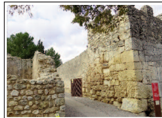
OLÈRDOLA. Muralles i portal. Foto: Lluís Fernández, 2019.

La importància d'Olèrdola també ve donada per les nombroses etapes històriques en què l'home hi ha estat present. Els primers pobladors d'Olèrdola se situen a l'edat del bronze. A finals d'aquesta etapa i començaments de la del ferro el turó no solament és habitat, sinó que es fortifica amb una primera muralla (segles VIII a VII aC). A partir d'aquí hi trobem instal·lada la cultura ibèri-