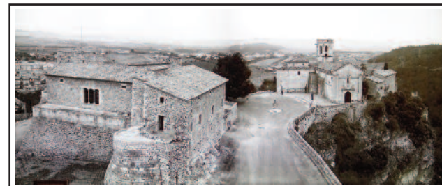
CASTELL I ESGLÉSIA DE SARROCA. Panoràmica amb els dos elements damunt la roca. Bonica fotografia que llueix en una estança del castell.

Castell esmentat per primera vegada l'any 984, quan comença el llinatge dels Santmartí. Va ser destruït per la ràtzia d'Almansor i un cop reconstruït va haver de suportar l'atac dels almoràvits el 1108. Consolidat