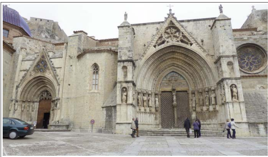
MORELLA. Església arxiprestal de Santa Maria.

XIII que assistís al concili de Constança, però ell s'hi negà i fins prohibí sota pena d'excomunió que hi assistissin els prelats catalans i aragonesos. És obra de l'escultor local Sanxo, contemporani d'aquests fets i és probable que les tres figures fossin vertaders retrats.