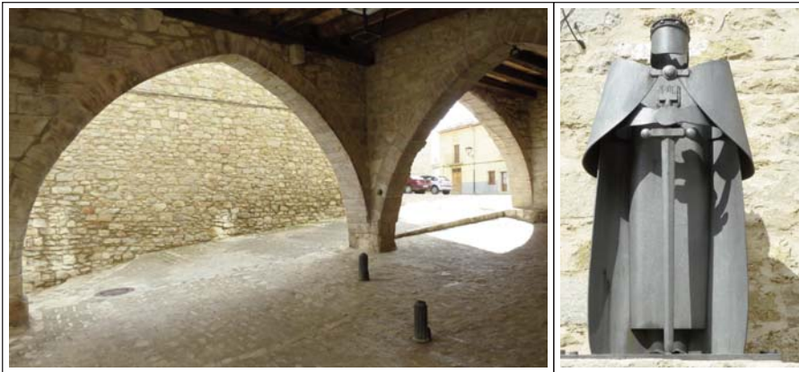
ARES DEL MAESTRAT. Llotja, situada als baixos de l'ajuntament.