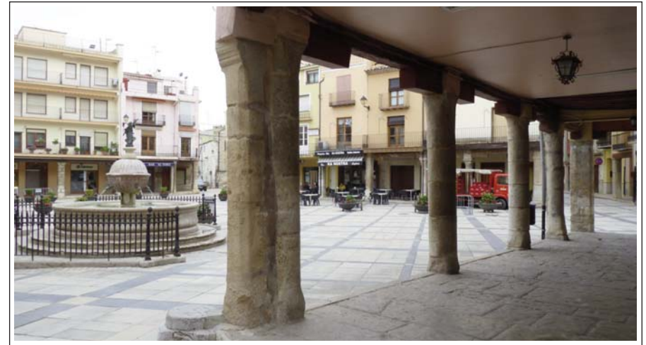
SANT MATEU. Plaça Major, amb la font de l'Àngel a l'esquerra.

L'església de l'Assumpta, de tres naus, és una obra del segle XVIII. La torre sembla ser del segle anterior i dona pas al carrer. La façana lateral té un pòrtic de dos arcs que dona a la plaça. Ocupa el lloc d'una església anterior que es demolí el 1732, per a construir-hi l'actual. La casa del Batlle està situada a la cantonada oposada de l'església. El pòrtic d'arcs gòtics n'és el més significatiu. Fou construïda pels santjoanistes que havien succeït els