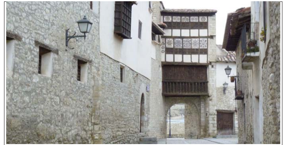
MIRAMBELL. Interior del portal de les Monges, amb les vistoses gelosies que el caracteritzen.

El lloc que ocupa Morella era habitat en època romana, i va ser una important fortificació de la taifa de Tortosa. Fou conquerida momentàniament pel Cid el 1084, i per Alfons I el Bataller d'Aragó, el 1114. Però la reconquesta definitiva fou el 1234, per Balasc d'Alagó, que el 1249 la cedí al rei Jaume I, que ratificà la carta de població. A partir d'aleshores augmentà la seva importància comercial, en part gràcies a l'activa minoria jueva, i es desenvolupà una notable indústria llanera que ha subsistit parcialment.