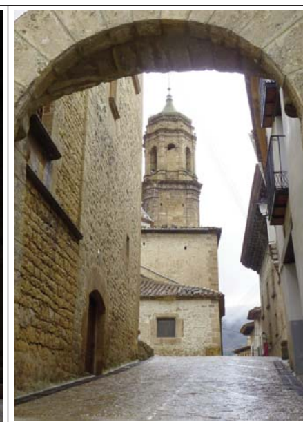
L'ANGLESOLA. Portal i campanar de l'església.

templers. Aquí Cabrera hi ocupà el seu quarter general. Últimament, hi residia la Guàrdia Civil. La casa rectoral està davant per davant de l'ajuntament i complementa la visió de la plaça Major. És un edifici barroc de tres plantes edificat el segle XVIII. Sobre la porta hi ha un escut molt decorat.