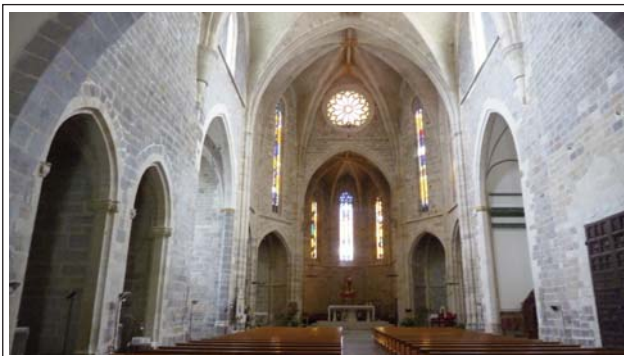
SANT MATEU. Interior de l'església arxiprestal.

Dels religiosos, cal destacar l'església arxiprestal (segles XIII al XV) d'estil gòtic, però amb una bonica portada romànica del XIII. Al seu interior es troba el Museu Arxiprestal