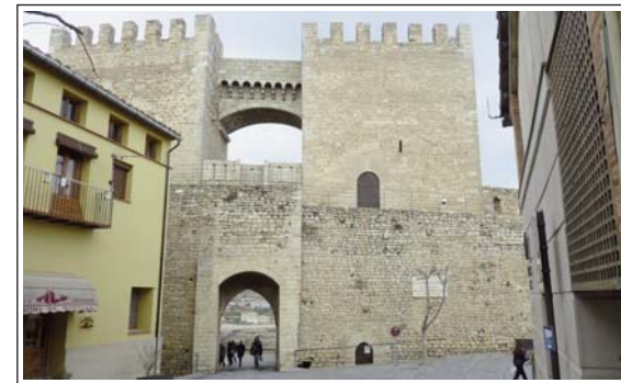
MORELLA. PORTAL DE SANT MIQUEL vist des de l'interior de la vila.