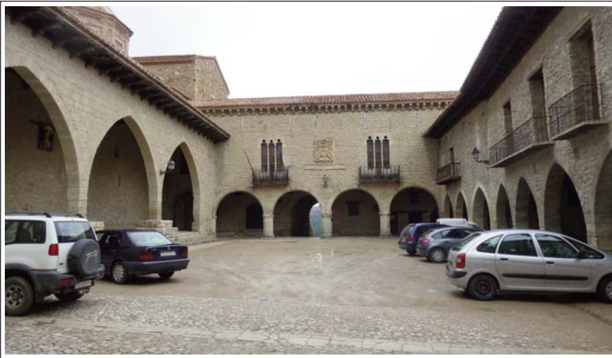
CANTAVELLA. Plaça Major