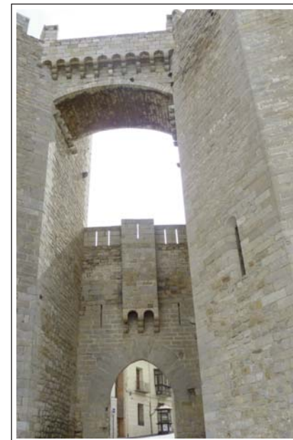
MORELLA. Portal de Sant Miquel. Exterior.

És el més espectacular dels accessos a la ciutat. Format per dues torres bessones de planta octogonal, unides en la part alta per un pont de pedra d'arc molt rebaixat. Aquests conjunt fou bastit el 1360. Les dues torres es componen de baixos i quatre pisos i tenen l'accés per una escala de fusta que permet el tancament de cada una de les plantes. A la part exterior del portal hi ha una notable creu de pedra gòtica, coneguda per la creu de les Tres Testes Coronades. Recorda la trobada a Morella del rei Ferran d'Antequera, el Papa Benet XIII i Sant Vicenç Ferrer el 1414. El rei procurà de convèncer Benet