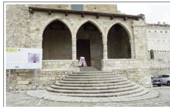
MORELLA. CONVENT DE SANT FRANCESC.

segle XV. En una de les seves parets es poden veure les restes d'un fresc representant la Dansa de la Mort. A prop hi ha la sala del refetor. Per un racó del claustre es té accés a l'església, de planta rectangular i amb absis. S'està restaurant. El conjunt de les edificacions estan ocupades pel Museu Etnogràfic de Morella i el Maestrat.