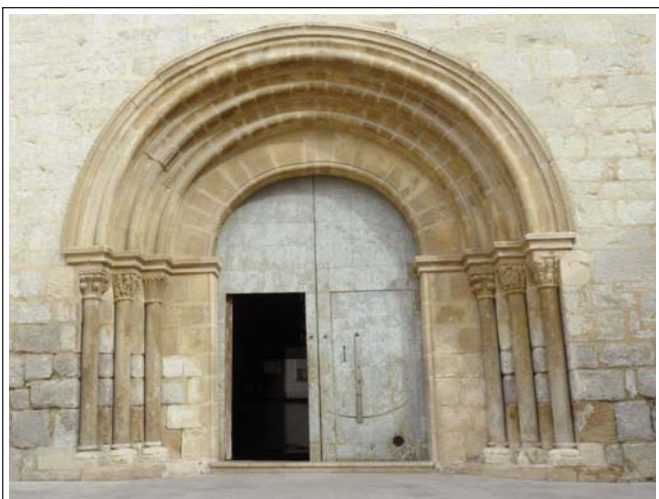
SANT MATEU. Portalada romànica de l'església arxiprestal

Durant el segle XIV conegué una gran transformació urbanística, que quedà frenada a finals de segle i a primera meitat del següent per les epidèmies. Les guerres també provocaren moltes convulsions. Primer la de les Germanies, després la de Successió. Un cop conquerida la vila, l'ignominiós Felip V ordenà la demolició de les muralles. Més tard amb la del Francès i finalment amb les carlines.