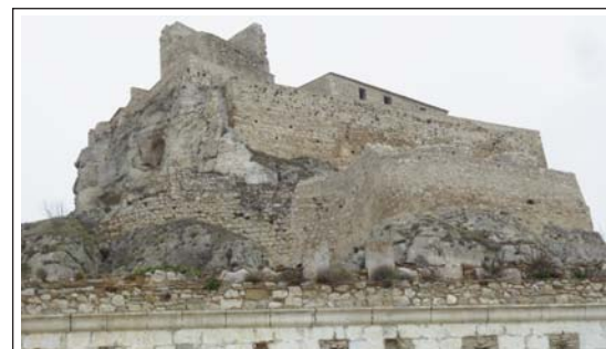
MORELLA. Vestigis del castell que presideix la vila.

Important ja en època islàmica i refet, fins el segle XIX ocupa tot el cim de la mola de Morella, i tingué un extraordinari valor estratègic fins que fou destruït amb la Guerra Carlina. Fou presó dels prínceps alarbs de València Ben-Zoid i