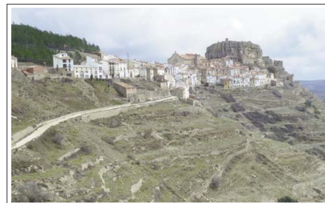
ARES DEL MAESTRAT. A l'extrem dret la mola del castell.

Fou conquerida per Jaume I el 1232, i cedida als templers. El 1319, passà a l'orde de Montesa. La vila estava emmurallada i en resten dos portalets. És destacable l'ajuntament, d'estil gòtic dels segles XIV i XV, bastit damunt de les antigues muralles musulmanes del X. Té una Sala Capitular on es reunien els templers. A sota hi ha la presó i a tocar l'antiga llotja