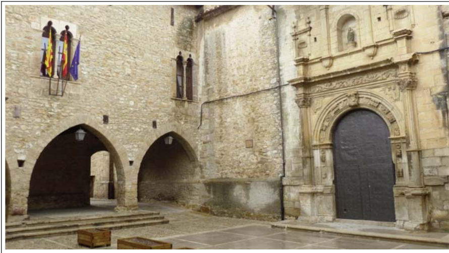
L'ANGLESOLA. Ajuntament i església parroquial.

torre dels Nublos, o de l'Homenatge i el portal de Sant Pau, úniques restes de les primitives muralles.