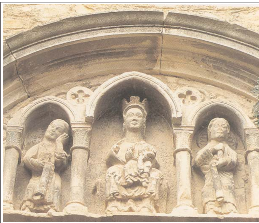
SARRAL. ESGLÉSIA DE SANTA MARIA. Timpà.

El timpà. Del primitiu temple, quan es construí l'actual, es conservà la porta d'entrada amb el seu timpà que s'adossà al mur sud. El timpà és una notable peça romànica del segle XIII. Té forma semicircular, un motiu vegetal ondulat ressegueix la vora i en el centre hi ha tres arcades sostingudes per columnes amb capitells esculpits. La del centre aixopluga la imatge de la Mare de Déu amb l'Infant al qual li manca el cap. Les altres dues contenen una figura humana masculina, la de la esquerra s'identifica amb sant Joan Evangelista i la de la dreta seria un profeta.