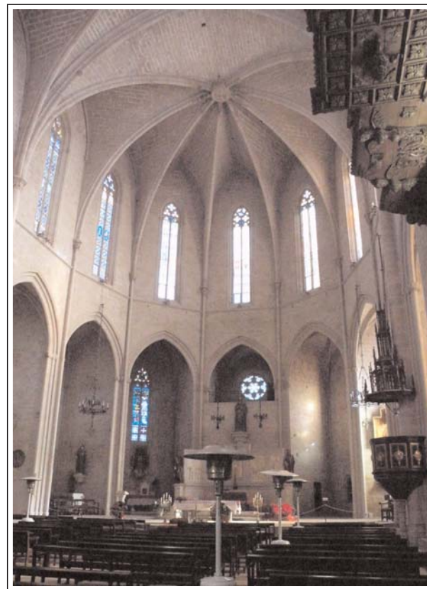
MONTBLANC. SANTA MARIA LA MAJOR. Interior.

La façana principal és molt bonica, d'estil barroc i consta de tres nínxols amb escultures que representen els apòstols i el Pare Etern. L'edifici és d'estil gòtic, d'una sola nau coberta amb voltes de creueria que en les claus, esculpides, hi ha escenes de l'Antic Testament, absis poligonal i onze capelles. En l'interior de l'església hi ha obres de gran categoria: L'orgue data de