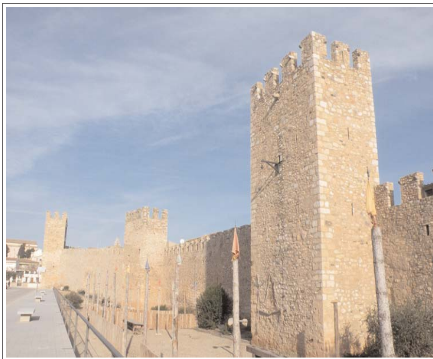
MONTBLANC. MURALLA DE SANT JORDI.

fundar-se la vila el segle XII. La part alta s'hagué de refer diverses vegades a causa de les riuades, també s'hagué de reconstruir, l'any 1966, l'ull nord volat durant la Guerra Civil. Malgrat tot això, manté l'estructura romànica original.