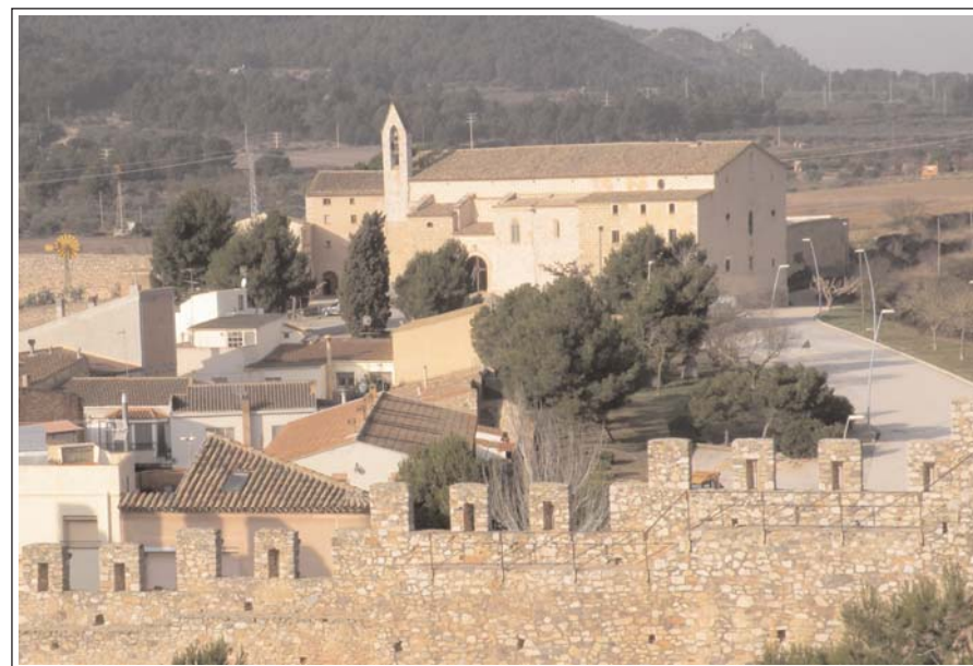
MONTBLANC. MONESTIR I SANTUARI DE LA SERRA.

En aquesta església se celebraren les Corts de Catalunya de 1307, 1333 i 1370.