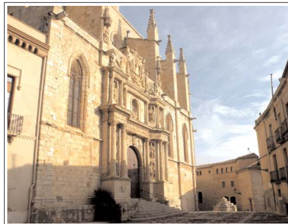
MONTBLANC. SANTA MARIA LA MAJOR. Façana principal.

L'origen de la vila, cal situar-lo en el llogaret de Duesaigües – confluència dels rius ja esmentats -. L'any 1150, aquest lloc fou repoblat i colonitzat per Pere Berenguer de Vilafranca a instàncies del comte de Barcelona Ramon Berenguer IV, que li ordenà canviar el nom de la vila pel de Vila-salva.