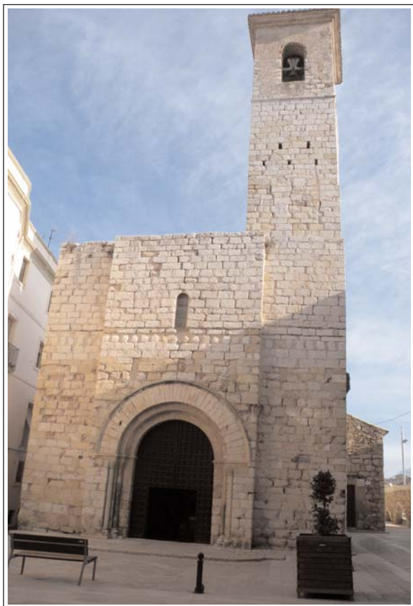
MONTBLANC. ESGLÉSIA DE SANT MIQUEL.

El temple primitiu romànic, va ser totalment enrunat quan els exèrcits del rei Joan II el Sense Fe entraren a la vila l'any 1464. Fou substituït per un de nou de gòtic, que a la seva vegada ho fou, el segle XVIII, per l'actual barroc.