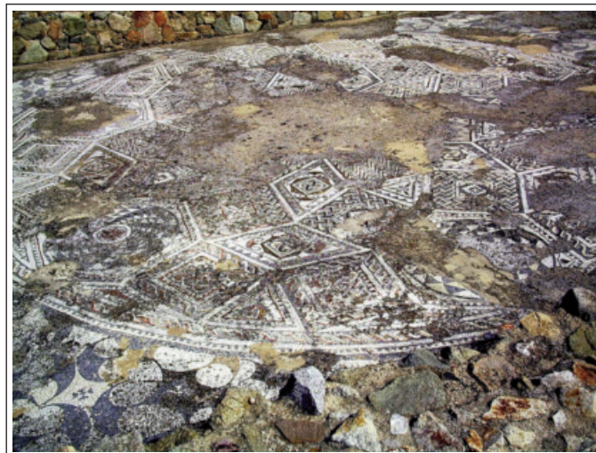
VIL·LA ROMANA DE TORRE LLAUDER. Mosaic.

La vila és d'origen romà i l'anomenaven lluro. Al mateix lloc, s'hi han fet troballes paleolítiques i la zona també fou poblada per la tribu dels laietans (ibers). Més tard els visigots la denominaren Alarona i no és fins al segle XI que trobem el topònim Matarone. La vila es formà a redós de