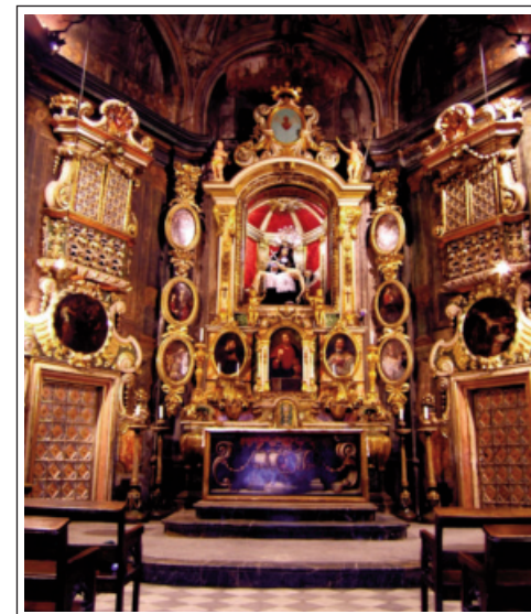
CAPELLA DELS DOLORS. Altar major.

Consta de diverses seccions. En la Secció d'Arqueològica es poden veure les troballes fetes a Mataró. També hi ha una sala de síntesi de la història de la ciutat.