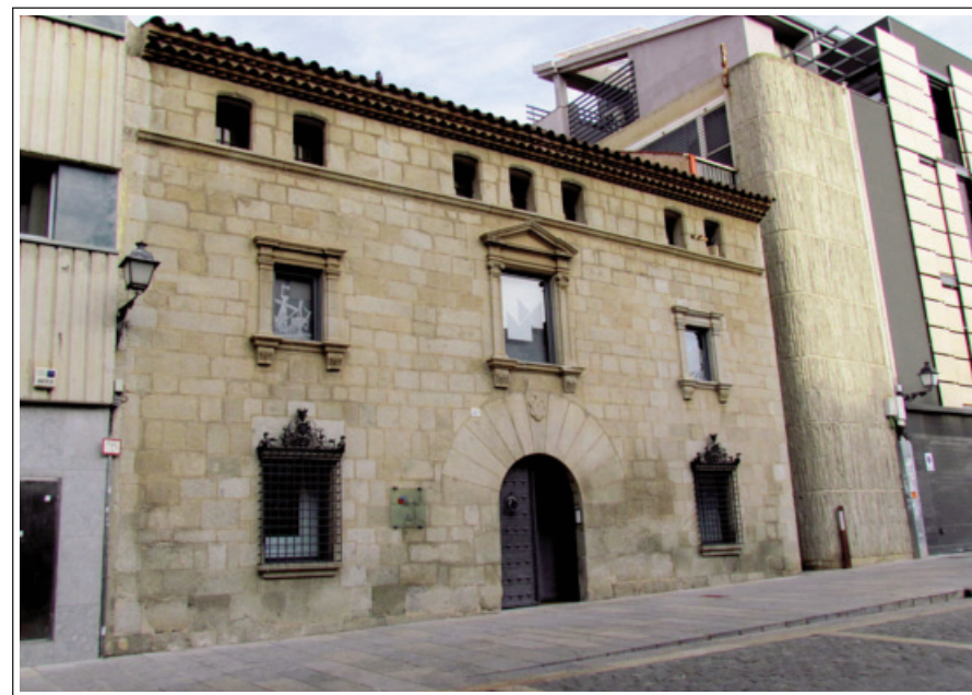
CAN SERRA. Museu Municipal de Mataró. Façana.

Les peces trobades, escultures i objectes són al Museu de Mataró.