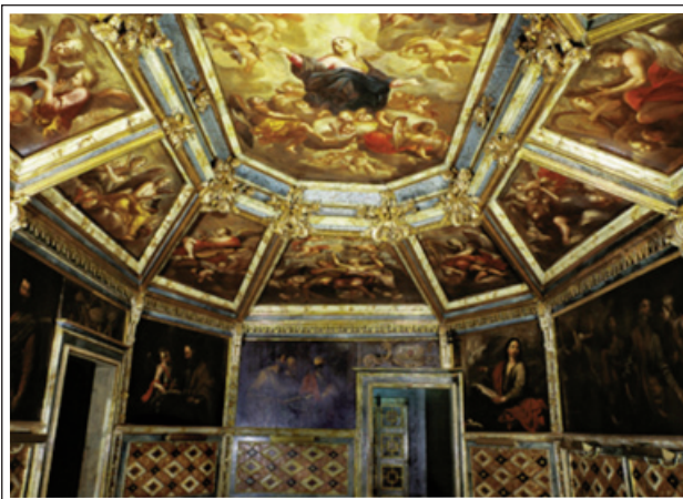
CAPELLA DELS DOLORS. Sala de juntes.

En una de les Seccions hi ha el Conjunt dels Dolors, que fou construït entre els anys 1694 i 1798 per la Venerable Congregació de Nostra Senyora dels Dolors, per tal que fos la seva seu. Es compon de Capella, Sagristia, Sala de Juntes, Cor i Cripta.