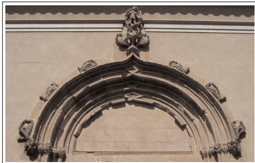
SANT genís de Vilassar. Portada gòtica.

L'església parroquial actual és moderna, però fou bastida en el mateix indret en el que hi hagué, primer una de romànica, citada l'any 1118 i després una altra de gòtica, del segle XVI. Popularment, sempre ha sigut coneguda com " dels Genisos " ja que està dedicada a Sant Genís d'Arle i Sant Genís de Roma.