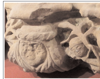
Mènsula gòtica exposada al Museu Parroquial.

La majoria de les peces més singulars de l'edifici gòtic (claus de volta, mènsules, capitells...) es conservaren i són al Museu Parroquial. Són remarcables les claus de volta gòtiques de Sant Jaume, la Santíssima Trinitat i Sant Elm. Encara en són més les mènsules amb representacions bíbliques de la Nativitat, l'Epifania, la Fugida a Egipte i les dues dels Evangelistes. També són interessants les mènsules neogòtiques de la capella del Santíssim.