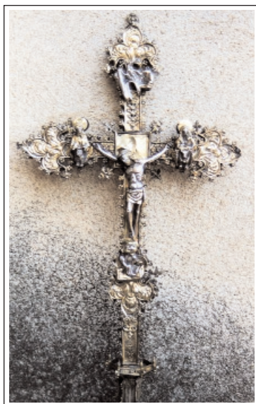
SANT MARTÍ DE TEIÀ. Creu processional gòtica. Foto: Joaquim Graupera.

Catalunya Romànica, vol. XX: El Barcelonès, el Baix Llobregat i el Maresme. Graupera i Graupera, Joaquim: L'art gòtic al Baix Maresme (segles XIII al XVI). Tesi Doctoral 2013. Graupera i Graupera, Joaquim: Catalunya Medieval, el Maresme. March Editor, 2007.