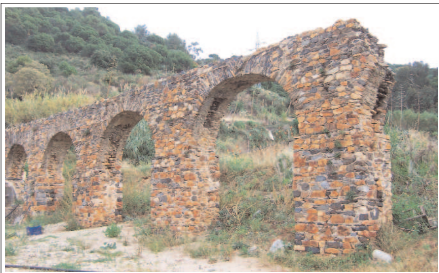
AQUÈDUCTE ROMÀ DE CAN CUA.

Recollia les aigües d'un petit congost de la vall de Riu, per mitjà d'una resclosa. Tenia una llargària de 3.5 km, un desnivell de 40 m i amb el seu recorregut salvava quatre torrenteres. En una d'elles, la de Can Cua, hi ha les restes més ben conservades, quatre arcades. Fou construït amb pedres calcàries o granítiques extretes al mateix indret, trencades a cop de martell, lligades amb morter de calç i sorra i disposades en filades irregulars. Prat i Puig data la construcció a finals del segle II o el III dC, altres, en canvi,