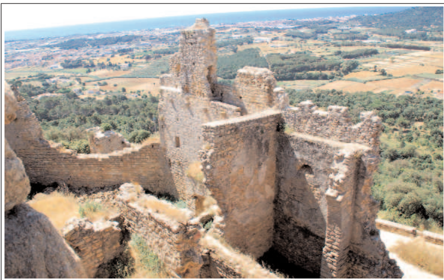
CASTELL DE PALAFOLLS. Ruïnes.

El recinte sobirà és de forma poligonal, irregular i descentrat respecte a la totalitat del conjunt. Interiorment es dividia en dos àmbits: el primer, del segle XIII, comprèn unes naus separades per una filada d'arcs, una cisterna coberta amb volta de canó i una capella coberta amb volta apuntada. El segon, ocupa una elevació allargada, disposa d'una sèrie d'àmbits al voltant d'un espai que devia ser descobert. A l'extrem nord s'alça part d'una torre de planta rectangular amb fragments d'aparell en opus spicatum i, al costat sud-est, adossada a una torre, hi ha una estança coberta amb volta de canó que es creu que podria ser la base de la torre de l'homenatge. Al sud es troba la porta d'entrada.