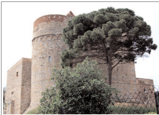
MONESTIR. SANT POL DE MAR.

senyors veïns, els Cabrera. El 1415 passaren a dependre del monestir de Montalegre, que havien fundat els cartoixans de Vallparadis. Finalment, el 1434, la cartoixa es trobava en total decadència, fou abandonada i venuda al vescomte de Cabrera. A la segona meitat del segle XV, Bertran d'Armendaris, senyor circumstancial, la fortificà i l'emprà com a construcció militar, però a causa de la seva poca operativitat, no tardà gaire en abandonar-la.