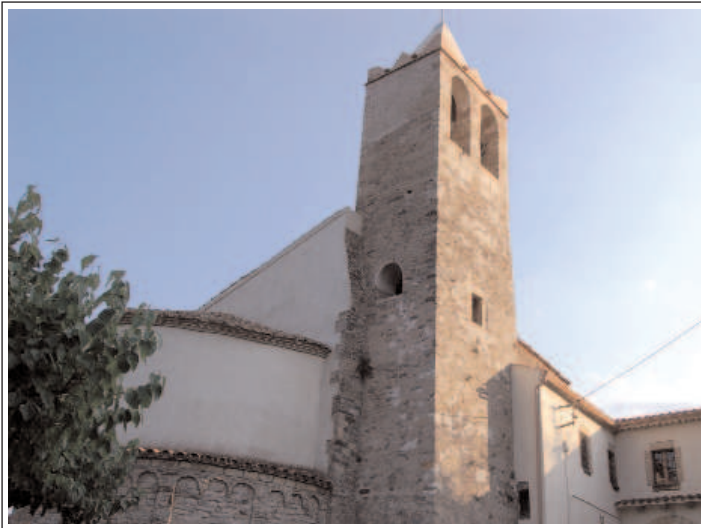
ESGLÉSIA DE SANT PERE DE RIU.

L'edifici, és d'una sola nau coberta amb volta de canó i capçada, a llevant, per un absis semicircular cobert amb volta de quart d'esfera. A l'exterior la capçalera i el mur sud estan ornats amb arcuacions i lesenes llombardes. La porta primitiva