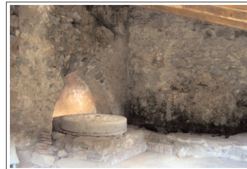
MOLÍ DE CAN MARQUÈS.. Sala de la mola.

El mas està documentat amb motiu de la seva donació l'any 1213 al monestir de Santa Maria de Roca Rossa, en canvi el molí apareix per primera vegada en el capbreu de 1505. L'edifici està datat al segle XIV-XV, és de planta quasi quadrada i conserva bastant la seva estructura inicial malgrat les reformes sofertes i que té el sostre esfondrat.