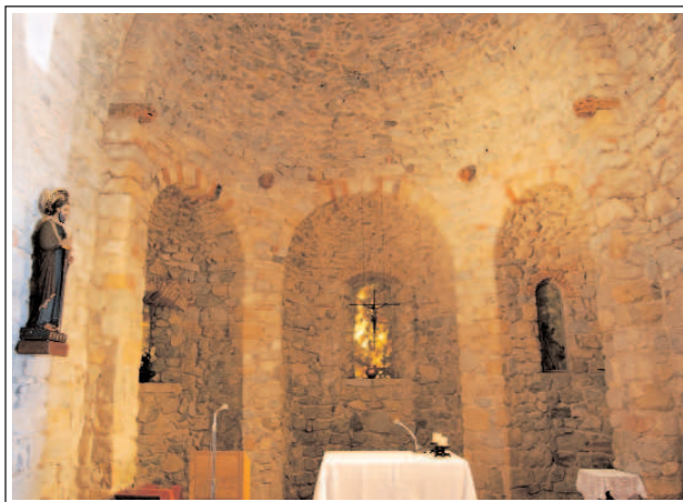
MONESTIR DE SANT POL. Interior. Fornícules de l'absis.

L'edifici actual és molt complex i correspon a diverses fases constructives. Sota la nau de l'església romànica, hi ha una primitiva edifi-