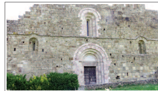
SANTA MARIA DE MARCÈVOL.

la petita església de Marcèvol, ara Santa Maria de les Grades, i de les terres de l'entorn i els seus censos. És a meitat de segle XII quan construeixen un nou priorat amb una nova església. Cal tenir en compte que la frontera del Llenguadoc i la francesa passaven força a