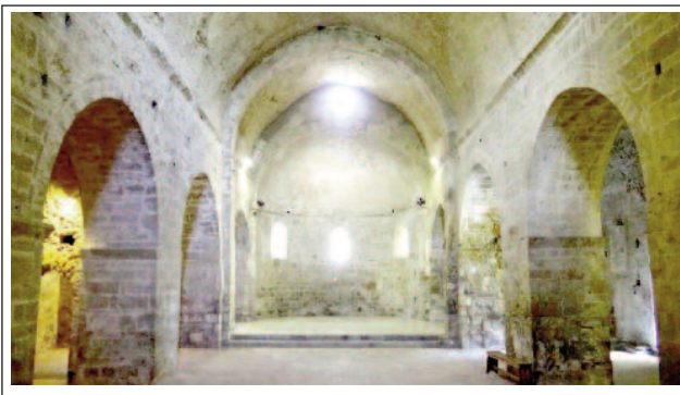
SANTA MARIA DE MARCÈVOL. Interior.

La façana és orientada a l'oest i construïda amb carreus llisos de granit, perfectament tallats. Conserva una cornisa primitiva. La portalada és de marbre rosa de la pedrera de Vilafranca de Conflent, que contrasta amb la resta