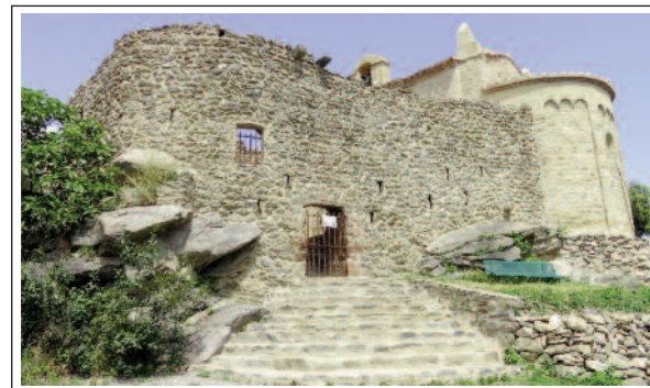
SANTA MARIA DE LES GRADES.

El portal és refet al segle XIV o XV, amb arc apuntat i es troba