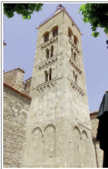
SANT PERE DE PRADA. Campanar.

Prada és la capital del Conflent i una vila molt estimada a Catalunya, on hi ha enterrat Pompeu Fabra; l'any 1950 Pau Casals hi va crear el festival de música que porta el seu nom; d'ençà de 1968, cada estiu, la vila acull la Universitat Catalana d'Estiu.