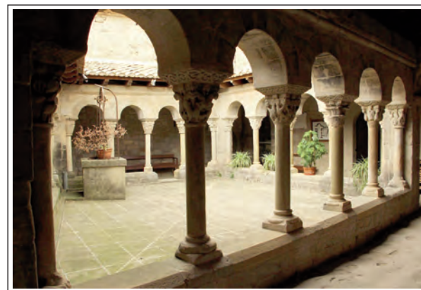
MONESTIR DE SANTA MARIA DE LLUÇÀ. Claustre.

conegut frontal romànic dipositat en el museu de Vic i salvat de la destrucció de 1936. Una obra clàssica sobre fusta i que es pot datar pels volts de 1250, època de major esplendor del monestir. El que no es pogué salvar fou el retaule barroc que tapava tot l'ab-