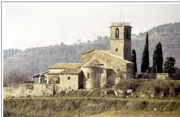
SANTA MARIA DE LLUÇÀ

L'església és d'una nau amb creuer. La volta del cor ja existia en el segle XIV, època de les pintures murals gòtiques descobertes el 1954, les quals es poden veure en el museu parroquial. Procedent d'aquesta església és el