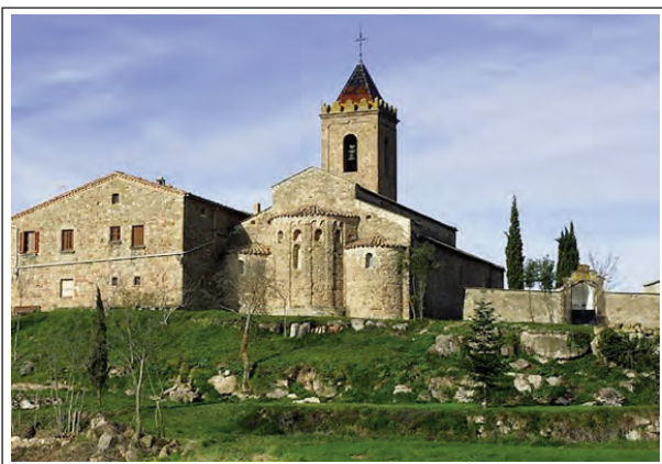
SANT ANDREU DE SAGÀS

L'edifici actual és de la primera meitat del segle XI i per tant no correspon al consagrat pel bisbe Nantigís. En el transcurs del temps ha sofert moltes transformacions. Els treballs de restauració fets pel Servei del Patrimoni Arquitectònic de la Generalitat, des de 1985, han permès descobrir la forma original del temple.