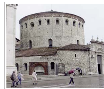
CATEDRAL VELLA. Brèscia