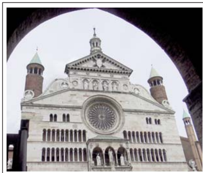
CATEDRAL DE CREMONA.

Ciutat llombarda d'uns 100.000 habitants. A partir del segle XVI la ciutat va prendre una gran importància per la proliferació dels lutiers, és a dir, els artesans que produïen, sobretot instruments de corda fregada. Procedeixen d'aquí els famosos violins Stradivari. Destaquem la catedral o duomo , que és un magnífic edifici llombard començat en estil romànic i finalitzat en estil gòtic, que sobresurt per la seva rica façana de marbre blanc precedida per un pòrtic. El baptisteri romànic de planta octogonal va ser construït al 1167 i àmpliament remodelat al llarg del segle XVI.