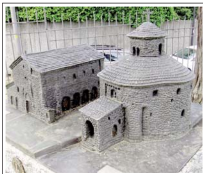
SANT VICENÇ DE GALIANO i baptisteri. Cantú.