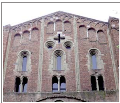
SAN PIETRO IN CIELO D'ORO. Pavia