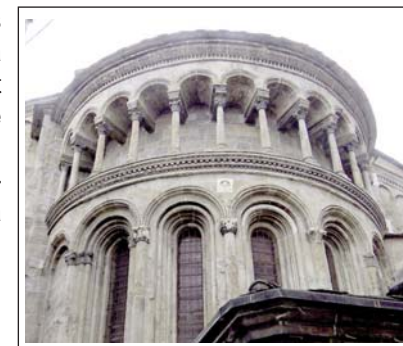
SANTA MARIA LA MAJOR. Bèrgam.

Ciutat de poc més de 100.000 habitants, a la riba del Po just al lloc on rep les aigües del Trebbia. No és Llombarda, sinó que correspon a la regió d'Emília-Romanya. Ciutat d'art, plena de monuments i edificis de gran valor. Als principals llocs hi han treballat grans mestres com Willigelmo, a través de l'arquitectura i les decoracions romàniques que queden a les esglésies de San Antonino , San Savino i del Duomo , d'estil romànic.