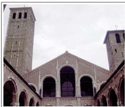
BASÍLICA DE SANT AMBRÓS DE MILÀ.

Situada dalt d'un turó fortificat hi ha la ciutat antiga de Bèrgam, a la qual s'accedeix molt bé amb un funicular. És envoltada per les majestoses muralles venecianes que porten més de 500 anys protegint el casc històric dels invasors i del pas del temps. Destaquen la Piazza Vecchia , amb la preciosa font Contarini de l'època de la dominació veneciana, la Torre