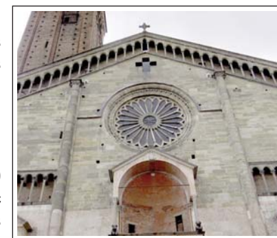
CATEDRAL DE PLASÈNCIA.