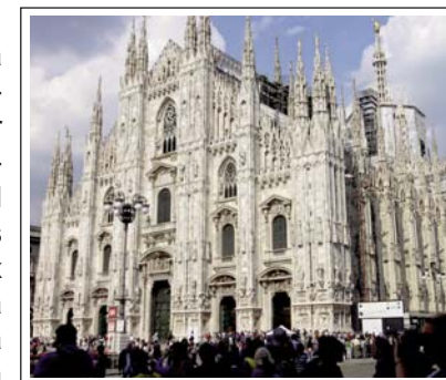
CATEDRAL DE MILÀ.

Ciutat situada al cor de la Llombaria i que avui dia és un dels majors centre financers i culturals d'Itàlia. Destaquem la plaça del Duomo , on podem meravellar-nos de l'estructura exterior d'aquesta enorme catedral gòtica i del seu interior, amb un aspecte estilitzat i ampli gràcies a les llargues columnes de marbre amb estàtues tallades que arriben fins al sostre. Durant el nostre recorregut, visitarem la basílica de San Ambrosio . De fundació paleocristiana (segle IV), que va ser reconstruïda al segle XI amb estil romànic llombard i es va convertir en el model per totes les esglésies que es van construir posteriorment al mateix estil. Tot i que durant el transcurs de la guerra va sofrir grans danys, aquesta basílica és un temple que conserva a la perfecció el seu antic i cridaner aspecte.