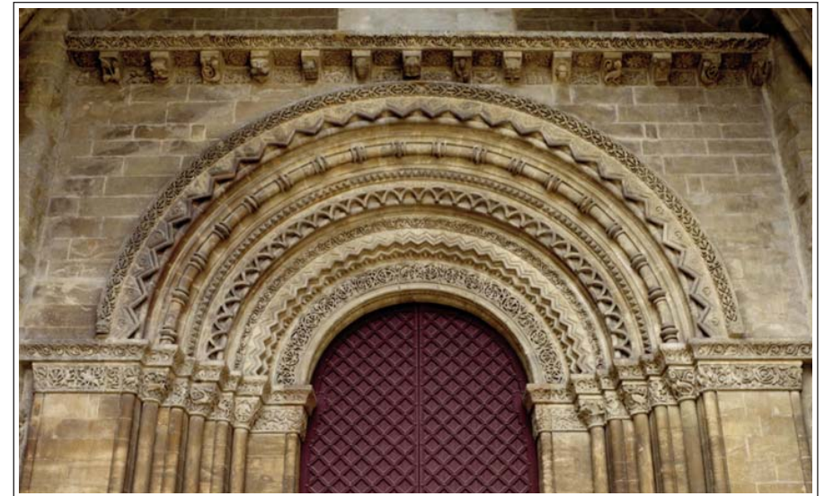
LA SEU VELLA. LLEIDA. Porta dels Fillols.

El tercer, entre els anys 1240 i 1250, se'l relaciona amb l'església de Sant Pere de Fraga. L'estil correspon a la transició del romànic al gòtic. Destaquen les escenes bíbliques, la decapitació de Santa Julita i uns aiguaders.