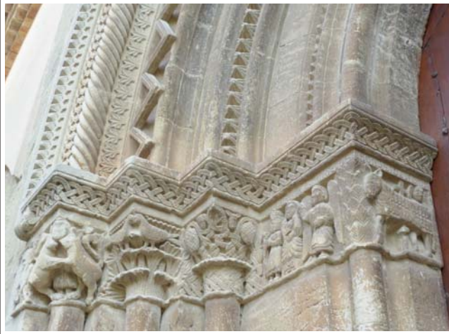
SANTA MARIA DE VILAGRASSA. Detall de la portaladada.

La primitiva església romànica, ja està documentada als segles XI i XII. Molt més endavant s'enderrocà i se n'aixecà una de nova. La portada romànica es desmuntà i fou traslladada a la façana nord de la nova, on encara es troba. Està datada a la segona meitat del segle XIII i és un bell exemple de l'Escola de Lleida. És d'arc de mig punt amb tres arquivoltes en gradació, decorades amb motius geomètrics i vegetals (figures rombals, sogues, palmetes, ziga-zagues, etc.) i un guardapols amb puntes de diamant i una sanefa perlejada. A la línia de les impostes hi ha unes cintes entrellaçades i perlejades que surten de