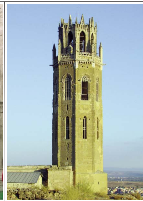
LA SEU VELLA. LLEIDA. CAMPANAR.