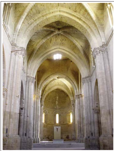
LA SEU VELLA. LLEIDA. Nau central.

L'edifici és romànic de transició, barreja elements romànics i gòtics. Originàriament tenia una planta basilical de creu llatina, de tres naus de només tres trams, coberts amb voltes de creueria. Posteriorment s'hi afegiren diverses capelles. La separació de les naus i els trams és per mitjà d'arcs torals i formers sostinguts per pilars cruciformes amb semicolumnes adossades. Els seus