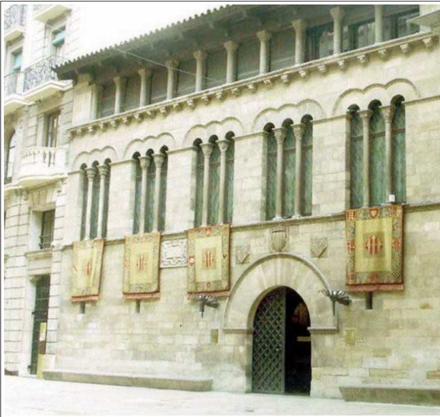
LA PAERIA. LLEIDA. Façana principal.

Està situat al cim d'un turó. El seu origen és musulmà, del segle IX. Després de la conquesta cristiana del 1149, molt aviat rebé una primera reforma. En el segle XIII, s'hi efectuà la segona, molt important, perquè Jaume I el convertí en un palau reial. Encara se'n realitzà una darrera al XIV. De l'època musulmana només en resten alguns vestigis. A partir del segle XV, passà a ser una caserna i patí un seguit de destruccions, a causa de les guerres. Els estudis realitzats indiquen que tenia una planta trapezoïdal allargassada i quatre ales envoltant un pati central. La porta principal