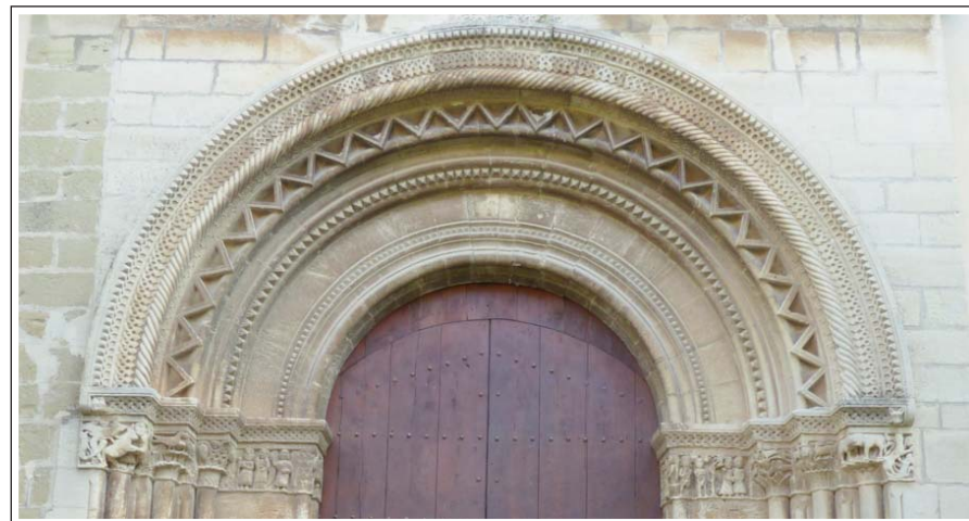
SANTA MARIA DE VILAGRASSA. Portada.

Al costat de la plaça de la Paeria hi havia el call jueu i més enllà l'aljama musulmana. En el segle XV, a causa de la seva expulsió, s'efectuaren molts enderrocs i noves construccions. D'ambdós barris, només en resta el traçat dels carrers.