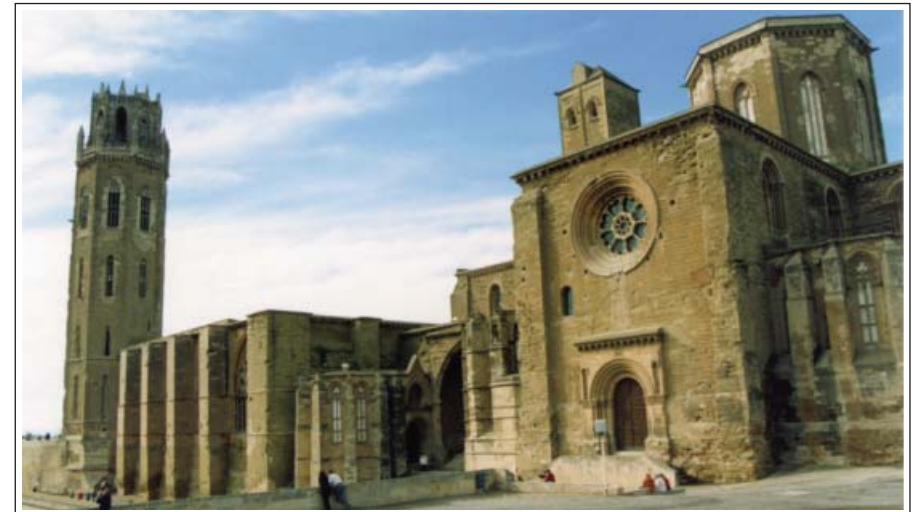
LA SEU VELLA. LLEIDA. Façana sud i campanar.

Els primers assentaments de la ciutat foren al puig del Castell, formació rocosa que té la forma de tres graons: la Roca Sobirana on hi ha la Suda, la Mitjana on es bastí la Seu Vella i la Roqueta. El lloc ja fou un important poblat ibèric dels ilergets. Després, va ser ocupat successivament