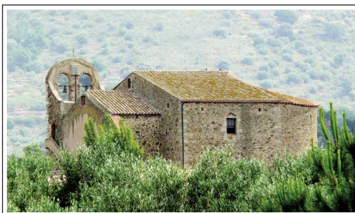
SANT FELIU DE VILAJUÏGA

La nau romànica de l'església de Sant Feliu de Vilajuïga actualment fa de vestíbul a l'església parroquial de la població, edificada durant els segles XVIII, XIX. La nau és coberta amb volta de canó una mica ultrapassada, reforçada per dos arcs torals. A les