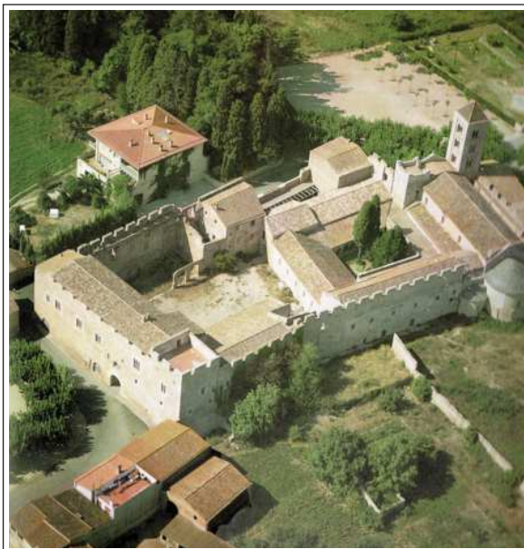
SANTA MARIA DE VILABERTRAN. Podem veure els diferents àmbits que conformen aquest monestir.

Abans que no es fundés la canònica hi havia, en aquest indret, una església preromànica dedicada a Santa Maria. L'església actual és situada al nord del claustre, és de planta basilical i té les mateixes característiques que les esglésies d'aquest tipus empordaneses. La seva datació correspon als segles XI-XII. En canvi el claustre és d'un segle més tard, XII-XIII, de planta trapezoïdal i amb capitells decorats amb uns senzills motius vegetals. A la façana de ponent hi ha el portal gòtic inacabat i tres finestres romàniques que donen a cada una de les tres naus. El campanar dona un toc singular al conjunt, és de torre, de planta quadrada i té tres pisos amb finestres geminades de columna i arcs llombards.