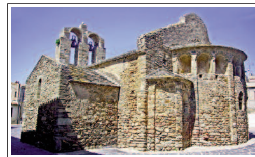
SANT JOAN DE PALAU-SAVERDERA

L'església de Sant Joan-saverdera és al sector oest del poble de Palau-saverdera. És un bonic temple romànic del segle XI, de tres naus cobertes amb voltes, tres absis semicirculars bellament decorats amb estil llombard. Sorpren la grandària de les arcuacions cegues de l'absis central.