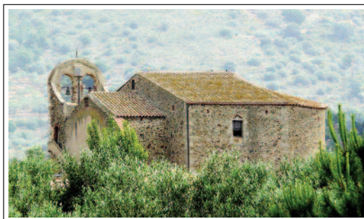
SANT FELIU DE VILAJUÏGA

La nau romànica de l'església de Sant Feliu de Vilajuïga actualment fa de vestíbul a l'església parroquial de la població, edificada durant els segles XVIII, XIX. La nau és coberta amb volta de canó una mica ultrapassada, reforçada per dos arcs torals. A les