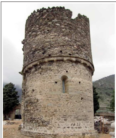
SANT SEBASTIÀ DE LA SELVA DE MAR.

L'edifici de l'església de Sant Sebastià, edificada durant el segle XII, és estrany perquè al segle XIV s'hi construï al damunt una fortificació amb merlets i sageteres que en va doblar l'alçada original. És d'una sola nau, amb volta de canó una mica apuntada i capçada per un absis. El portal té tres arcs de mig punt esglaonats. A l'interior hi ha una pica baptismal decorada que té l'aparença de romànica però és dels segles XIII o del XIV.