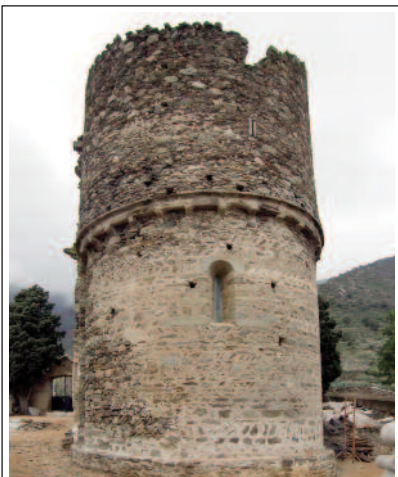
SANT SEBASTIÀ DE LA SELVA DE MAR.

L'edifici de l'església de Sant Sebastià, edificada durant el segle XII, és estrany perquè al segle XIV s'hi construï al damunt una fortificació amb merlets i sageteres que en va doblar l'alçada original. És d'una sola nau, amb volta de canó una mica apuntada i capçada per un absis. El portal té tres arcs de mig punt esglaonats. A l'interior hi ha una pica baptismal decorada que té l'aparença de romànica però és dels segles XIII o del XIV.