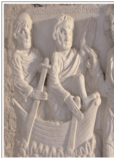
SANT PERE DE RODES. Fragment que es conserva procedent del portal esculpit pel Mestre de Cabestany.

El claustre és elevat, respecte de l'església i posterior a la seva construcció, però també és romànic. Per les excavacions que s'hi van fer se sap que n'hi havia hagut un altre a sota de més reduït. Té quatre galeries porxadades molt reconstruïdes. Dels quaranta-quatre capitells que tenia només tres hi són presents. Al voltant del claustre hi ha força vestigis de les dependències monacals.