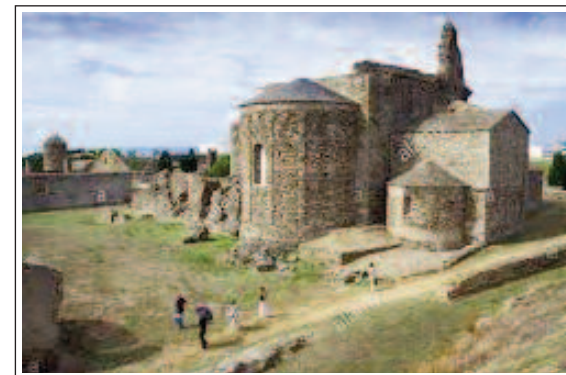
SANTA MARIA DE ROSES.

Ja hem dit que el primer document on es parla d'aquesta església és de l'any 944. Setze anys més tard Santa Maria es va convertir en monestir i s'independitzà de Sant Pere de Rodes al qual pertanyia. L'any 1053 es va consagrar un nou temple, que és el que podem veure avui. Al seu entorn es formà un petit poble que en depenia i a mitjan segle XI s'envoltà tot plegat amb una muralla que dos anys més tard s'amplià en haver crescut molt el poblet. El monestir entrà en decadència a partir del segle XV i va ser abandonat a finals del XVIII.