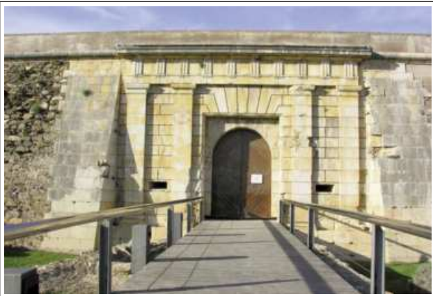
CIUTADELLA DE ROSES.

El 1544 s'inicia la construcció de la ciutadella, per protegir el país dels france-