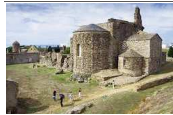
SANTA MARIA DE ROSES.

Ja hem dit que el primer document on es parla d'aquesta església és de l'any 944. Setze anys més tard Santa Maria es va convertir en monestir i s'independitzà de Sant Pere de Rodes al qual pertanyia. L'any 1053 es va consagrar un nou temple, que és el que podem veure avui. Al seu entorn es formà un petit poble que en depenia i a mitjan segle XI s'envoltà tot plegat amb una muralla que dos anys més tard s'amplià en haver crescut molt el poblet. El monestir entrà en decadència a partir del segle XV i va ser abandonat a finals del XVIII.