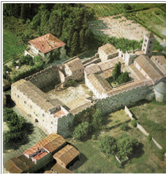
SANTA MARIA DE VILABERTRAN. Podem veure els diferents àmbits que conformen aquest monestir.

Abans que no es fundés la canònica hi havia, en aquest indret, una església preromànica dedicada a Santa Maria. L'església actual és situada al nord del claustre, és de planta basilical i té les mateixes característiques que les esglésies d'aquest tipus empordaneses. La seva datació correspon als segles XI-XII. En canvi el claustre és d'un segle més tard, XII-XIII, de planta trapezoïdal i amb capitells decorats amb uns senzills motius vegetals. A la façana de ponent hi ha el portal gòtic inacabat i tres finestres romàniques que donen a cada una de les tres naus. El campanar dona un toc singular al conjunt, és de torre, de planta quadrada i té tres pisos amb finestres geminades de columna i arcs llombards.