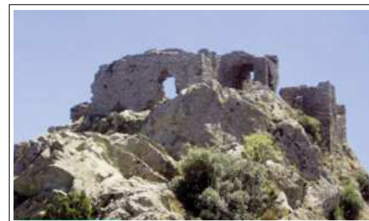
CASTELL DE VERDERA.

El castell de Verdera o de Sant Salvador està situat a sobre del monestir de Sant Pere de Rodes al cim més alt de la serra de Rodes o serra de Verdera, des d'on es divisa una panoràmica espectacular. Igual que el monestir correspon al municipi del Port de la Selva.