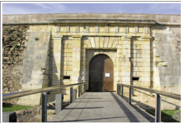
CIUTADELLA DE ROSES.

El 1544 s'inicia la construcció de la ciutadella, per protegir el país dels france-