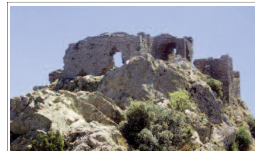
CASTELL DE VERDERA.

El castell de Verdera o de Sant Salvador està situat a sobre del monestir de Sant Pere de Rodes al cim més alt de la serra de Rodes o serra de Verdera, des d'on es divisa una panoràmica espectacular. Igual que el monestir correspon al municipi del Port de la Selva.