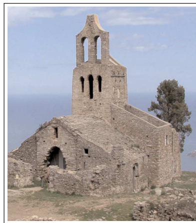
SANTA CREU O SANTA HELENA DE RODES.