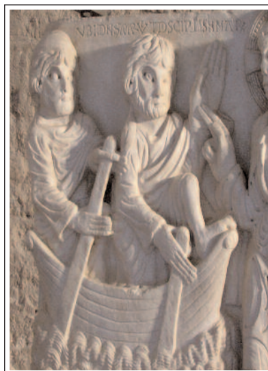
SANT PERE DE RODES. Fragment que es conserva procedent del portal esculpit pel Mestre de Cabestany.

El claustre és elevat, respecte de l'església i posterior a la seva construcció, però també és romànic. Per les excavacions que s'hi van fer se sap que n'hi havia hagut un altre a sota de més reduït. Té quatre galeries porxadades molt reconstruïdes. Dels quaranta-quatre capitells que tenia només tres hi són presents. Al voltant del claustre hi ha força vestigis de les dependències monacals.