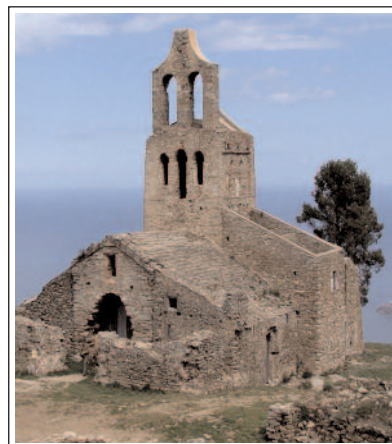
SANTA CREU O SANTA HELENA DE RODES.