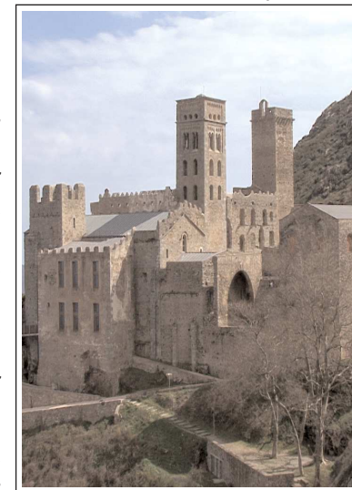
MONESTIR DE SANT PERE DE RODES

L'església és un edifici molt alt amb una nau central i dues de laterals molt estretes, amb creuer i tres absis; el central