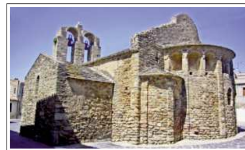
SANT JOAN DE PALAU-SAVERDERA

L'església de Sant Joan-saverdera és al sector oest del poble de Palau-saverdera. És un bonic temple romànic del segle XI, de tres naus cobertes amb voltes, tres absis semicirculars bellament decorats amb estil llombard. Sorpren la grandària de les arcuacions cegues de l'absis central.