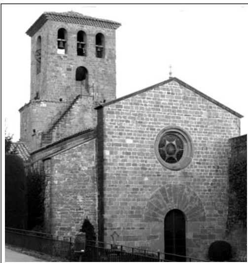
SANTA MARIA DE L'ESTANY. Església. Foto: Lluís Fernàndez, 2009.

fou cedida a la seu de Vic, que hi establí una canònica. Les notícies de la comunitat són constants a partir del 1080. La dignitat abacial és a partir del 1113, i tingué una vida pròspera fins a meitat del segle XIV, amb una gran extensió de dominis, principalment a la part central de Catalunya. La pesta negra i les disputes sobre la propietat feudal foren causa de la destrucció del monestir el 1395. La comunitat hagué d'exiliar-se passant a residir, durant una quarantena d'anys, a Manresa i a Sabadell. Finalment reintegrada a l'Estany, és novament afectada, ara pels terratrèmols del 1448, que ocasionaren la caiguda del campanar sobre la volta de l'església, destruint-la. La recuperació fou lenta i difícil i la decadència motivà la supressió de l'abadiat el 1592, convertint-se en una canònica, que fou extingida l'any 1775 a partir del qual restà com a simple parròquia.