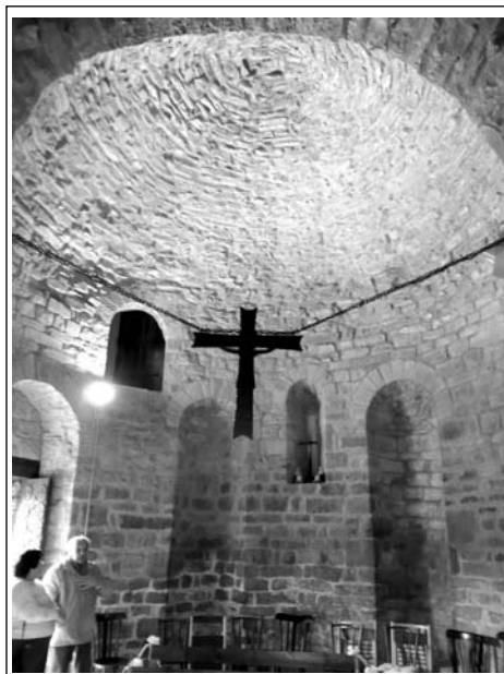
SANT JAUME DE VILANOVA. Interior, des de l'altar. 2009.

Es tracta d'una capella de planta circular, amb un petit absis a la banda de llevant. L'absis, amb una finestra de doble esqueixada al centre està decorat externament amb arcuacions i bandes llombardes, mentre la resta de l'edificació no té decoració. L'interior, amb uns cinc metres de diàmetre, té quatre fornícules obertes en el gruix del mur, i una bonica cúpula amb forma de mitja esfera, amb les filades de pedra disposades en forma d'espiral. L'entrada, simple arc adovellat, s'obre orientada a migdia, com de costum en esglésies romàniques. Sorpren, interiorment, la lleugeresa de l'edifici, malgrat que els murs tenen més d'un metre de gruix.