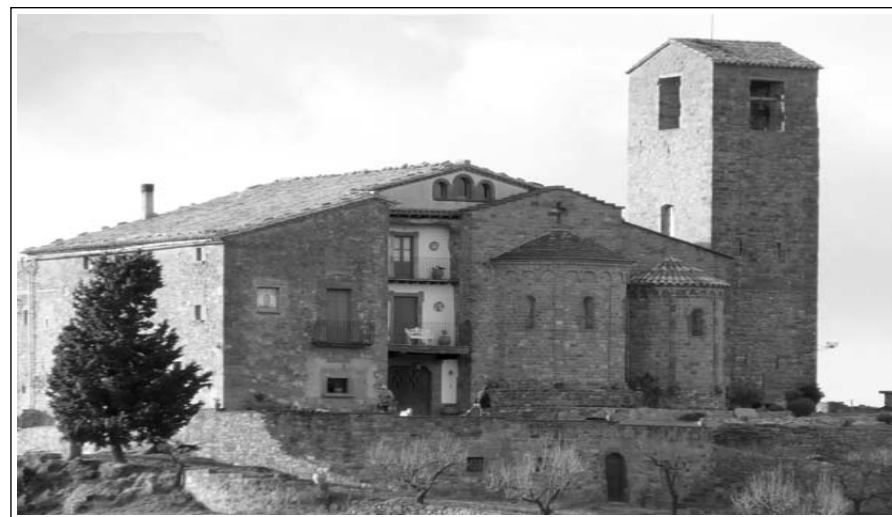
SANT FELIUET DE TERRASSOLA, AMB LA GRAN RECTORIA ADOSSADA. Foto: Lluís Fernández, 2009.

SITUACIÓ DE L'ESGLESIA DE SANT SALVADOR DE SABADELL AMB RELACIÓ A L'ESGLÉSIA DE SANT FÉLIX ACTUAL. Il·lustració que acompanya un article de Lluís Mas a Nostra Comarca, butlletí del Centre Excursionista del Vallès de l'abril-maig-juny de 1931.