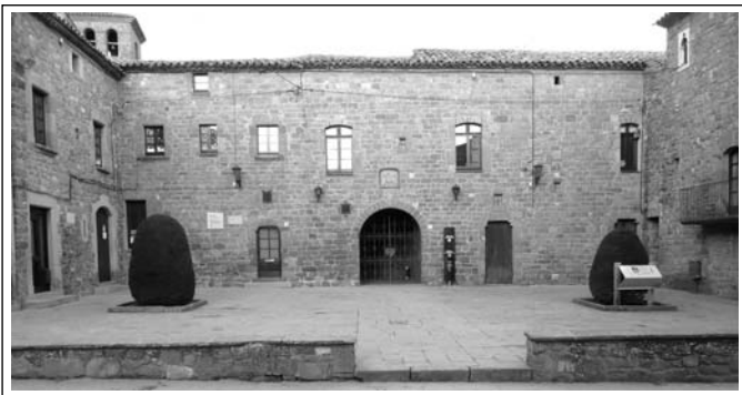
SANTA MARIA DE L'ESTANY. Aspecte actual de l'edifici per on s'accedeix al claustre, al museu i a l'arxiu.

L'església és la consagrada el 1133, amb una nau, transsepte i tres absis, amb un cimbori sobre la unió de la nau amb el creuer. Tres arcs torals sostenen la volta. Un altre arc, a l'entrada del presbiteri està basat amb columnes semicirculars, amb capitells i bases escultrades. En els segles XVII i XVIII es construeix una sagristia derruint l'absis lateral sud, es construeix el cimbori (derruït pel terratrèmol), es fa una falsa volta de maó i es decora amb un altar barroc. Amb les reformes dels anys 1970 i 1971 l'església retorna al seu estil primitiu. Cal remarcar la bonica imatge d'abastre de Santa Maria, d'estil gòtic, datada, probable-