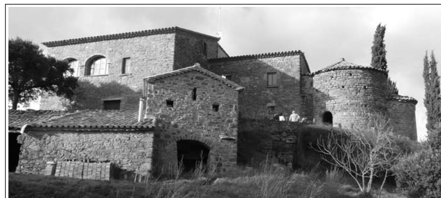
MAS VILANOVA D'OLÓ. Adossada a la dreta l'església rodona de Sant Jaume.