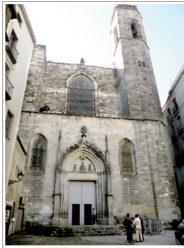
SANT JUST I PASTOR. Façana principal.

De l'època romànica tenim els documents dels anys 966, 1040, 1053 i 1079 que parlen de l'església. Es bastí damunt de les primitives. Constava del temple, el cementiri - amb dues capelles vinculades, la de Sant Celoni i la de Sant Fèlix- i la sagrera. El temple era de planta basilical, amb tres naus, capçades per tres absis semicirculars i a l'entrada hi havia una galilea. Tenia adossada la capella de Sant Fèlix. La capella de Sant Celoni era exempta, d'una sola nau capçada per un absis semicircular, aprofitat del temple del segle VI.