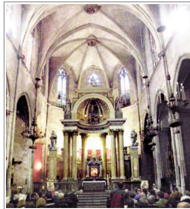
BASÍLICA DE SANT JUST I PASTOR. Interior.

Es varen efectuar tres campanyes d'excavacions arqueològiques. Malgrat que per la construcció de l'actual basílica s'aprofitaren alguns murs antics com a fonaments i l'autorització de poder emprar pedres procedents de la demolició, encara s'hi han pogut