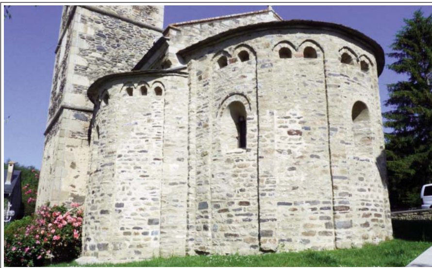
SANT MARTÍ D'UR. Absis.

L'església de Sant Martí s'alça en un extrem de la població d'Ur, de 358 habitants, situada a uns 4 km de Puigcerdà. Havia format part de les pos-