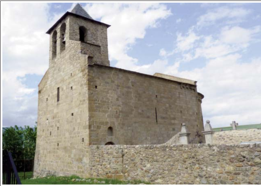
SANT MARTÍ D'IX. Vista des del sud-oest.

que recorre l'absis, i que descansa sobre mènsules, unes de llises i les altres amb relleus. La resta de l'església, la que correspon a la segona etapa, és molt més modesta, amb les finestres sense ornament, un portal molt senzill i un campanar que originàriament era de cadireta de dos ulls, que posteriorment s'hi varen afegir parets i es transformà en un campanar de torre.