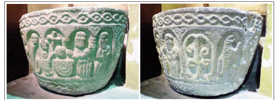
PALAU DE CERDANYA. Pica baptismal.

Palau de Cerdanya és una població de 460 habitants, situada a 5 km de Puigcerdà. L'església centra la població. En origen era romàni-