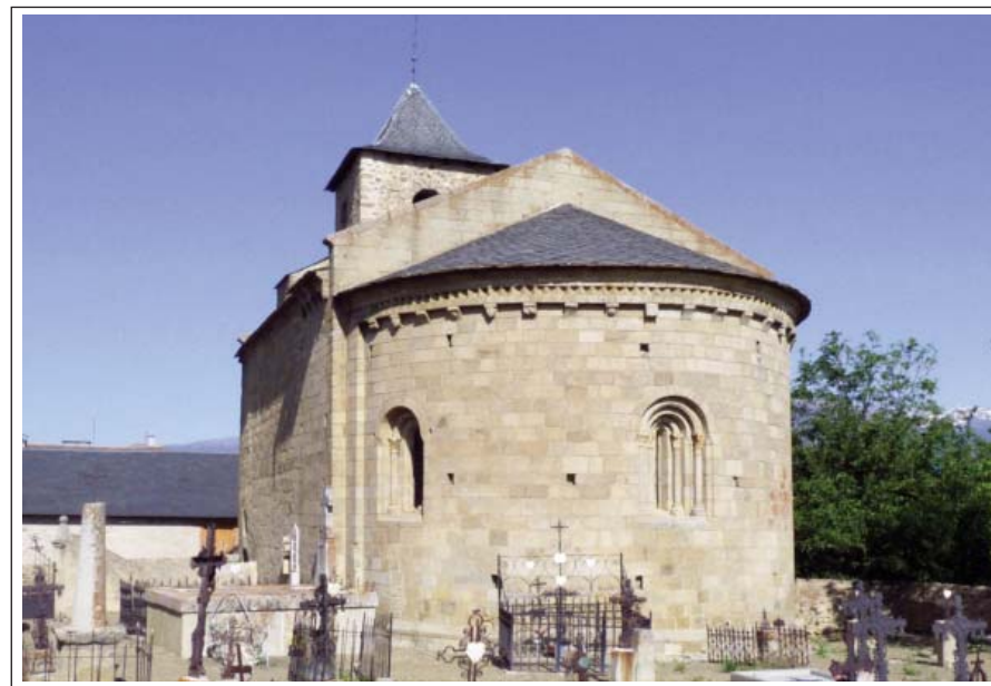
SANT MARTÍ D'IX. Absis

És d'una sola nau amb absis semicircular i volta apuntada, i presenta diverses etapes de construcció. La part més antiga és la de la capçalera, "denota que el projecte corresponia a un edifici força ambiciós [...] que pel motiu que fos es va aturar" –llegim a Les Guies de la Catalunya Romànica – És també la part més ben decorada, amb dues boniques finestres amb arcs sostinguts per columnetes i capitells esculpits, i un fris de dents de serra,