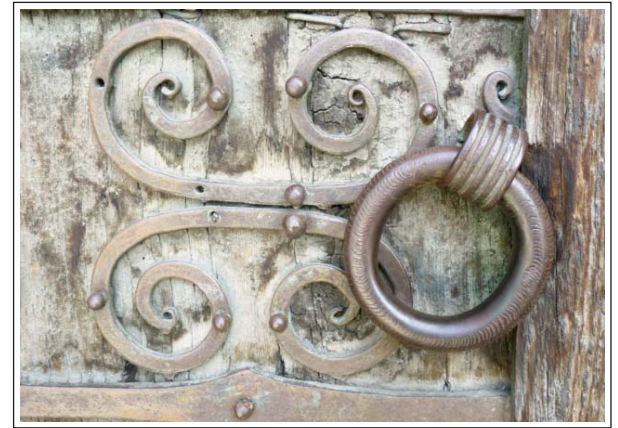
SANT MARTÍ D'UR. Detall de la ferramenta de tradició medieval del portal

Temple d'una nau amb una bonica capçalera, orientada al nord-est en lloc de a l'est. És edificada durant el segle XII, però molt modificada el XVIII. D'aquesta última reforma són el campanar, les capelles laterals i el portal. En canvi els batents de la porta conserven la ferramenta de tradició clarament medieval.