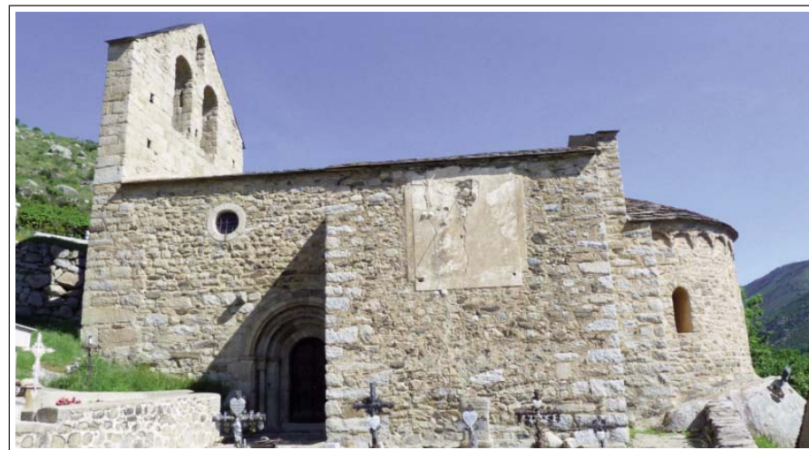
SANT ANDREU D'ANGOSTRINA.

Església situada en un lloc alterós, presidint la població d'Angostrina, que juntament amb Vilanova de les Escaldes formen un sol municipi, situat a 6,5 km de Puigcerdà. Els primers escrits que parlen de l'església daten de finals del segle X.