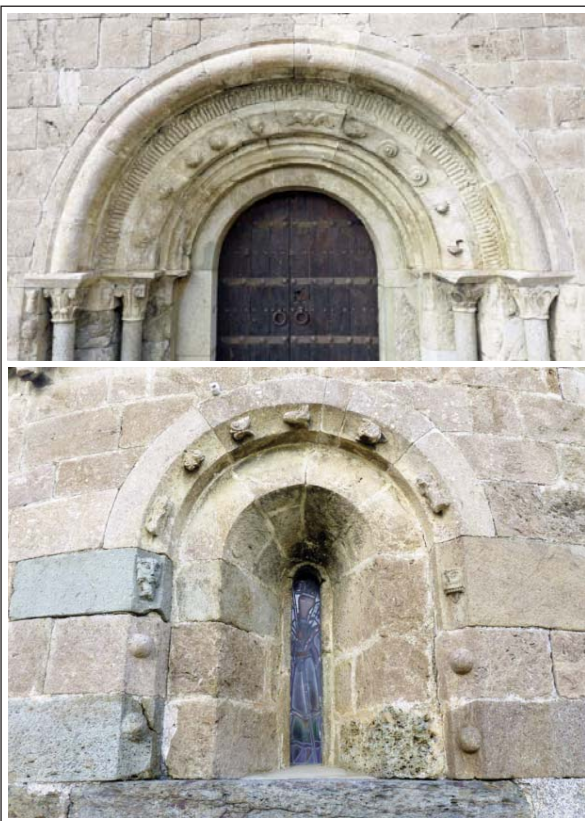
SANT FRUCTUÓS DE LLO. Detalls de les escultures del portal i de la finestra central de l'absis

Església que havia estat lligada, a Cornellà de Conflent i a la Seu d'Urgell. El primer escrit on apareix el seu nom és del segle X. Consta d'una sola nau, amb volta apuntada, un absis semicircular de poc radi i unes capelles laterals que foren construïdes en època moderna. El portal, que és la part més interessant del conjunt, és al mur sud, amb arcs en gradació sostinguts per dos parells de columnes amb capitells esculpits. Tant la decoració esculpida dels capitells, com la de les arquivoltes mostra formes geomètriques i vegetals, si més no, curioses. Les finestres originals, dues al mur sud i una a l'absis, són de doble esqueixada. El campanar és d'espadaña de dos nivells i amb dos ulls, amb arcs de mig punt.