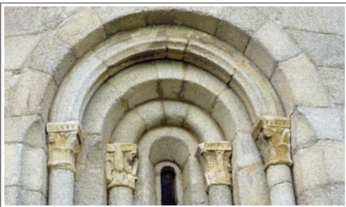
SANT MARTÍ D'IX. Detall de la finestra central de l'absis.

que recorre l'absis, i que descansa sobre mènsules, unes de llises i les altres amb relleus. La resta de l'església, la que correspon a la segona etapa, és molt més modesta, amb les finestres sense ornament, un portal molt senzill i un campanar que originàriament era de cadireta de dos ulls, que posteriorment s'hi varen afegir parets i es transformà en un campanar de torre.