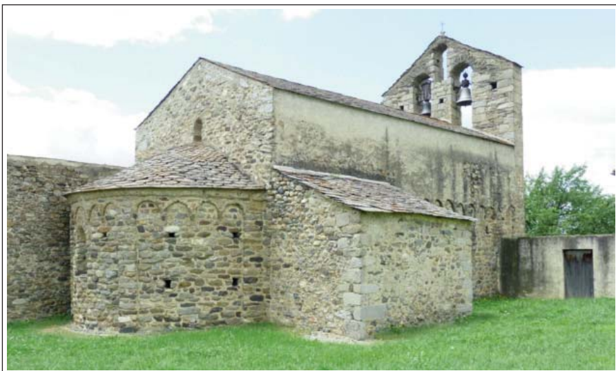
SANT ROMÀ DE CÀLDEGUES.

L'església parroquial de Sant Romà és del segle XI, d'una sola nau, que va ser sobrealçada el segle XVIII. L'absis és semicircular i ornat, a l'exterior, amb lesenes i arcuacions llombardes. L'interior va ser decorat, durant el segle XIII, amb unes pintures murals on, a la volta, es pot veure el Crist en majestat, voltat del Tetramorf i sota seu diverses escenes com, la Crucifixió, el Davallament i un cavaller amb un falcó.