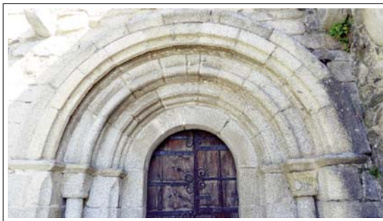
SANT ANDREU D'ANGOSTRINA. Portal.

L'església data del segle XI i és molt reconstruïda. Originàriament era d'una sola nau, amb volta apuntada, capçada per un absis semicircular, amb volta de quart d'esfera. El portal, amb tres arcs semicirculars, amb gradació, s'obre a la façana sud a sota d'un campanar de paret de dos ulls. A l'interior es conserven restes de pintures medievals del segle XIII. De la part visible es pot veure, al registre superior, una representació de la Santa Cena i al registre inferior una dels mesos de l'any amb els treballs que s'hi relacionen. També es conserva, a l'interior del temple, un frontal d'altar procedent de l'església propera de Sant Martí d'Envalls, on hi ha un santcrist en majestat i escenes de la vida de Sant Martí.