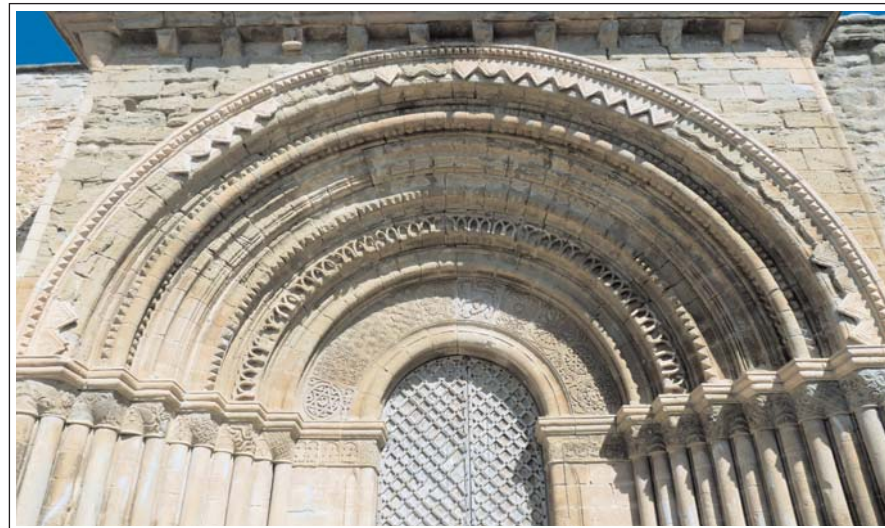
SANTA MARIA DEL CASTELL DE CUBELLS. Espectacular portada de l'escola lleidatana.

De l'edifici romànic ens interessa, especialment l'espectacular portal, que sobresurt del mur de la façana. És de mitjan segle XIII, d'influència