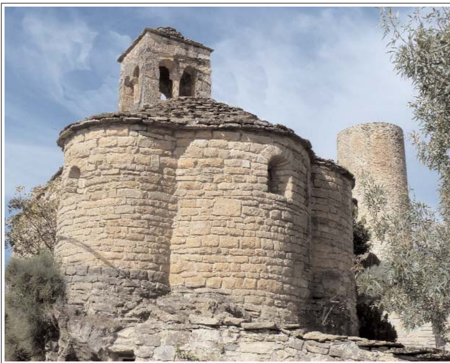
SANT BARTOMEU DE LA BARONIA DE SANT OÍSME. Absis. Darrere, a la dreta, la torre del castell.

La part principal que es conserva del castell és una torre circular, totalment restaurada, que data del segle XI. Té una alçada de 14 m, un diàmetre de 2,7 m i el gruix del mur de 1,5 m. La porta és a uns 4 m. de terra. És amb arc de mig punt i orientada al sud. Hi ha una altra obertura a uns 8 m. encarada al sud-oest que probablement servia per accedir a una plataforma de fusta exterior. Segurament tenia diferents sostres que la dividien i formaven pisos, els quals avui han desaparegut. Una escala de ferro permet actualment de pujar fins dalt i poder observar l'extraordinari entorn.