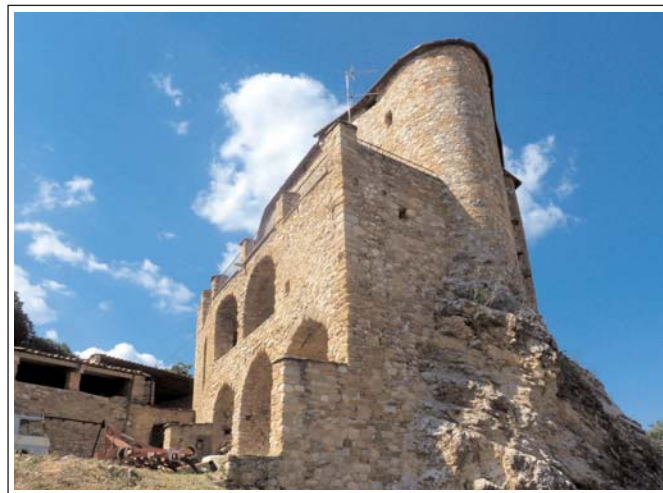
MOROR. CASA SANUI. Construcció que recorda el castell de Mur.

Destaca també, en un extrem del poble, sobre mateix de la carretera entre la Guàrdia de Noguera i Sant Esteve de la Sarga, la Casa Sanui, molt gran, construïda damunt la roca viva que recorda el castell de Mur.