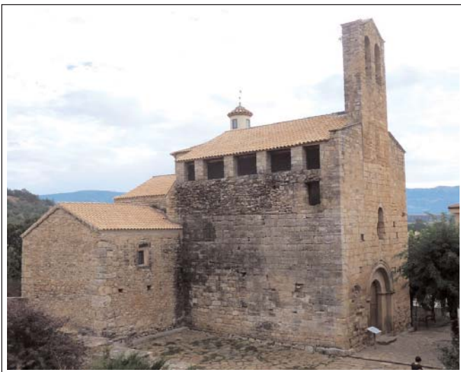
SANT MIQUEL DE CONQUES. Nau romànica amb ampliacions i sobrealçat d'època barroca. Sota l'espadaña actual s'endevina la primitiva.

Una de les transformacions que es varen fer en època barroca va ser sobrealçar la nau. Així quedà absorbit el campanaret d'espadaña, del qual encara es veuen les traces i n'edificaren un de nou al damunt. També es construï una bonica capella, la del Sant Crist, que va ser destruïda durant la Guerra i ara ha estat reconstruïda de nou.