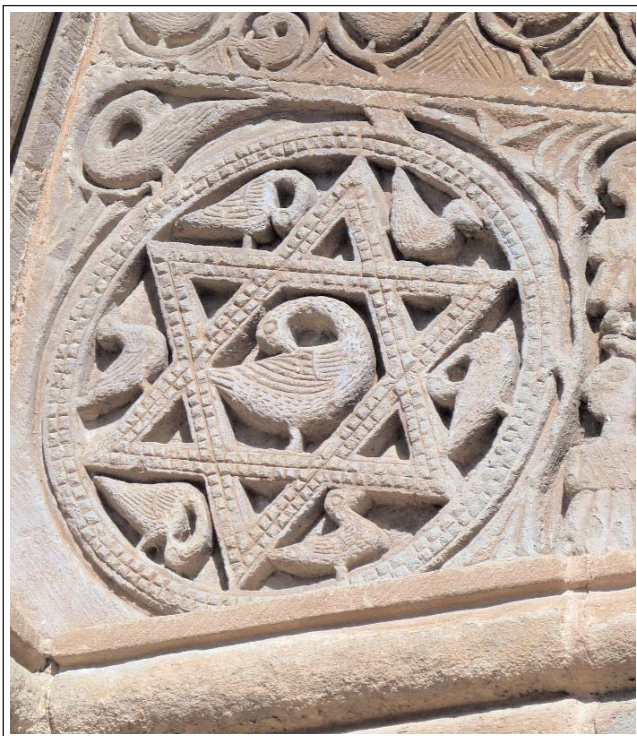
SANTA MARIA DEL CASTELL DE CUBELLS. Detall de l'ornamentació del portal, amb tots els espais esculpits.

Gran Geografia Comarcal de Catalunya, volums 10, 12 i 19. Catalunya Romànica, vol. XV Guies de la Catalunya Romànica, vol. XVII.