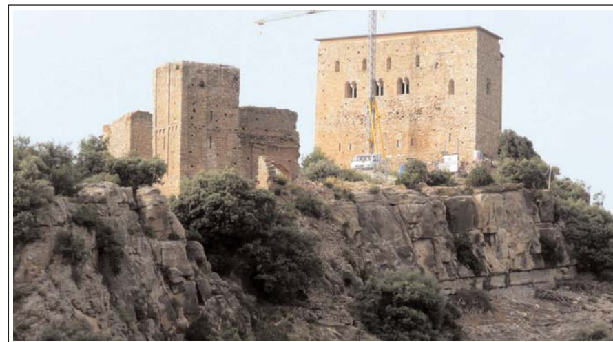
CASTELL DE LLORDÀ. Davant, restes de l'església amb la torre del campanar escapçada. A la dreta el gran casal residencial que fou la residència d'Arnau Mir de Tost.

És situat en un lloc estratègic del municipi d'Isona i Conca d'Allà, damunt del poblet de Llordà. Es tenen notícies d'aquest castell i de la seva església, d'ençà del segle X. Fou residència d'Arnau Mir de Tost, del comtat d'Urgell, encarregat de la conquesta, repoblació i domini del Pallars Jussà. Va ser