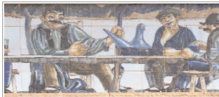
EL PINELL DE BRAI. CELLER MODERNISTA. Detall del fris de rajoles.

La vila actual va ser fundada pels àrabs al voltant del castell i repoblada després de la seva conquesta per Ramon de Montcada el 1222. Era un