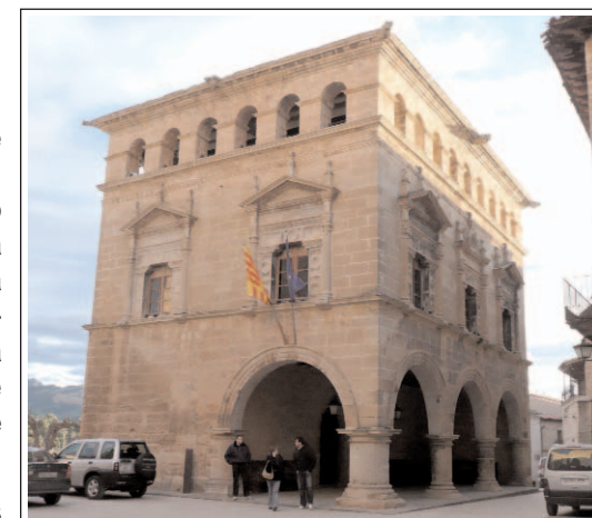
ARNES. AJUNTAMENT I LLOTJA.

La formació de la vila es pot situar a la segona meitat