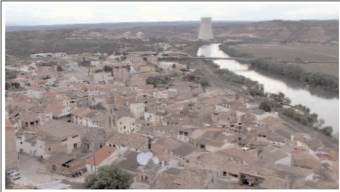
ASCÓ. Panoràmica de la població amb l'aigua de l'Ebre acarant les cases.

Població d'uns 1700 habitants, situada a la meitat de la comarca i a la riba dreta de l'Ebre. El turó on s'esglaiava el poble és coronat per una torre i part d'un parament, que és tot el que en queda del castell medieval. Se la coneix força per les dues centrals nuclears que hi ha instal·lades al terme.