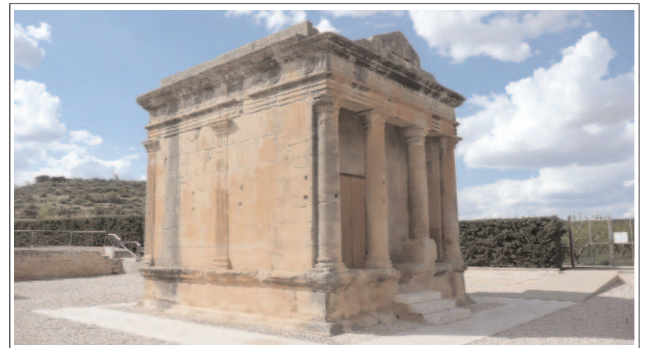
FAVARA. MAUSOLEU ROMÀ. Segle II dC.

Població de la Franja de Ponent, de parla catalana occidental, que pertany a la província de Saragossa. Té uns 1300 habitants, la majoria pagesos o ramaders i alguns artesans del gènere de punt. Cal destacar els edificis de l'antic castell, Lo Graner, avui Ca la Vila, la casa Cervelló i l'església parroquial, dedicada a Sant Joan Baptista, d'estil gòtic català. Va ser fortificada i té un aspecte de fortalesa.