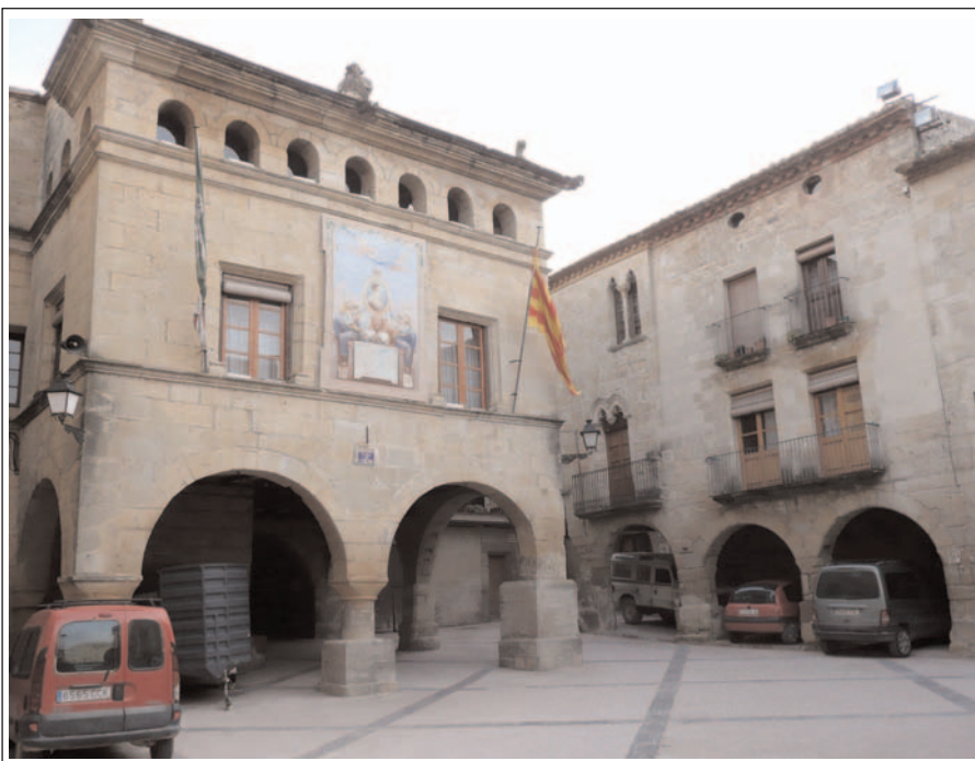
HORTA DE SANT JOAN. Casa de la Vila. Plaça Major..

Població d'uns 1.100 i pocs habitants, situada al sud de la comarca, a 20 km de la capital, Gandesa. La part sud del terme l'ocupa el Parc Natural dels Ports, per la qual cosa el turisme és una de les fonts actuals d'ingressos dels hortencs.