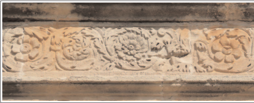
MAUSOLEU ROMÀ DE FAVARA. Detall del fris esculturat de la cara sud.

Però el monument més significatiu de la història de la vila, el que ha fet que la visitéssim, és el mausoleu romà, molt ben conservat, dedicat a Luci Aemili Lupi. Va ser construït el segle II dC. Pertany a una vil·la romana que encara no s'ha excavat. És construït amb grans blocs de pedra sorrenca, sense morter, travats amb peces metàl·liques. La planta és rectangular de 6.85 x 5.94 m. Té l'aparença d'un temple clàssic i és precedit per un pòrtic amb columnes dòriques, que sostenen un entaulament i un frontó. A l'interior la cambra sepulcral és a baix i coberta amb volta de canó, com la planta superior. Es comuniquen per una escala. Els pilars del cos són estriats i el fris és decorat i diferent a cada cara.