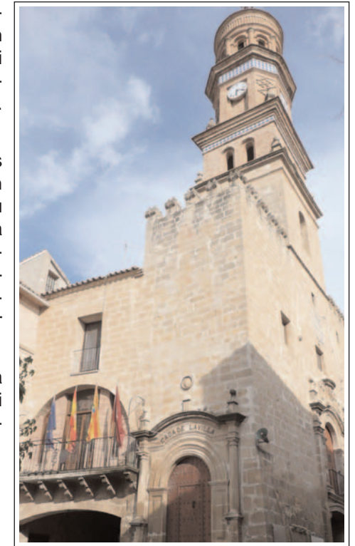
MAELLA. Torre del Rellotge i la Casa de la Vila a sota.

L'edifici de l'antiga Ilotja va ser restaurat modernament i s'hi ha instal·lat algunes dependències municipals.