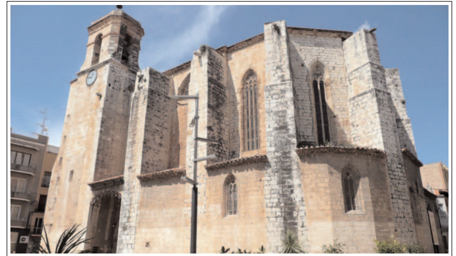
ULLDECONA. Església parroquial de Sant Lluç, situada al centre de la població.

poble quadrangular, amb una plaça Major i envoltada de muralles. Durant el segle XIX va sortir fora muralles i al primer terç del XX tingué l'expansió definitiva. Dins del nucli urbà destaca l'església de Sant Lluç, un temple gòtic que substituï l'antiga església romànica del segle XIII, el Convent de Sant Domènec, seu de la Casa de la Vila, l'Església del Roser, avui Casa de Cultura, la Casa de la Filigresa, l'Orfeó i el molí de l'Oli.