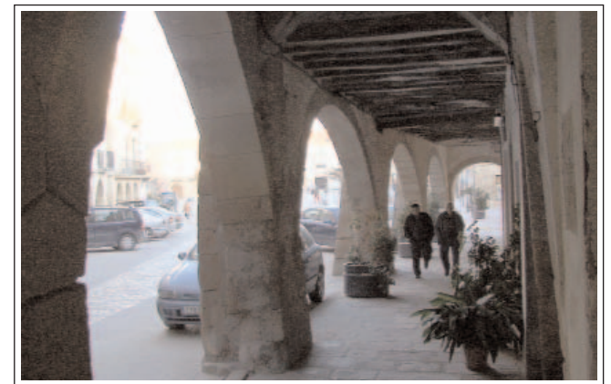
BATEA. Porxos de la Plaça Major.

La població actual conserva un regust medieval admirable, amb gran