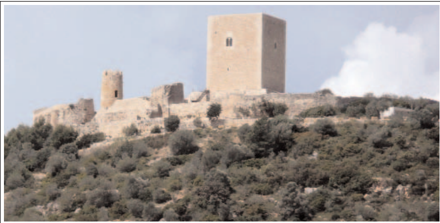
ULLDECONA. CASTELL. Muralles, torre Quadrada, torre rodona i a l'esquerra, l'església.

tercer hi ha la sala noble, amb quatre obertures que coincideixen amb els punts cardinals. Destaca una finestra coronella amb columna i capitell.