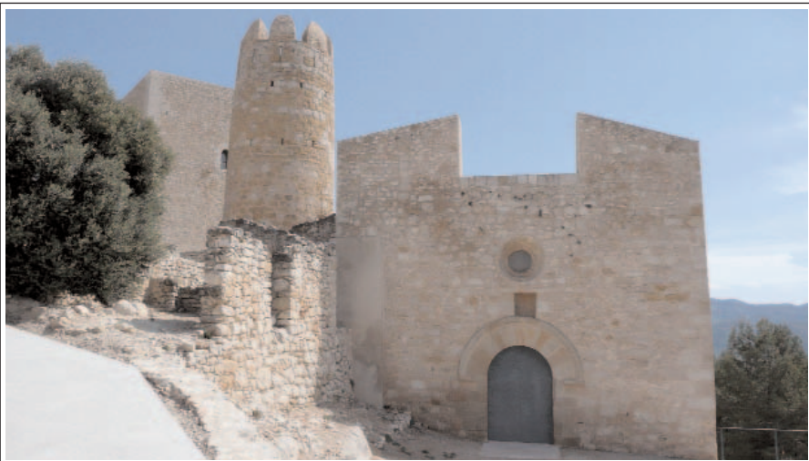
ULLDECONA. CASTELL. D'esquerra a dreta, torre quadrada, torre rodona i església de la Mare de Déu dels Àngels

És esmentada documentalment per primera vegada l'any 1281. És una església d'una sola nau, amb volta de canó amb arcs torals, capçada per un absis semicircular i cobert amb volta de quart d'esfera.