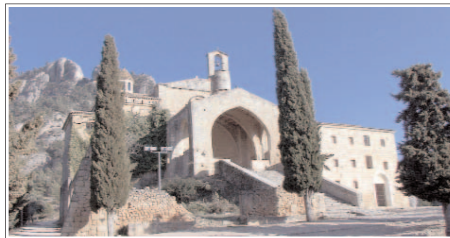
SANTA MARIA DELS ÀNGELS D'HORTA DE SANT JOAN. Coneguda també per Sant Salvador.

La part alta de la població té un aspecte pintoresc amb els carrerons estrets i costeruts, les cases apinyades, portals treballats, dovelles i porxos. A la plaça de l'església, que és tota porxada hi ha la Casa de la Vila, en un edifici renaixentista del segle XVI i l'església de Sant Joan Baptista, d'estil gòtic, amb una sola nau. Altres casals interessants són, la Casa de Manel de Joaquim, la Casa Pessetes, l'Hostal del Pan o la casa de la Comanda, un palau d'estil lleidatà. Cal fer esment també del Centre Picasso, que reuneix reproduccions de totes les obres que el pintor va fer en la seva estada a Horta i l'Ecomuseu dels Ports, un centre d'interpretació general del territori.