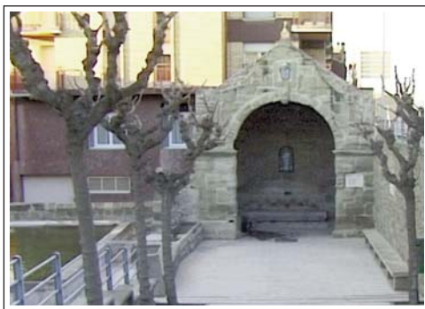
GUISSONA. Font de cinc canelles. A l'esquerra els safaretjos

la part romana. A partir de l'any 732 Guissona forma part de la frontera cristiana i musulmana amb les conseqüents anades i vingudes d'uns i altres. La conquesta definitiva s'esdevé a finals del segle XI. La població és un petit nucli emmurallat entorn d'una torre; l'església queda a fora. A partir del segle següent, s'amplià i encara més tard -segle XIII- es va refer la fortificació.