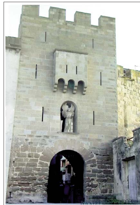
GUISSONA. Portal de l'Àngel.

A partir de la dissolució de l'imperi romà tenim un buit en la història de Guissona. Se sap, però, que la població es redueix i ocupa el lloc del casc antic actual, per sobre de