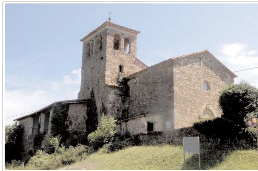
SANT PERE DESPUIG.

El temple és del segle XII i segurament fou bastit damunt del primitiu del X. Inicialment era d'una sola nau, però rebé moltes transformacions. La més