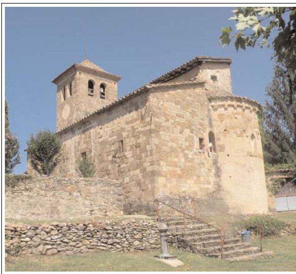
SANTA MARGARIDA DE BIANYA.

Encara que apareix citada en un document dubtós de l'any 858, un dels primers de certs, és el de la consagració, el 1117, de la veïna parròquia de Sant Andreu de Socarrats. A partir del segle XIII, depenia jurídicament del priorat de Sant Joan les Fonts. A la mateixa època, alguns terrenys de la parròquia pertanyien al monestir de Sant Benet de Bages. Juntament amb altres parròquies de la contrada, fou incorporada a la corona l'any 1357, però poc temps després, el 1372, el rei Pere III el Cerimoniós vengué els drets de totes elles, a fi d'afrontar les despeses de la guerra de Sardenya.