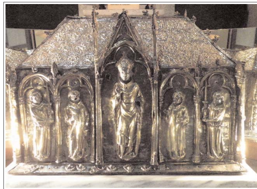
RELIQUIARI DE SANT PATLLERI. Santa Maria de Camprodon.

El temple és del segle XII, però està molt transformat, caldria efectuar prospeccions arqueològiques per esbrinar com era primitivament. L'únic que sabem de cert és que la capçalera, constava d'un absis central i de dues absidioles, semicirculars. Quant a la nau, hi ha dues opcions: planta basilical amb tres naus o un transsepte i una sola nau. La porta d'accés forçosament s'obria al mur sud.