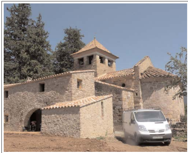
SANT MARTÍ DE SOLAMAL

El temple del segle XII, possiblement bastit damunt de l'anterior, era d'una sola nau capçada per un absis semicircular (ornamentat amb un fris sostingut per mènsules) i amb un campanar d'espadanya coronant la façana de ponent. En aquesta mateixa façana s'obre una senzilla porta de mig punt, coronada per una finestra de doble esqueixada. Al segle XVIII el campanar d'espadanya es fou convertit en un de torre. Moderna-