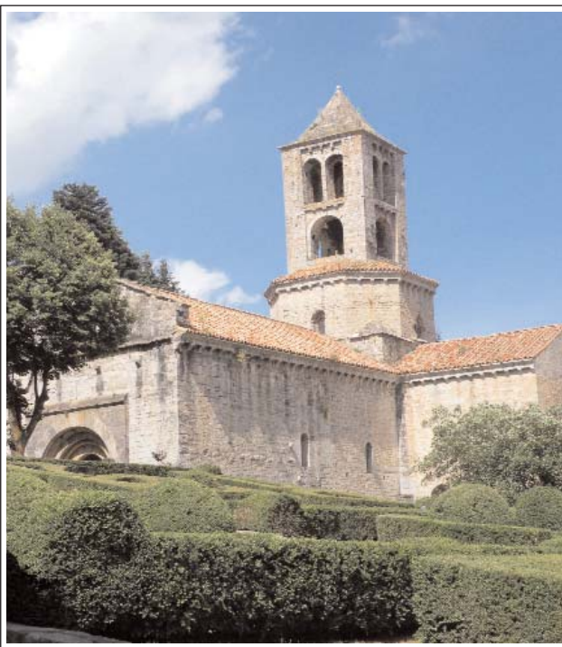
MONESTIR DE SANT PERE DE CAMPRODON

El temple del segle XII, és l'únic vestigi que resta del monestir. Té planta de creu llatina. La nau és coberta amb una volta un xic