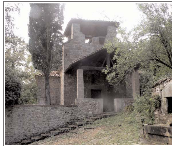
SANT ANDREU DE SOCARRATS.

Hi ha diversos documents, segons els quals els clergues de Socarrats prestaren jurament d'obediència als priors de Santa Maria de Besalú. Vers el 1580, perdé la categoria de parròquia i passà a ser sufragània de la de Sant Joan les Fonts. Finalment, a partir del 1968, passà a ser-ho de la de Sant Josep Obrer, de la Canya.