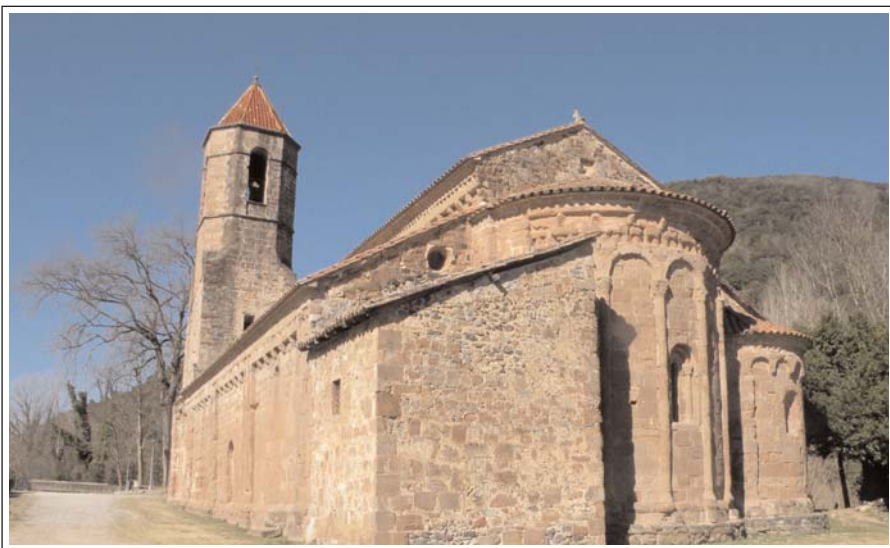
SANT JOAN LES FONTS. Monestir.

L'edifici té una clara influència provençal –estil llombard modificat- però la decoració coríntia dels capitells amb fulles d'acant es autòctona de la zona, sorgida de sant Pere de Rodes. Al seu interior hi ha una magnífica pica baptismal d'immersió, que és de mitjan segle XII, de grans dimensions,