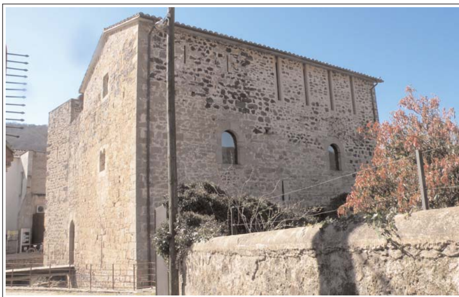
SANT JOAN LES FONTS. CASA FORTA DE JUVINYÀ.

La de Juvinyà, és un dels pocs exemples d'arquitectura civil medieval (romànica - gòtica) que s'han conservat a la Garrotxa. Es bastí en dues etapes: primerament, a finals del segle XII, la torre de defensa de planta quadrada i poc més tard, al seu costat un molí fariner, que eren propietat de