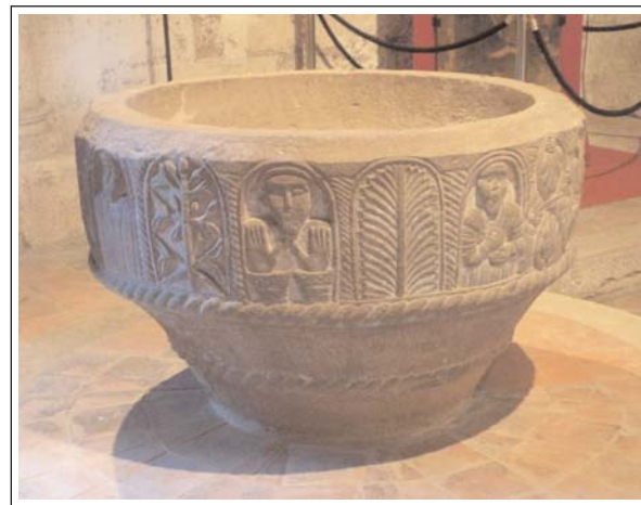
SANT JOAN LES FONTS. Pica baptismals del monestir.

semiesfèrica i decorada amb una sanefa esculpida amb motius vegetals i diverses figures humanes, de les quals només n'hi ha tres d'identificades: el Crist, la degollació de sant Joan Baptista i sant Pere. També hi ha la reproducció -l'original és al Museu d'Art de Girona- d'un Crist en majestat, que hi havia al monestir. És de fusta policromada, del primer quart del segle XII.