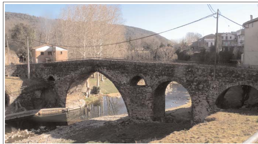
SANT JOAN LES FONTS. Pont medieval.

El municipi és a 4 km d'Olot, està compost per tres nuclis principals: Sant Joan les Fonts, la Canya i Begudà. Forma part del Parc Natural de la Zona Volcànica de la Garrotxa, que té una trentena de cons volcànics, alguns cràters d'explosió i més de vint colades de lava basàltica, que es varen produir entre 700.000 i 10.000 anys aC. Al municipi de Sant Joan les Fonts hi