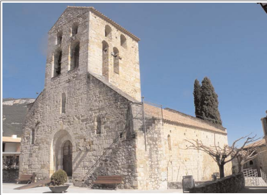
SANT FELIU DE BEUDA.

ta sovint en les deixes dels senyors del castell de Beuda a sant Pere i santa Maria de Besalú. Els anys 1279 i 1280 està en la relació d'esglésies amb rendes pròpies, que estaven obligades a contribuir amb el delme per finançar les croades.