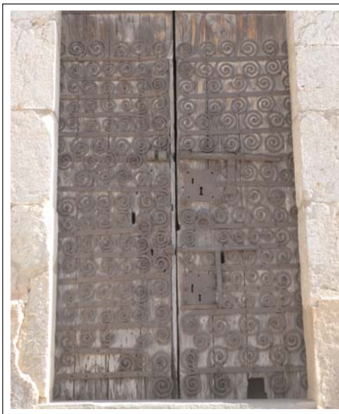
SANT PERE DE MONTAGUT. Porta amb ferramenta romànica.

A l'església hi havia cinc lip-sanoteques, actualment estan repartides entre el Museu d'Art i el Diocesà de Girona.