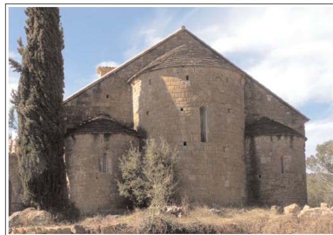
SANT SEPULCRE DE PALERA. Absis.

ment de torre, però que inicialment era d'espadanya. Al seu interior, hi ha una altra pica baptismal d'immersió de finals del segle XII, també semi-esfèrica i de grans dimensions i dos registres esculpits: l'inferior amb quatre palmetes i el superior amb quatre personatges, sota arcades, que se'ls relaciona amb el pecat, possiblement l'original.