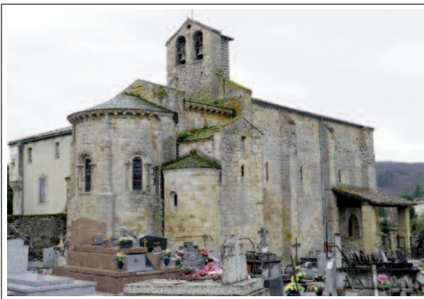
SANT JOAN DE VERGES

ha un fresc amb el sant que senyala l'Agnus Dei i a l'esquerre s'endevina Jesús. A l'exterior, les finestres de les absidioles no disposen de decoració. Les tres de l'absis estan decorades amb fulles de cistell , croses abacials, ous allargats, boles i estrelles. A l'absis, sota el ràfec, hi ha un fris amb decoració vegetal. Al cementiri es