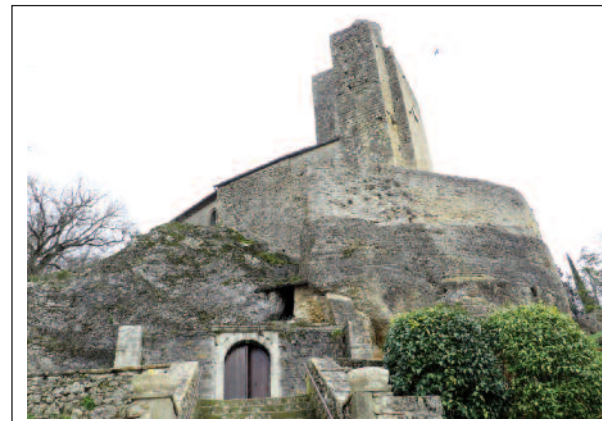
VALS. L'edifici encastat dins la gran roca.

A l'interior les parts més destacables són: la capella del bisbe Felip de Lévis amb un laberint (està en mal estat i no és visitable); les claus de volta de les capelles radials, que són atribuïdes al mestre de Rieux (gran escultor); nombroses imatges de fusta daurada (segle XVIII); pintures dels segles XVII i XVIII; un tabernacle de marbre; la taula de l'altar i el suport de pedra esculpida (segle XV); i, finalment, un orgue de quaranta jocs o registres del 1891.