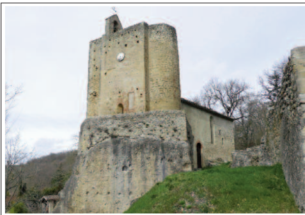
VALS. L'edifici vist des de la cara sud

Les pintures murals romàniques (segle XII) es consideren influïdes pel taller del mestre de Pedret. S'hi representa: l'Anunciació i la Nativitat; el període evangèlic (16 personatges: apòstols, profetes i deixebles) i Crist en Majestat, acompanyat del tetra-