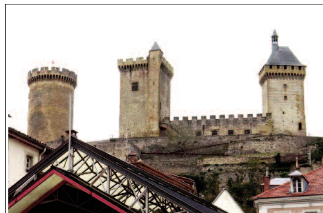
FOIX. Les tres torres del castell.

Departament francès de la regió d'Occitània que es divideix en tres grans zones: la primera és la plana de l'Arieja, situada al nord, constituïda per planes i petits turonets i travessada pel riu Arieja, està dedicada bàsicament a l'agricultura; la segona és al Prepirineu amb turons inferiors a 1000 m, amb massisos granítics i també margues calcàries, i la tercera és ja al Pirineu amb grans muntanyes i parts molt boscoses.