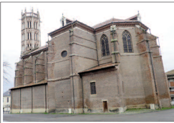
PÀMIES. Catedral de Sant Antoni.

tots els edificis religiosos (només deixen en peu els campanars que servien de vigilància) i cremen les relíquies de Sant Antoni. El 1628, el príncep de Condé (cosí del rei de França) la reconquerí, però en quedà com a senyor de tots els béns. Als segles XVII i XVIII es reconstruí lentament la vila. La gran expansió de la ciutat