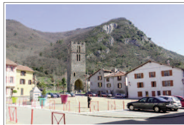
TARASCON. La plaça Major amb l'antiga torre del campanar al fons, situats a la part alta de la població

Al segle XI la vila ja era un centre comercial important i es protegí amb unes muralles. Pertanyia al comte de Foix, però era administrada pels cònsols. El XII es construí un segon recinte emmurallat i un pont per travessar el riu Arieja. Durant el segle XIV, la vila creix fora muralles i apareixen els barris de Santa Quiteria (al final del pont) i el de Sant