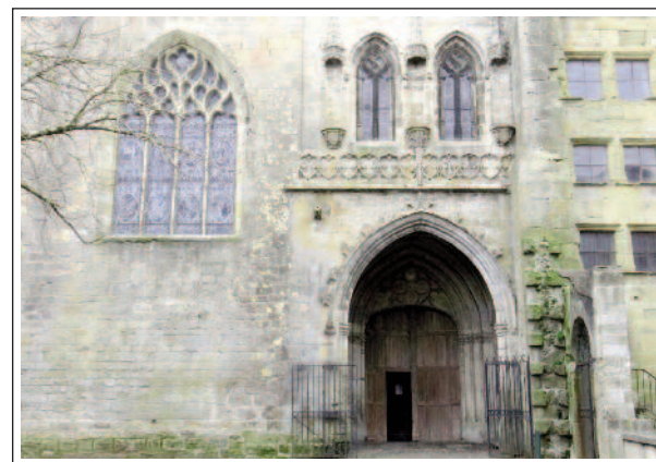
MIRALPEIX. Portal de la catedral

La primitiva vila estava tocant a la llera dreta del riu Hers i davant del massís de Tabe. El topònim, segons els erudits, prové del llatí Mirum Podium (mirant la muntanya). Al mateix indret ja hi havia hagut una colònia fenícia.