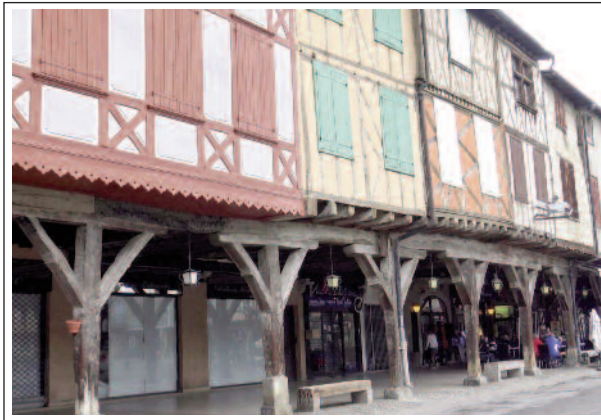
- El palau episcopal fou bastit, al segle XV, MIRALPEIX. Casals porxats de la plaça

gió fou pràcticament destruïda, només va subsistir una part de la portalada i el campanar. La reconstrucció s'acabà el 1689.