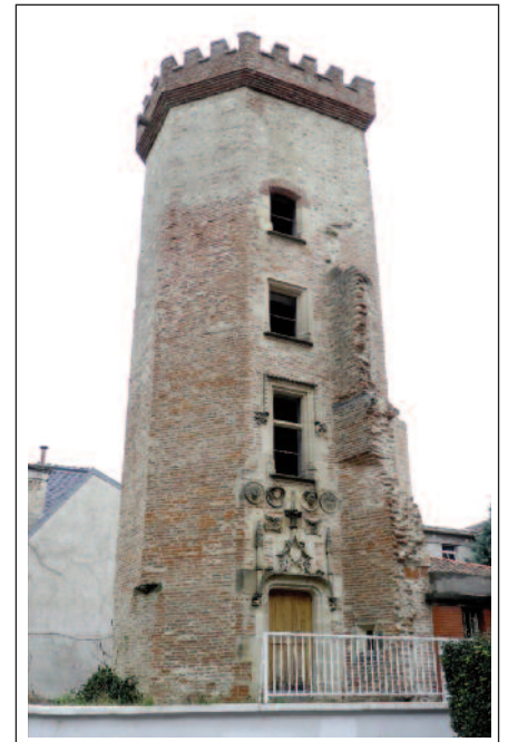
PÀMIES. TORRE DE LA MONEDA.

El comte Roger II de Foix va anar a la primera croada i va combatre a la vila siriana d'Apamée. En tornar, l'any 1111 va fundar la vila de Pàmies, va fer construir un castell al cim del tossal i l'anomenà Castrum Appamiae , que fou totalment enderrocat. Es creu que d'ell deriva el topònim de la vila. Al peu del castell es construí també una església, que és l'indret on hi ha la catedral actual. Amb el catarisme Pàmies va ser un ferm defensor del catolicisme. Per recompensar la seva fidelitat, el 1295 el Papa la nomenà seu d'un bisbat. Des de llavors la vila s'enriquí gràcies a la religió i s'instal·laren a la vila quinze ordes religioses. El segle XVI fou molt dolent, ja que hi hagueren dues epidèmies de pesta, però, el més greu foren les guerres de religió. L'any 1576 els hugonots conquereixen la vila, fan grans destrosses i arrasen