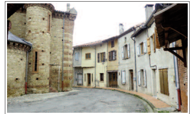
SANT MARTÍ D'ÒIDES.

Fora de la vila hi ha el castell dels senyors. L'inicial era del segle XII, però fou molt modificat.