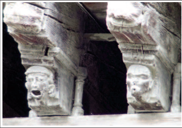
MIRALPEIX. Caps de biga esculpturats de la casa dels Cònsols.

Al segle XII fou un dels centres destacats del catarisme (pràcticament tots els seus habitants eren càtars). L'any 1209, durant la croada albigesa fou conquerida per Simó de Montfort que la va cedir al seu lloctinent Guiu de Lévis que passà a ser mariscal de Miralpeix. La família Lévis foren sempre senyors de la vila, però