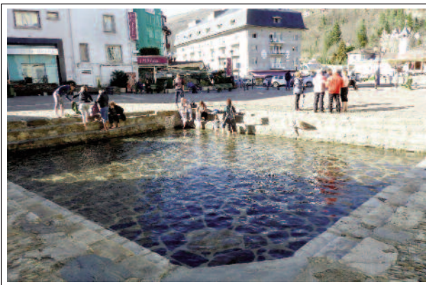
ACS. LA BASSA DELS LLADRES.

El primer document conegut que cita l'església i les terres d'Acs és de l'any 987. Bastant més tard, el 1241, la vila, que estava situada al costat dret del riu Lauze, és destruïda per un gran incendi. Es construí la vila nova a la confluència dels rius Arieja, Orieja i Lauze i el comte de Foix atorgà una carta de privilegis. La vila fou encerclada per muralles amb vuit torres de defensa. El 1260 el comte de Foix, a petició del rei de França, fundà, al costat de la Bassa dels Lladres, una leproseria per cuidar els soldats malalts que tornaven de Terra Santa. L'any 1445 la vila era el cap de la castellanía que comprenia aquesta i nou viles més.