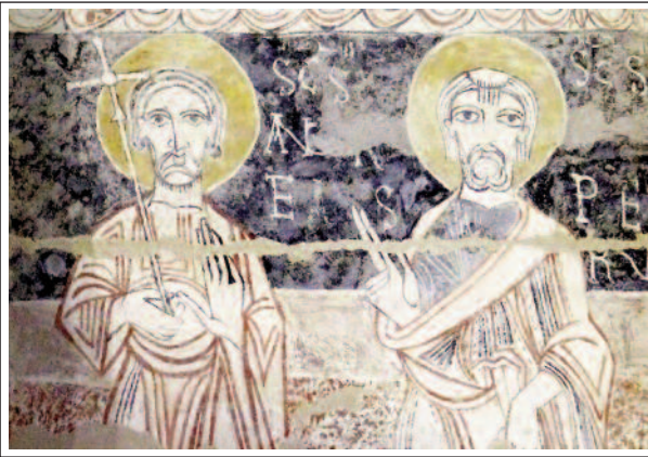
VALS.. Fragment de les pintures murals

també nombroses restes de ceràmica. També objectes galoromans i merovingis. El primer document en la qual surt esmentada es de l'any 1104. El 1910 fou declarada Monument Històric. A partir de 1956, s'efectuà la restauració de l'edifici i molt especialment de les pintures murals.