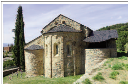
SANT VICENÇ D'ESTAMARIU. Capçalera

Estamariu és un municipi de l'Alt Urgell situat al nord-est i molt proper a la Seu. El poble d'Estamariu té 119 habitants i, com Bescaran, té dues esglésies, la vella i la