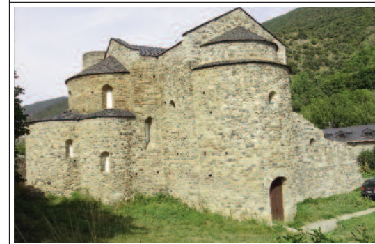
SANT SERNI DE TAVÈRNOLES. Capçalera, orientada a ponent.