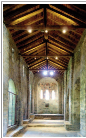
SANT VICENÇ D'ESTAMARIU. Interior i pintures romàniques de l'absis

nova. L'actual, moderna, situada dins del casc urbà, i la romànica, als afores, sense culte, envoltada pel cementiri vell.