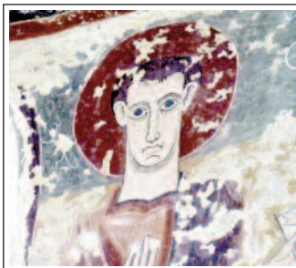
SANT JOAN EVANGELISTA.

Sant Vicenç d'Estamariu es documenta a principis del segle XI i en aquesta mateixa època correspon el temple actual, romànic, d'estil llombard. És de planta basilical, amb tres absis i tres naus cobertes d'inici amb voltes que varen caure pels efectes d'un terratrèmol i foren substituïdes per encavallades de fusta. L'any 1950 se n'ensorrà una part de nou i actualment tornen a tenir l'embigat, producte de la restauració de la dècada dels 1990. La reparació va comportar també el tancament dels murs i la restauració de la pintura mural romànica del segle XII que hi ha a l'absis major. Unes pintures que van descobrir l'any 1993 un grup de voluntaris, esperonats pel Centre d'Estudis de l'Alt Urgell, en netejar les bardisses de l'església abandonada. També descobriren unes pintures gòtiques a l'absis sud.