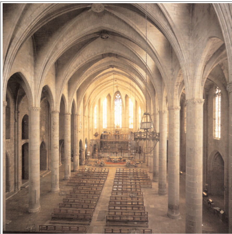
SANTA MARIA DE CASTELLÓ D'EMPÚRIES. Interior de l'església.

El retaule d'alabastre de l'altar major és una obra gòtica (segle XV) de l'escultor Ponç Gaspar, deteriorada pels soldats francesos el 1795; altres peces interessants són els dos sepulcres del comte Malgaulí i el seu germà Hug, la pica baptismal romànica, de pedra, i altres objectes instal·lats al Museu Parroquial; al Museu d'Art de Girona hi ha les taules gòtiques procedents d'aquesta església.