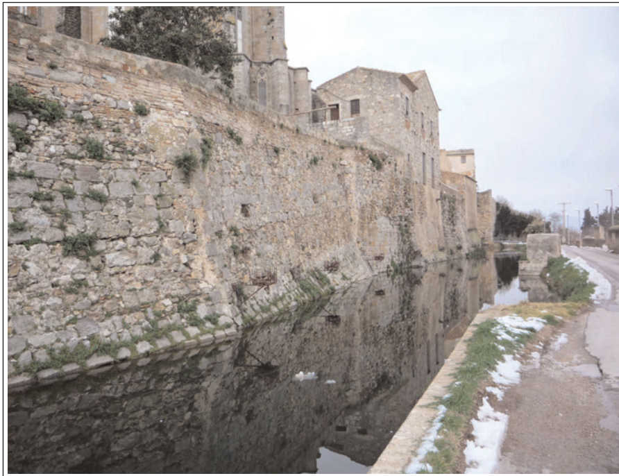
CASTELLÓ D'EMPÚRIES. Fragment de la muralla que encerclava la vila.

Els estanyts havien estat en època medieval una de les riqueses del comtat emporità per l'abundosa pesca i caça i per la sal produïda vora la