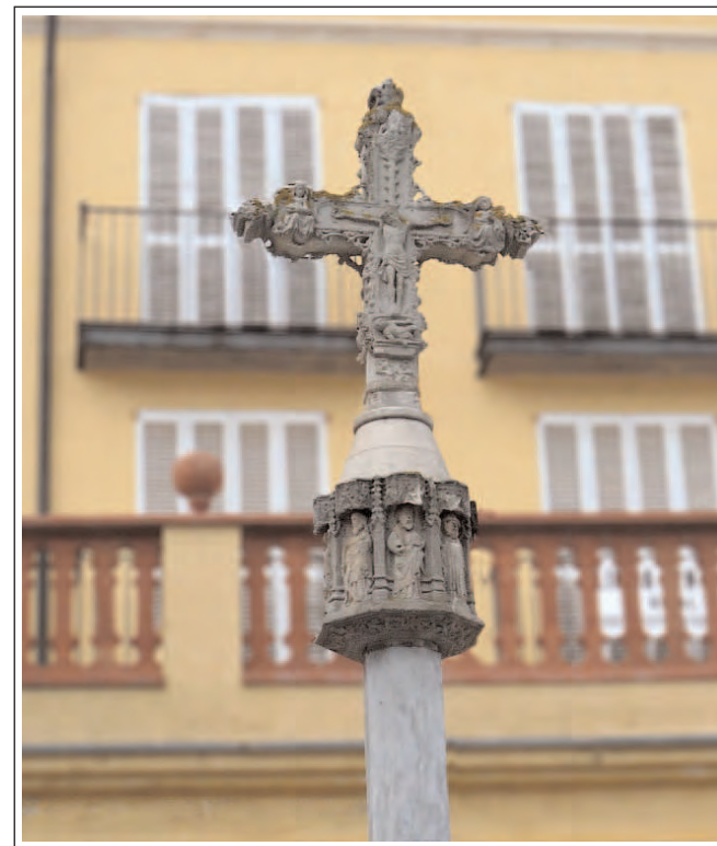
CASTELLÓ D'EMPÚRIES. Creu de Terme de la plaça de l'Església.

La columna és de secció octogonal i acaba en un capitell de la mateixa forma decorat amb vuit petites figures de sants posades dins unes fornícules. A la creu, en una cara hi ha el Crist crucificat i a l'altra la Mare de Déu amb el fill en braços. Els extrems de la creu estan decorats amb motius vegetals i geomètrics. Aquesta creu va estar molt de temps en el cementiri de Castelló. Fou tras-