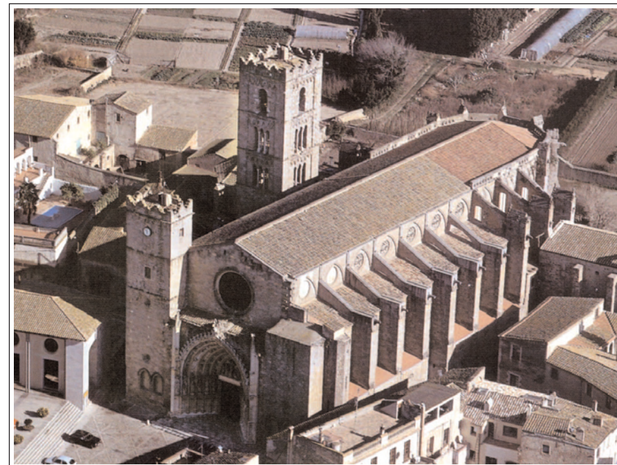
SANTA MARIA DE CASTELLÓ D'EMPÚRIES.

El Pont Vell sobre la Muga, a ponent de la vila, a l'antic camí de Figueres, fou construït pel comte Pere I (1325-41). Curiosament, aquest pont s'anomenava "Pont Nou", perquè n'hi havia un altre de més antic, construït en època alt medieval, en el camí de Sant Pere Pescador, del qual