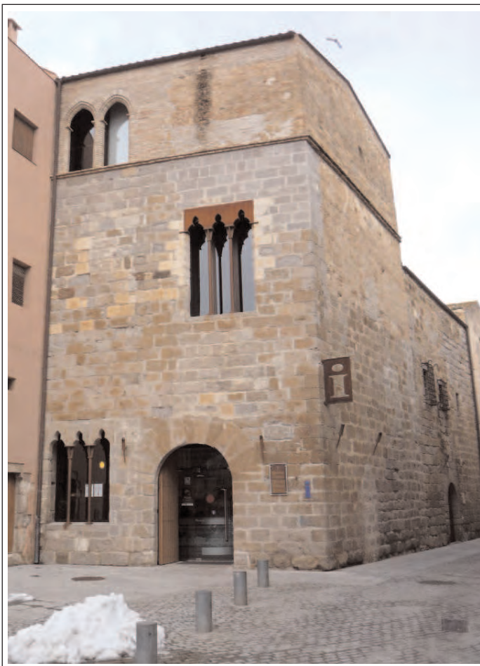
CASTELLÓ D'EMPÚRIES. Edifici de la Presó

Situats a l'angle nord-oest de la plaça del Gra. És un edifici gòtic construït entorn del 1336, que integrava les dues funcions: la Cúria, seu del tribunal de justícia i la presó, on ingressaven els condemnats. A la Cúria, destaca la façana que dona