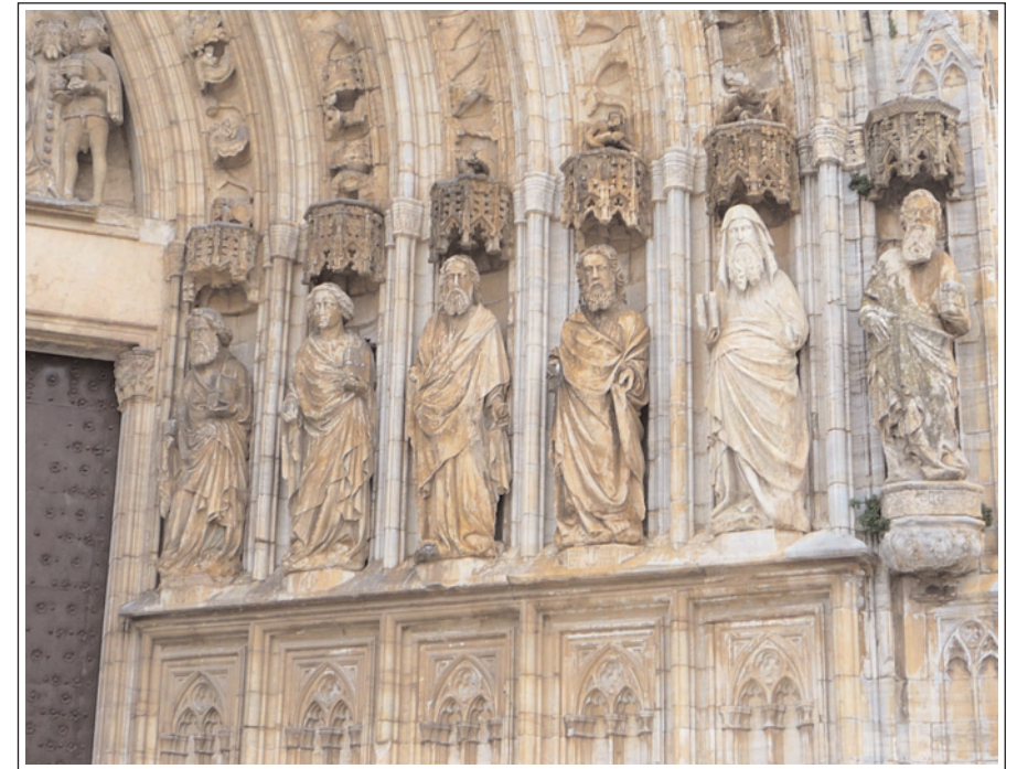
SANTA MARIA DE CASTELLÓ D'EMPÚRIES. Detall de la façana.

La part més monumental és la gran portalada de marbre blanc, obra d'Antoni Antigó, formada per sis grans arquivoltes en degradació decorades amb motius vegetals en relleu, formant unes fornícules on hi ha col·locades les estàtues dels dotze apòstols, de mida natural, algunes ben conservades. Tota l'obra esculturada de la portada és d'una gran bellesa, i constitueix una obra única dins l'estil gòtic en tota la comarca. Al segle XVIII s'afegí, a més de les capelles dites, la sagristia; el 1981 fou restaurat l'orgue del segle XIX.