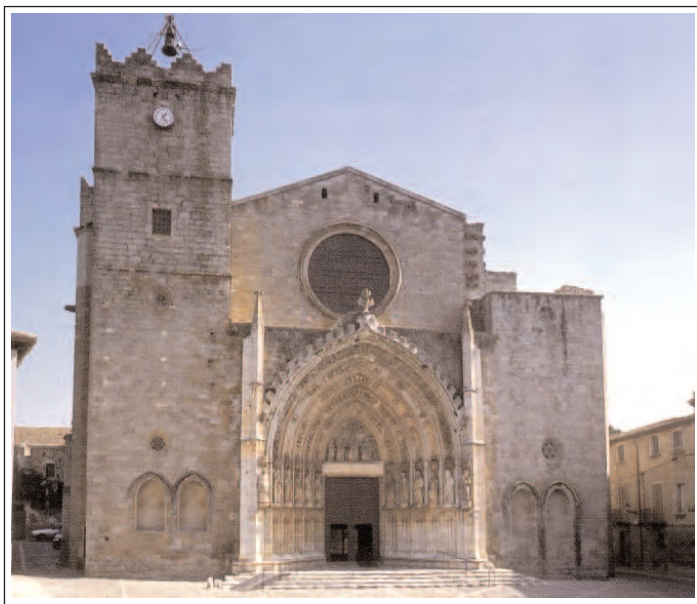
SANTA MARIA DE CASTELLÓ D'EMPÚRIES. Façana. Foto ECSA - G. Serra, procedent de L'Art Gòtic a Catalunya . Arquitectura II, pg. 59.

Dels elements anteriors al gòtic, el més important és la torre campanar de planta quadrada, d'estructura romànica, amb dos pisos inferiors llisos i tres de superiors, separats per frisos