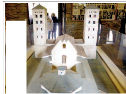
SANT MIQUEL DE CUIXÀ. Maqueta de tal com

Va ser fundat l'any 879, entorn d'una antiga església (Sant Germà de Cuixà). Refeta i consagrada de nou el 953, cresqué i es desenvolupà ràpidament. A mitjan segle X posseïa ja un extens patrimoni amb més d'una vintena d'esglésies parroquials, que anaven des del comtat de Tolosa fins al d'Osona. Posteriorment, es va construir una nova església, Sant Miquel, que va ser consagrada l'any 974. En època de l'abat Oliva (el mateix que fou abat del monestir de Ripoll i fundador del de Montserrat), es va afegir a la façana posterior del temple de sant Miquel dos corredors i tres absidioles i s'aixecà, damunt l'altar major, un cimbori. S'edificà, a més, la cripta dita del Pessebre amb un pilar central rodó i molt gros, i també la capella sobreposada de la Trinitat i dos majestuosos campanars llombards de quaranta