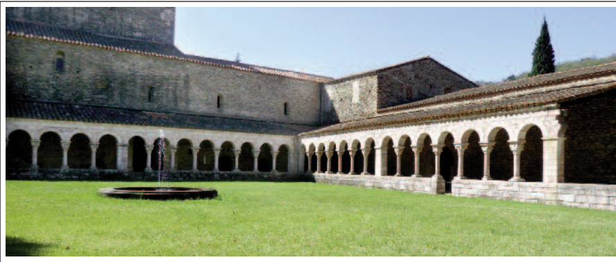
SANT MIQUEL DE CUIXÀ. Claustre.

metres d'alçària a l'extrem dels braços del creuer de la basílica. Aquest conjunt arquitectònic enllaça dos corrents: el període inicial romànic d'influència mossaràbiga (característic pels arcs en forma de ferradura) i un de més tardà, el romànic llobard. El monestir de Sant Miquel de Cuixà va ser completat, al segle XII, amb la construcció del claustre, de marbre rosat, amb capitells esculpits que, en part, es conserven avui al monestir; la resta són al museu The Cloisters , a Nova York i a Filadèlfia.