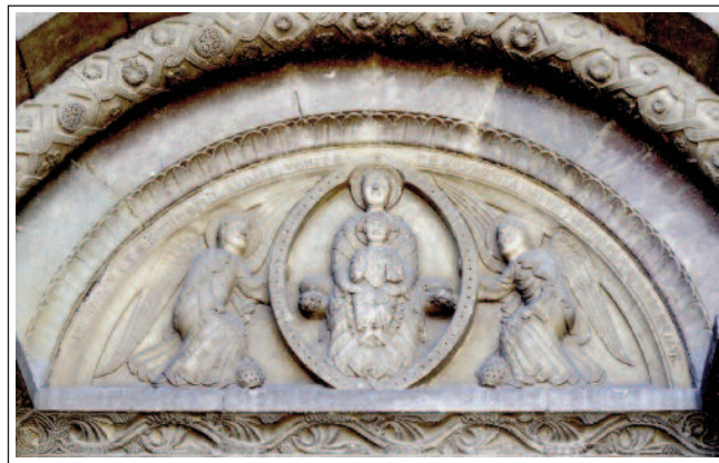
La separació de SANTA MARIA DE CORNELLÀ DE CONFLENT. Timpà del portal.

El temple va tenir dues etapes constructives, una al segle XI i l'altra al XII. Consta de tres naus, capçada per un transsepte, un absis central i quatre absidioles buidades en el mur, un i altres, semicirculars.