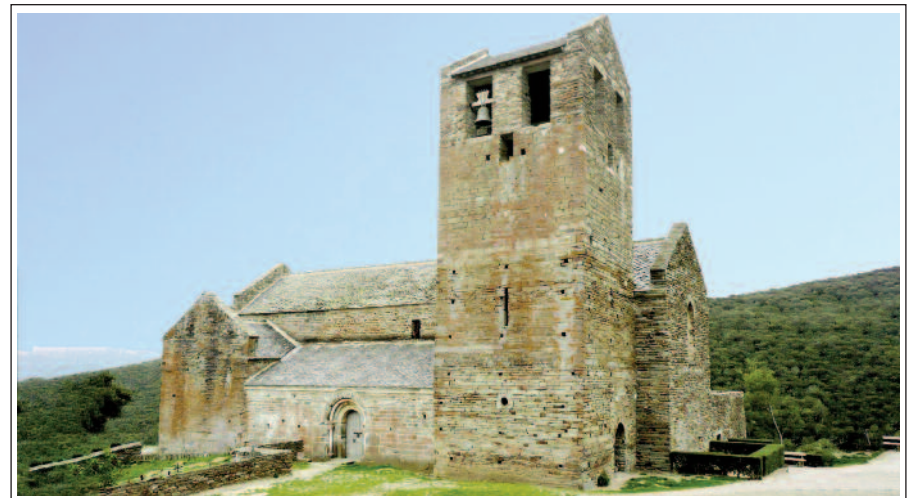
PRIORAT DE SERRABONA.

El monestir romànic de Serrabona està situat al Rosselló, entre el massís del Canigó, els rius Tet, Tec i la plana del litoral. Havia estat centre d'un minúscul poblat. L'accés més còmode per arribar a Serrabona és la carretera que surt de Bulatenera, població situada a mig camí entre Perpinyà i Prada de Conflent.