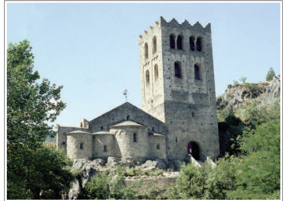
SANT MARTÍ DEL CANIGÓ.

Era la residència dels comtes de Cerdanya. Està documentat l'any 1047, però possiblement és un xic anterior. Rebé algunes transformacions al segle XIV i altres de posteriors. Actualment és privat i està repartit entre tres propietaris. A l'angle NW, hi ha una torre circular que, malgrat algunes modificacions, és romànica, del segle XI.