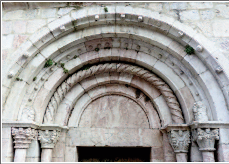
SANT JAUME DE VILAFRANCA DE CONFLENT. Portal principal.

De romànic, en resta només el mur nord, amb els dos bonics portals. Presenten arquivoltes en gradació, columnes i capitells, de marbre rosa local, decorats amb motius vegetals, animals i humans. El portal principal és obra del taller del claustre de Cuixà, en canvi, el portalet és del taller de les tribunes. A l'interior del temple hi ha: un cadirat, un crist jacent, un sant Pere (atribuït a Jaume Cascalls) i altres talles, tot gòtic. També hi ha retaules dels segles XVII i XVIII. El de la Mare de Déu de Vida és atribuït a l'escultor barroc Josep Sunyer. Textos de Vilafranca: Joan Codina.