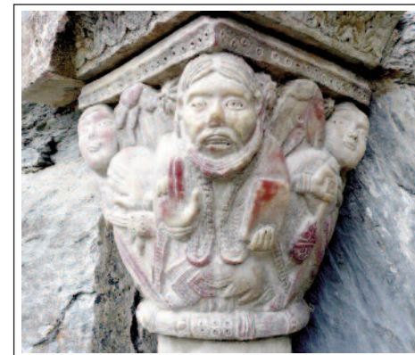
SANTA MARIA DE SERRABONA. Capitell del portal.

tura que ha donat nom a l'artista: el mestre de les tribunes. Té una característica especial: els forats del trepant utilitzat, que sovint coincideixen amb els ulls dels personatges esculpits.