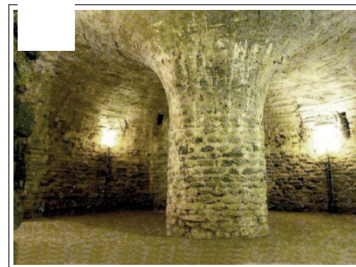
SANT MIQUEL DE CUIXÀ. Capella del Pessebre.