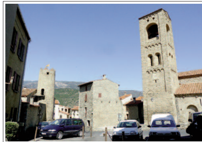
CORNELLÀ DE CONFLENT. A l'esquerra la torre del castell.

varen rebre moltes donacions. Els canonges vivien en unes edificacions adossades a un primer claustre construït al costat nord. L'any 1356, eren insuficients i el rei Pere el Cerimoniós les va cedir per a residència del palau comtal, que està al costat sud. Allà es bastí