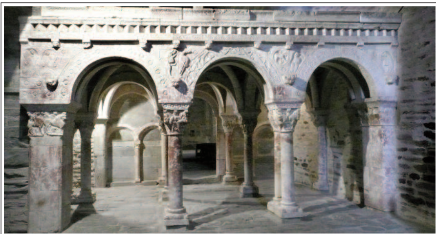
SANTA MARIA DE SERRABONA . Tribuna.

Avui és un edifici amb planta de creu llatina, volta de canó apuntada, transsepte i tres absis. Només el central és visible des de l'exterior, les absidioles són buidades dins dels respectius murs. És dins la nau on hi ha l'element més significatiu de Serrabona: la tribuna o cor alt, del segle XII. Comunicava el claustre amb el primer cos del campanar, però va ser desmuntat i traslladat en una data desconeguda i, per això els historiadors no es posen d'acord sobre la funció que devia tenir. Avui la podem admirar al centre de la nau. Reposa sobre un conjunt de columnes amb capitells esculpats, com també ho són les arquivoltes de la cara oest. Ha estat una escul-