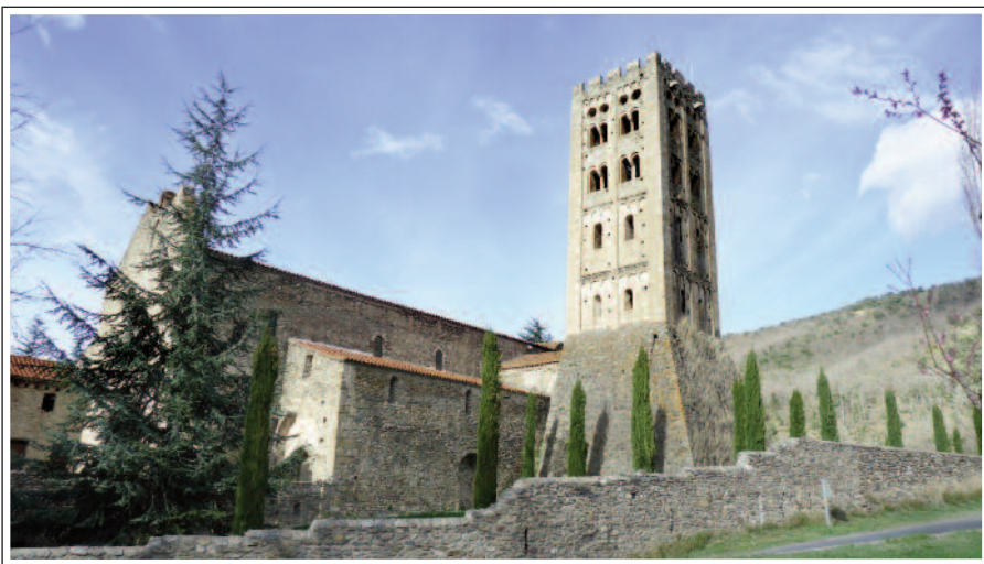
SANT MIQUEL DE CUIXÀ.

El portal principal consta de cinc arquivoltes en gradació i un timpà esculpit. Hi ha tres tors decorats, sostinguts per columnes i capitells de marbre, on es representen lleons alats, grius i palmetes. El timpà mostra la Mare de Déu amb el Nen, asseguda en un tron amb caps de lleó, dins d'una màndorla sostinguda per dos àngels amb encensers o turiferaris. Les portes de fusta disposen d'una bonica ferramentà romànica. Està coronada per una finestra similar a les de l'absis principal. El campanar s'alça a l'angle sud-oest. És del segle XI, d'estil llombard, i té tres pisos. Al costat nord del temple es conserven restes del primer claustre. Al segle XIV, l'església va ser fortificada i en els murs es bastí un pas de ronda amb merlets piramidals. Textos de Cornellà: Joan Codina.