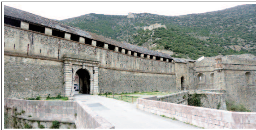
VILAFRANCA DE CONFLENT. Portal de llevant.

Vila situada en un lloc estratègic que va ser fundada l'any 1090 pel comte de Cerdanya. Primer tenia els avantatges de ser comtal. Més tard