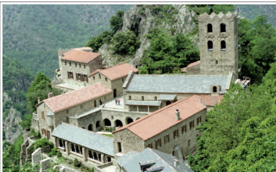
SANT MARTÍ DEL CANIGÓ.

L'abadia benedictina de Sant Martí del Canigó és situada en un esperó rocallós de la muntanya del Canigó, a 1.055 m d'altitud, damunt del poble de Castell. Va ser fundada l'any 1007 pel comte Guifré II de Cerdanya, "sobre el mateix lloc on hi havia una església molt antiga". Esdevingué monestir, santuari i lloc de pelegrinatge, gràcies sobretot a les relíquies de sant Galderic, patró dels pagesos catalans, relíquies que adquirí el mones-