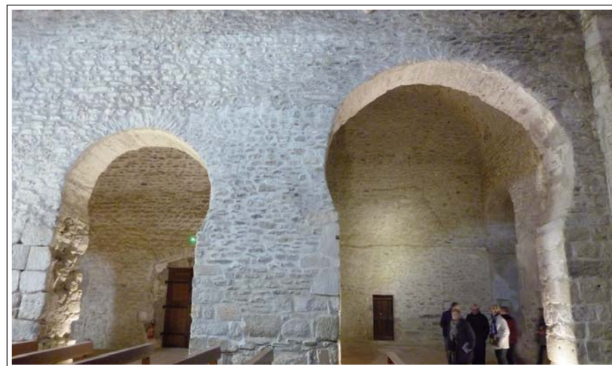
SANT MIQUEL DE CUIXÀ. Arcs de ferradura que corresponen a l'etapa preromànica.

tir, per allotjar els cistercencs de Fontfreda, els quals hi romangueren fins al 1965, que el cediren als monjos de Montserrat. A partir de 1920 s'efectuaren campanyes periòdiques de restauració. Les que es feren a partir de 1938 varen ser fetes sota la direcció de l'arquitecte Josep Puig i Cadafalch. L'església no es va cobrir de nou fins el 1957 i el 1974 es recuperà i recol·locà l'ara de l'altar.