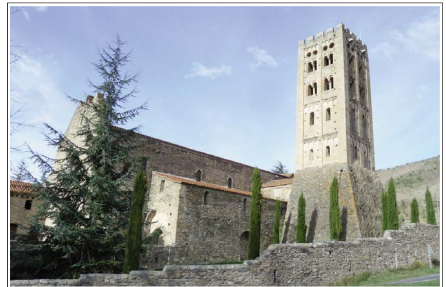
SANT MIQUEL DE CUIXÀ.

L'any 840 va ser fundat el monestir de Sant Andreu d'Eixalada, en un indret amb fonts termals sulfuroses, a l'actual municipi de Nyer, al costat mateix del riu Tet. El 878, una gran riuada s'emportà l'església, alguns monjos, i la documentació. La comunitat es refugià al petit cenobi de Sant Germà de Cuixà, dirigit per l'arxipreste Protasi. L'any següent es produí la unió de les dues comunitats i Protasi en fou el primer abat. Durant el segle