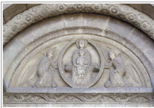
CORNELLÀ DE CONFLENT. Timpà de l'església de Santa Maria.

A l'absis central s'obren tres finestres de doble esqueixada. Disposen, tant a l'exterior com a l'interior, d'arquivoltes en gradació, amb dos tors decorats sostinguts per columnetes i capitells de marbre esculpits. A l'exterior, hi ha arquivoltes i faixes de