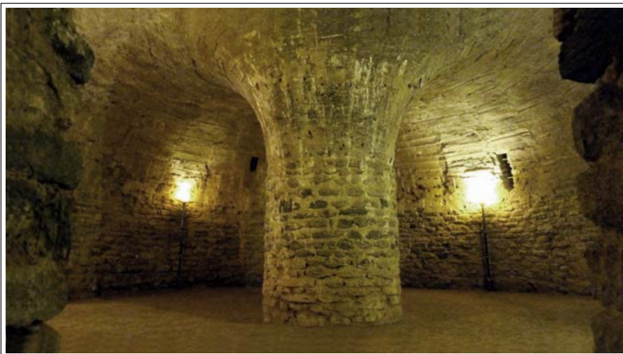
SANT MIQUEL DE CUIXÀ. Cripta del Pessebre.

La tercera, de l'abat Gregori I, consistí en construir el claustre romànic del primer taller de Cuixà, amb planta de trapezi irregular. És un dels més grans. Els capitells i les columnes són de marbre rosa de Vilafranca de Conflent. Fou reconstruït el 1954 amb 35 capitells; 27 de recuperats de les rodalies i 8 procedents de la tribuna. Els capitells estan decorats amb motius vegetals (volutes, fulles d'acant o de lliris d'aigua, rosetes i pinyes), i animals (lleons, ocells, micos i bèsties fantàstiques). En d'altres hi ha figures humanes. També féu construir la tribuna o cor elevat, amb artistes procedents d'un altre taller, el conegut com a taller del mestre de les tribunes o mestre de Serrabona i té millor qualitat. Consistia en una façana amb tres arcades esculpides i una sèrie de columnes i capitells decorats amb motius