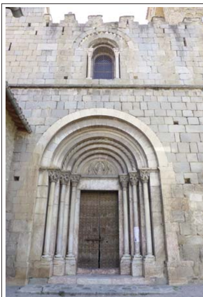
SANTA MARIA DE CORNELLÀ DE CONFLENT

agustinià. Des de llavors fins al segle XIV varen rebre moltes donacions. Els canonges vivien en unes edificacions adossades a un primer claustre construït al costat nord. L'any 1356, eren insuficients i el rei Pere el Cerimoniós els va cedir per a residència el palau comtal, que està al costat sud. Allà es bastí un nou claustre en estil gòtic. Al segle XV, amb els priors comendataris, arribà la decadència. El 1592, fou secularitzada i es mantingué fins a la Revolució Francesa. Fou un període de nombroses reformes de les edificacions, que varen desfigurar el priorat. L'any 1840, l'església fou declarada monument històric i es varen iniciar les restauracions.