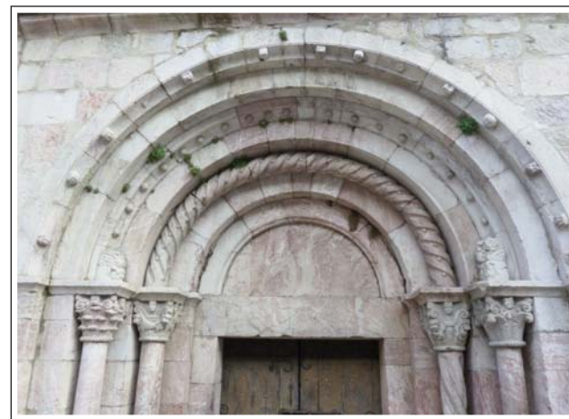
SANT JAUME DE VILAFRANCA DE CONFLENT. Porta principal

Vila situada en un lloc estratègic que va ser fundada l'any 1090 pel comte de Cerdanya. Primer tenia els avantatges de ser comtal. Més tard passà a ser vila reial, amb augment de privilegis. Del 1126 fins al 1773, fou la capital de la vegueria, que comprenia la comarca del Conflent, la Llaguna i la sotsvegueria del Capcir. Després la capitalitat es traslladà a Prada. La vila, de forma allargassada, es configura amb dos carrers principals paral·lels, el de Sant Joan i el de Sant Jaume, que condueixen als dos portals principals, el d'Espanya i el de França. Hi ha dos edificis notables: el de l'Hospital del segle