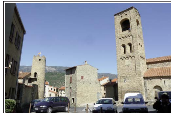
CORNELLÀ DE CONFLENT. Torre del castell palau dels comtes de Cerdanya i campanar de l'església.

El primer document conegut on s'esmenta aquesta església és de l'any 1018. La parròquia pertanyia als comtes de Cerdanya. El 1097 el comte Guillem Jordà hi fundà un priorat