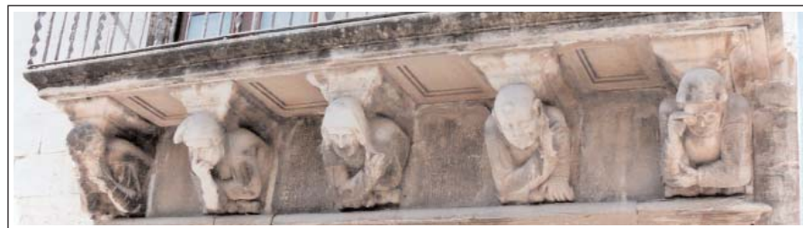
CERVERA. EDIFICI DE LA PAERIA. Detall de les mènsules d'un dels balcons.

El conjunt arquitectònic de la Companyia de Jesús és on hi havia hagut l'església de Sant Benet on, l'any 358, es reuniren les Corts Catalanes, presidides per Pere el Cerimoniós i es constituí, per primer cop la Generalitat de Catalunya. Durant l'època universitària fou col·legi de Sant Carles, dels jesuïtes, i un dels seus deixebles fou el sacerdot i filòsof Jaume Balmes.