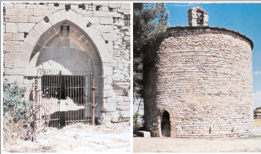
SANTA MAGDALENA. Cervera.