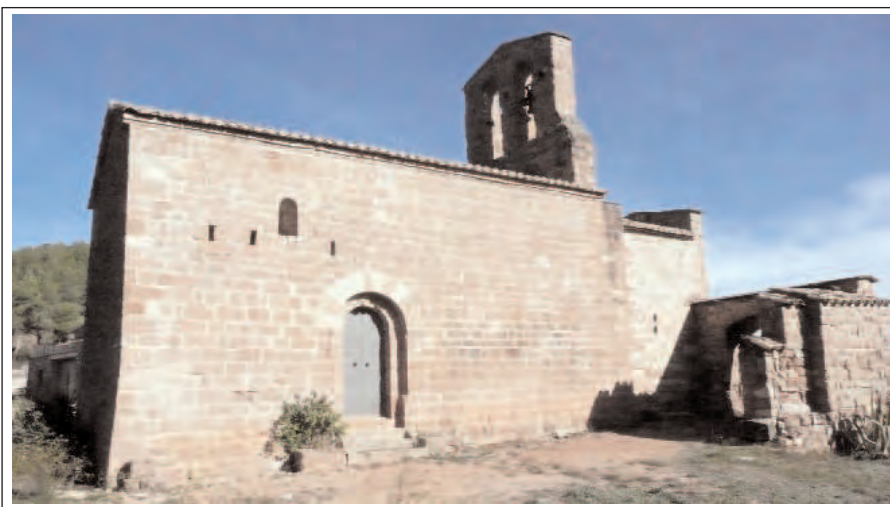
SANTA MARIA DEL GRAU. Façana de migdia.