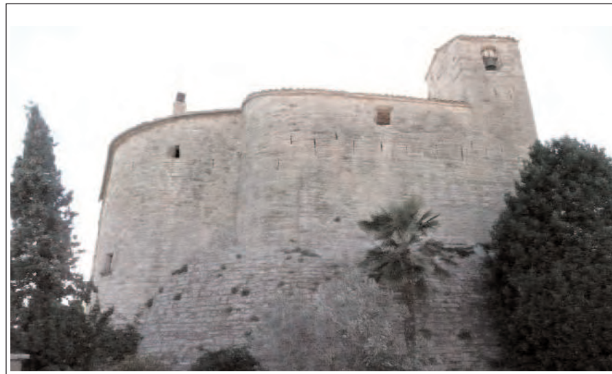
SANT CRISTÒFOL DE FIGUERA. Façana espitllerada de la cara nord.

comunica la capella amb el mas que s'hi adossa. El portal i la finestra del mur oest i també una torre massissa són modernes. El pis superior i els murs atalussats a la base són les posteriors reformes ja esmentades. Del campanar de cadireta sobre el mur oest, només hi ha la base, la creu de pedra es moderna. L'aparell és de carreus disposats ordenadament a trencajunts.