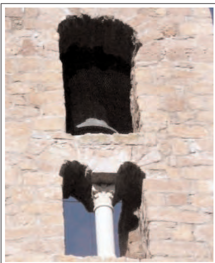
SANT MATEU DE BAGES. Detall del campanar.

El temple es va construir al s. XII, s'hi feren reformes i fou fortificada als ss. XV- XVI. És de nau única capçada a l'est per un absis semicircular. La coberta de la nau és de volta de canó i la de l'absis de volta de quart d'esfera, la unió d'ambdues és per mitjà d'un ressalt de reducció. A l'absis, al costat dret hi ha una arcada que comunica amb el que devia ser la sagristia i al centre s'obre una finestra de doble esqueixada coronada per un arc de mig punt fet amb dovelles. El portal original és el del mur sud, és molt senzill, acabat amb un arc de mig punt fet amb dovelles i