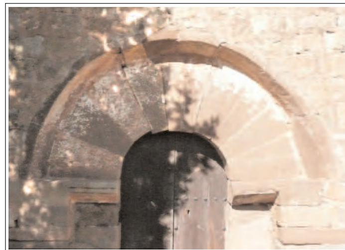
SANT MIQUEL DE LES PLANES. Detalla del portal.

L'església era l'antiga capella del castell, tot i estar situada fora del seu recinte. Té un aire preromànic, però és de finals del segle XII o començament del XIII i amb una important refecció al segle XVIII. És de nau única capçada a l'est per un absis carrat, ambdós coberts amb volta de canó que arrenca de la cornisa. Els murs laterals de la nau, sota de la cornisa, hi ha adossades dues arcades. Al centre de l'absis i també al mur oest, s'obren sengles finestres de doble esqueixada coronades amb un arc monolític.