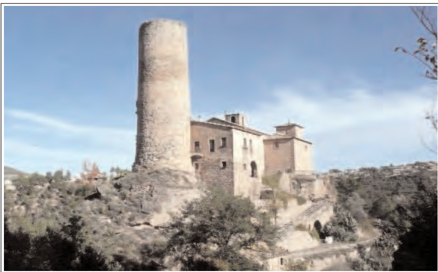
CASTELL DE FALS. Conjunt encastellat dalt del turó, amb la torre altmedieval encara existent.