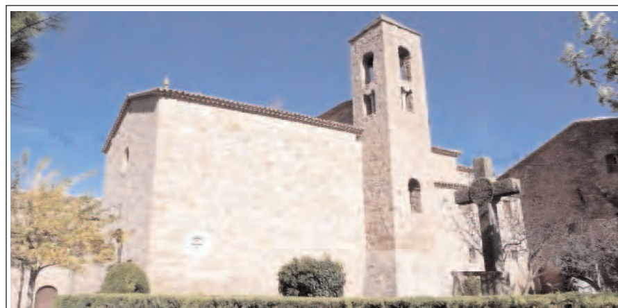
SANT MATEU DE BAGES. Conjunt de l'església i del campanar romànic.

La primera, està situada a l'oest del Bages, assoleix els 922 m. d'altitud al turó de Govern, té molta part boscosa -pinedes, rouredes i alzinars– i també camps amb agricultura de secà -cereals, vinyes i oliveres-. El municipi més important és Sant Mateu de Bages, on visitarem: l'església de