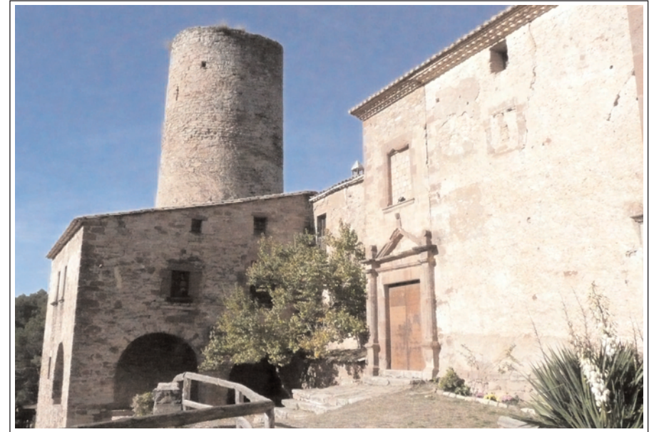
CASTELL DE FALS. A la dreta l'església de Sant Vicenç, construïda posteriorment al segle XVII.

La segona, està situada al sud de la serra de Castelltallat, és una zona molt boscosa – sobretot pinedes i també alguns alzinars - d'altiplans que limita amb l'Anoia. Tota la vall pertany al terme municipal de Fonollosa. Visitarem: el castell i l'església de Sant Vicenç de Fals i l'ermita de Santa Maria del Grau.