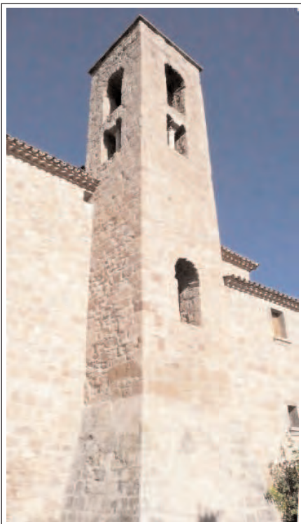
SANT MATEU DE BAGES. Campanar.

Església: De l'edifici preromànic del segle X només en resta el campanar, les altres parts són posteriors –la porta es gòtica -. El campanar també havia sofert diverses modificacions, però el 2001 va ser restaurat per tornar-li l'aspecte original. És molt esvelt –6m. d'alçada–, de planta quasi quadrada i consta d'una socolada i tres pisos. El mur sud del primer pis i a cada cara del tercer, s'obre una finestra d'arc de ferradura amb dovelles petites. El segon pis té quatre finestrals geminats coronats per arcs de ferradura que descansen sobre una columna central i un capitell amb decoració vegetal –fulles i tiges– com el model corinti. L'aparell és de blocs de pedra desbastats i disposats en filades no gaire regulars.