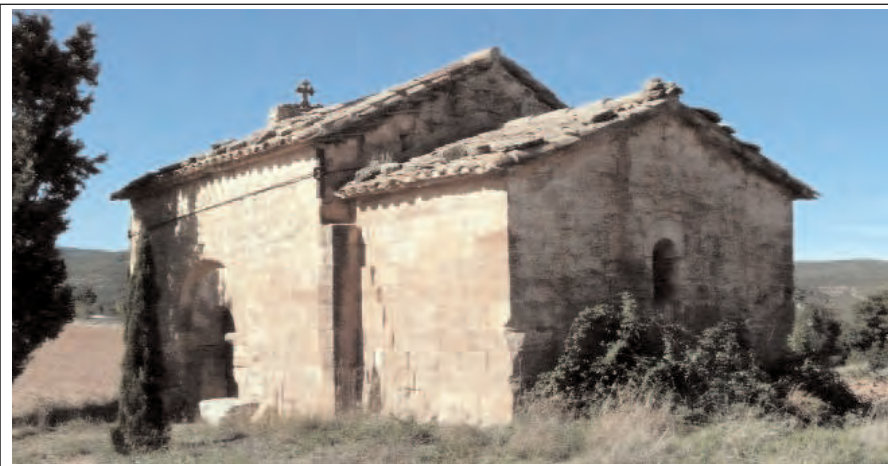
SANT MIQUEL DE LES PLANES. Edifici romànic d'època tardana, encara que presenti un aire preromànic.

L'església de Sant Vicenç, es posterior, del s.XVII.