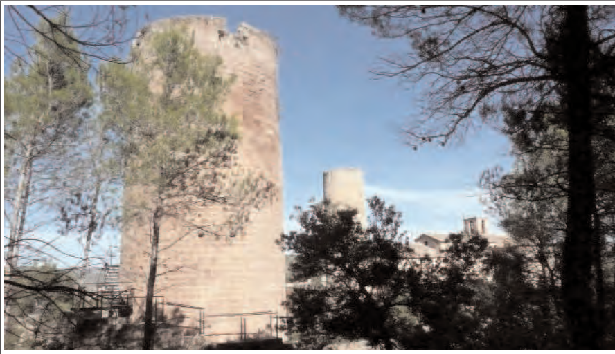
CASTELL DE FALS. En primer terme la torre més tardana. Darrere la torre romànica i l'església de Sant Vicens que constitueixen la part més interessant de l'antic castell.

Sant Miquel de les Planes, el castell i l'església de Sant Mateu de Bages i l'església de Sant Cristòfol de Figuera.