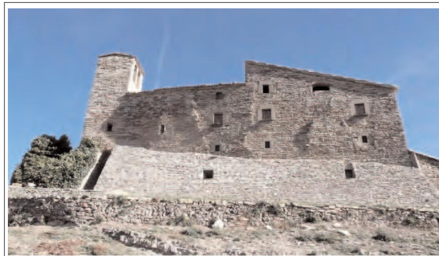
LA FIGUERA. Impressionant façana de la masia, amb l'esglésiola de Sant Cristòfol i el seu campanaret, a part l'esquerra.

comunica la capella amb el mas que s'hi adossa. El portal i la finestra del mur oest i també una torre massissa són modernes. El pis superior i els murs atalussats a la base són les posteriors reformes ja esmentades. Del campanar de cadireta sobre el mur oest, només hi ha la base, la creu de pedra es moderna. L'aparell és de carreus disposats ordenadament a trencajunts.