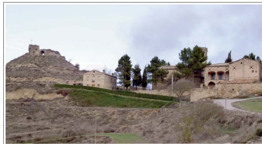
CALONGE DE SEGARRA. A l'esquerra tenim les ruïnes del castell. De l'església de Santa Fe sobresurt el campanar, darrere els arbres. A la seva esquerra s'entreveu la nau.

Municipi de 203 habitants situat al nord de la comarca d'Anoia al límit amb la de Solsona. A l'est llinda amb el terme municipal de Calaf. La seva població és disseminada, amb masies i els nuclis de població d'Aleny, Sant Pere de l'Arç, Calonge de Segarra, El Soler, Mirambell, i Dusfort, on hi ha la Casa de la Vila.