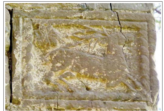
SANTA FE DE CALONGE. Curios carreu col.locat en una cantonera.

A l'interior hi ha una pica baptismal decorada amb estilitzats motius vegetals que sembla romànica. També es conserva el que es creu que és la tapa d'un sarcòfag amb relleus, actualment en un taller de restauració, segons se'ns ha comunicat.