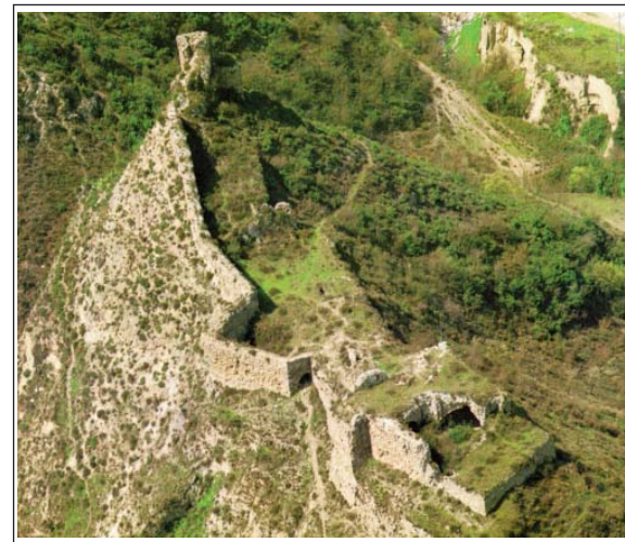
CASTELLFOLLIT DE RIUBREGÓS. Vestigis de la muralla i castell. Foto ECSA - J. Todó, publicada a Catalunya Romànica , vol XIX, p. 402.

Es troba allargassat al capdamunt de la serra que domina el poble i un important creuament de camins: el camí ral d'Igualada a Ponts , i el camí de la sal , de Cardona a Cervera. Conserva dues torres albarranes, és a dir, situades aïllades del recinte del castell. És dempeus un bon tram de muralla. A la part més alta o recinte sobirà hi ha el basament de la proba-