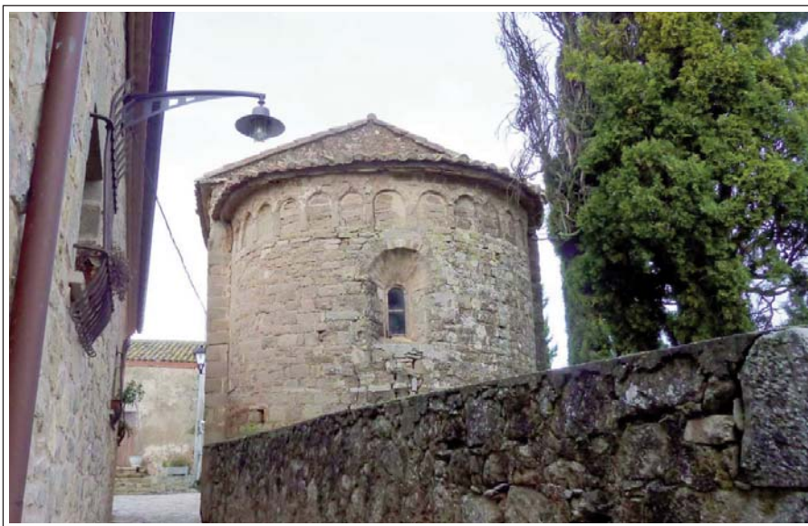
SAN PERE DE L'ARÇ O SANT PESSALÀÇ. Absis de l'església. A la dreta veiem els xiprers del cementiri i a l'esquerra una de les poques cases amb que compta el poblet.

Durant el segle XVIII es va substituir la volta romànica. Actualment la coberta exterior és a dues vessants. També és modern el campanaret d'espadanya de dos ulls. El portal continua mirant al sud, després de ser reformat el 1886.