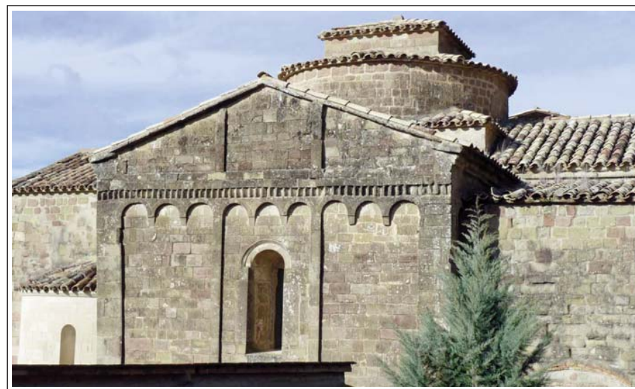
SANTA MARIA DEL PRIORAT DE CASTELLFOLLIT DE RIUBREGÓS. Cara de llevant. Absis amb decoració llombarda. A l'esquerra s'entreveu l'absidiola reproduïda modernament.

L'església és un edifici de finals del segle XI amb importants modificacions en època gòtica. Té la planta de creu llatina, amb volta de canó apuntada, El transsepte és ampli i capçat, al nord, per un portal gòtic amb una finestra al damunt de triple obertura. Al centre del creuer s'alça una cúpula sobre trompes