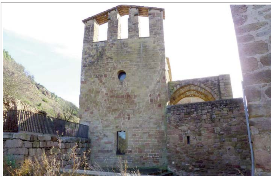
SANTA MARIA DEL PRIORAT DE CASTELLFOLLIT DE RIUBREGÓS. Façana de ponent, amb el campanar d'espadanya. Els tres arcs de la dreta corresponen a l'antic pis de sobre del celler del priorat.

que a l'exterior forma un cimbori circular, coronat per un segon cos quadrat. L'absis és rectangular amb decoració llombarda a l'exterior, que consta de tres sèries d'arcuacions cegues, entre lesenes, sota un fris de dents de serra. A banda i banda hi havia dues absidioles. La del cantó sud ha estat refeta modernament, l'altra fou convertida en capella en època gòtica. Dues capelles més, d'aquest estil, s'obren al mur de tramuntana. La porta principal s'obre al sud, és adovellada, amb guardapols i precedida d'un atri amb volta apuntada, amb osseres laterals. El campanar és d'espadanya amb tres ulls.