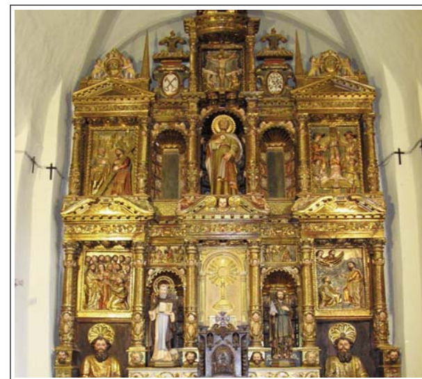
SANT PERE DE L'ARÇ. Retaule barroc.