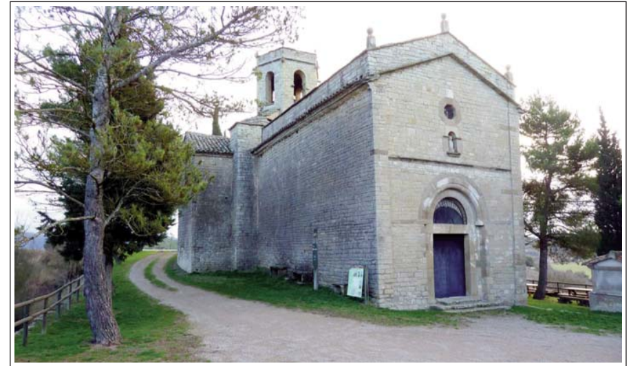
SANTA FE DE CALONGE DE SEGARRA. Visió des del nord-oest.

mig punt d'una sola peça. Al braç sud del transsepte, a la cantonera que mira al portal i a una alçada d'uns 2,70 m hi ha un carreu curiós, amb la figura d'un cérvol esculpida. I a la façana sud, a la cantonera amb la de l'oest, a l'alçada d'una persona, hi ha un altre carreu aprofitat, amb part d'un rellotge de sol esculpit. Tres ares d'altar són recolzades en parets del temple, abandonades, a sol i serena.