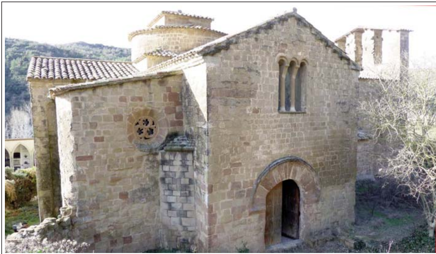
SANTA MARIA DEL PRIORAT DE CASTELLFOLLIT DE RIUBREGÓS. Cara nord amb el portal del priorat, obert al cap del transsepte. Donava al camí ral.

ble torre mestra, del segle XI. Al recinte jussà, el de sota, es conserven diverses estances semisubterrànies i subterrànies, del que havia estat la part residencial. En una de les cambres, on suposadament hi hagué una presó es varen descobrir l'any 1981 uns interessants dibuixos o