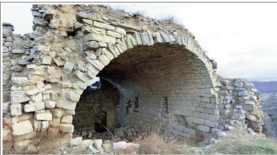
CASTELL DE CALONGE DE SEGARRA. Dels vestigis visibles que encara queden del castell, aquesta és l'estança més gran. A l'interior es pot veure el portal on neix una escala, cegada.

Del castell, en sobreviuen les ruïnes, encastellades dalt d'un turó costerut. Destaquen les restes de parets; una estança rectangular coberta amb una volta de canó; un parell de portes; diversos graons, uns dels quals menen cap a un soterrani tapiat; un cup o tina d'uns 2 m de diàmetre, que es diu que podia haver estat una cisterna i, finalment, les restes del que podria haver estat una torre de planta circular, amb una bona part dels baixos menjats, que fan témer que caiguin d'un moment a l'altre.